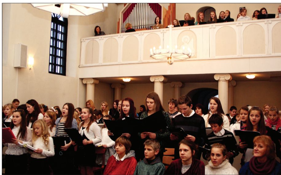
12. decembrī Priekules evaņģēliski luterisko baznīcu ar skanīgām Ziemassvētku dziesmām un skaņdarbiem pieskandināja Priekules novada skolu audzēkņi un pedagogi.