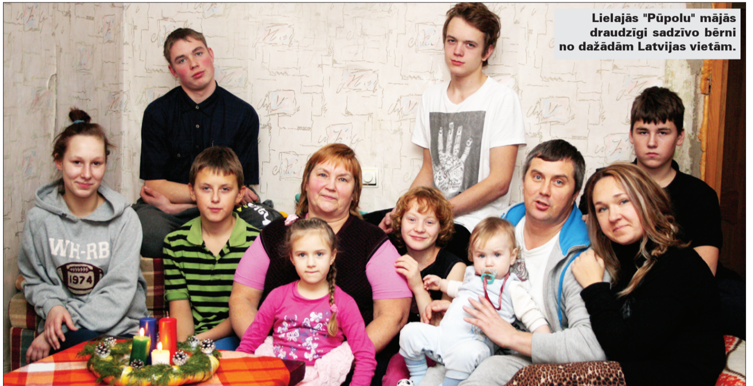
Lielajās "Pūpolu" mājās draudzīgi sadzīvo bērni no dažādām Latvijas vietām.