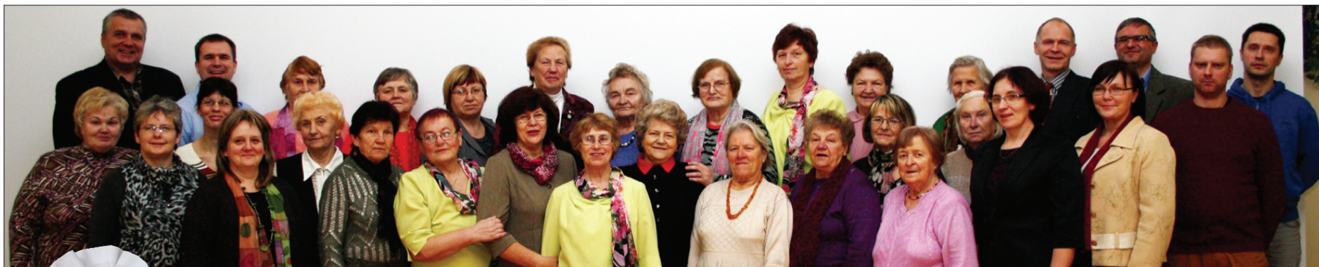
Priekules kultūras namā 9. decembrī notika Priekules novada NVO forums, kurā novada pašvaldības atbalstīto projektu pārstāvji klātesošajiem prezentēja projektu norisi un rezultātus. Aizvadītajā gadā ar pašvaldības atbalstu tapuši vienpadsmit dažāda rakstura projektu, kurus realizējuši astoņi to vadītāji. Šā gada projektos tikuši iesaistīti 394 bērni, 55 pusaudži un jaunieši, 47 pieaugušie un 82 seniori. Brīvprātīgi darbojušies 66 cilvēki, kuri atalgojumu par darbu nesaņēma. Pašvaldības pārstāvji ar laba vēlējumiem sveica projektu vadītājus, pasniedzot nelielas svētku veltes jaunām idejām.