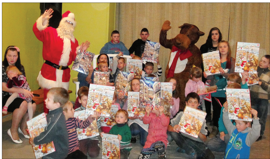
Bērniem lielākais prieks bija par Ziemveciņa un ziemeļbrieža Rūdolfu ierašanos Purmsātos.