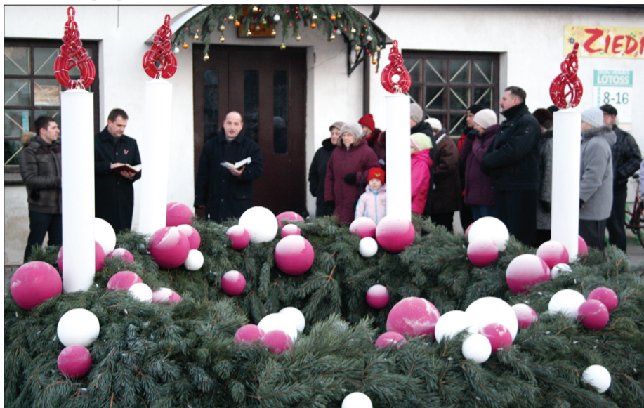
30. novembrī Priekulē notika svinīga pirmās sveces iedegšana Adventa vainagā. Pasākumu kuplināja Priekules baptistu, evaņģēliski luteriskās un vasarsvētku draudžu pārstāvji.