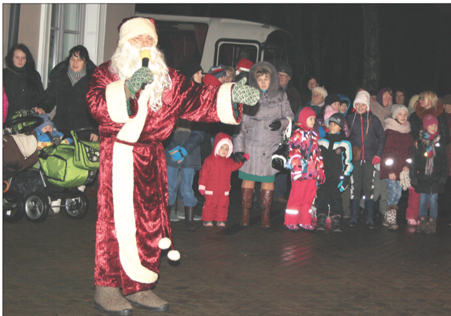
6. decembrī pie Priekules kultūras nama notika pilsētas svētku eglis atklāšana. Neskatoties uz nepatīkamajiem laika apstākļiem, uz pasākumu bija ieradušies iedzīvotāji no visa novada. Sanākušajiem bija iespēja kopīgi iemalkot siltu tēju ar cepumiem, un pēc sveicieniem gaidāmajos svētkos bērni kopā ar Ziemassvētku vecīti, ezīti Fikso un ceļojošo lelļu teātri "Maska" devās rotālās koncertuzvedumā "Ziemassvētku virpulī".