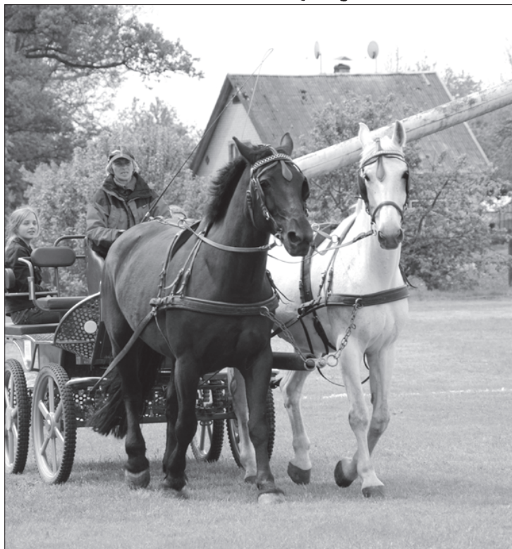
Biedrības "Kanu atvars" pārstāvji aktīvi piedalās arī pajūgu braukšanas sacensībās un ir ieguvuši daudzas godalgotas vietas.

ELFLA programmā "Leader" iesniegts un atbalstu jau guvis arī otrs projekts, kura laikā paredzēts līdz 2012. gada beigām stacijas galvenajai ēkai pievilkt ūdensvadu, ierīkot tualeti,