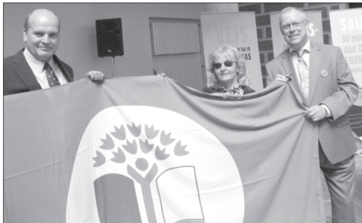
Kalētu pamatskola ir pirmā skola Priekules novadā, pie kuras leņņi plīvos Zaļais karogs.