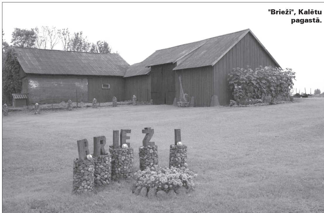
"Brieži", Kalētu pagastā.