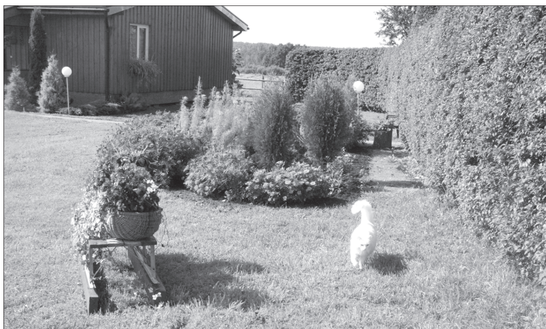
"Vecdzintari", Virgas pagastā.

Jau otro gadu Priekules novadā tiek rīkots konkurss "Par sakoptu Priekules novadu", kurš tiek organizēts divās kārtās – pirmo kārtu organizē pagastu pārvaldes, bet Priekules pilsētā un pagastā – Novada domes izpilddirektora izveidota komisija.