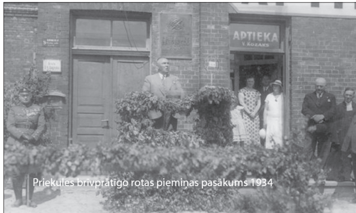
Priekules brīvprātīgo rotas piemiņas pasākums 1934