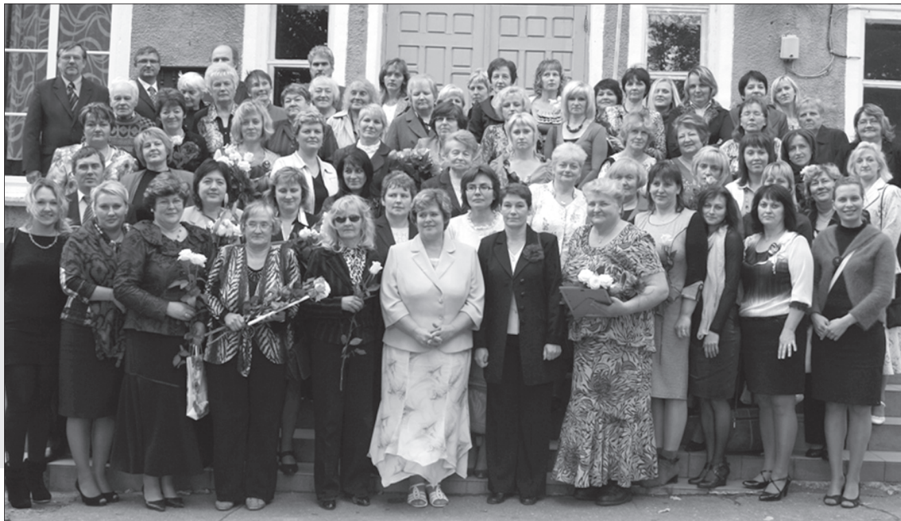
Skolotāju dienas kopbilde pie Kalētu pamatskolas.