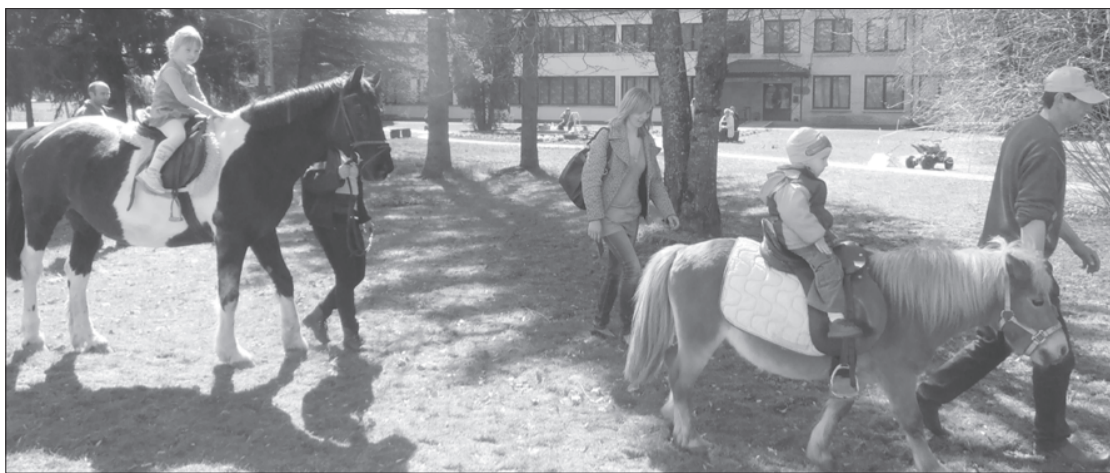
Mazie svētku apmeklētāji steigza izvizināties ar zirdziņiem.

Vakarpusē iedzīvotāji varēja izbaudīt Ainas Apenes šova deju grupas "Rotaļa" dzirkstuļojošo priekšnesumu un ieklausīties Krotas fol-