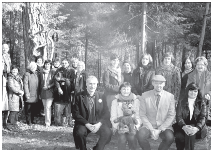
Kopīgs delegāciju foto Kalētu Piediena parkā.

2013.gada pavasarī Priekules novada bibliotekāri izstrādāja vienas dienas plānu, lai demonstrētu lietuviešiem, kāds ir mūsu piedāvājums lasītājiem un mūsu bibliotekāru darba ikdiena. Tādēļ piedāvājam, mūspret, atšķirīgas bibliotēkas, lai redzētais būtu ar paliekošiem iespaidiem un