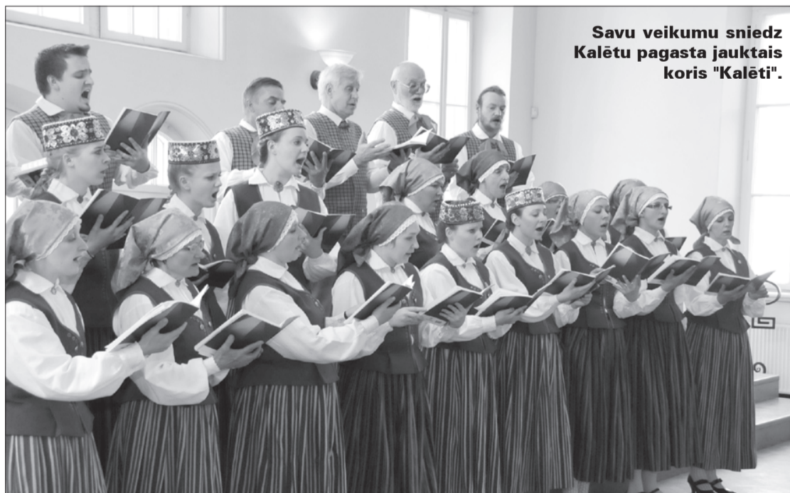
Savu veikumu sniedz Kalētu pagasta jauktais koris "Kalēti".

27. un 28.aprīlī nozīmīgas uzstāšanās un nervu spriedzi piedzīvoja Priekules novada koristi un dejotāji. Lai piedalītos Vispārējos latviešu dziesmu un deju svētkos, kolektīviem žūrijas priekšā bija jāizpilda obligātais un izvēles repertuārs. Neskatoties uz pamatoto uztraukumu, visi trīs mūsu novada kolektīvi pēc žūrijas vērtējuma ir svētku dalībnieki.