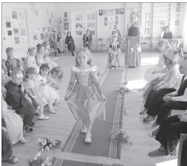
Bērnu vecāki bija īpaši padomājuši par mazo prinču un princešu tērpiem.