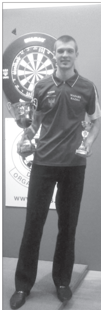
Informāciju no Somijas dārta organizācijas mājaslapas apkopojā un ar Madaru sarunājās Inga

– Emocijas pēc uzvaras izpaudās vienkārši kā prieks, jo kopumā tomēr tas prasīja daudz spēka un tā īsti laika to saprast bija tikai pēc atgriešanās Latvijā, kad visi sāka apsveikt. No citām uzvarām nevēlos nevienu izcelt, jo nav ko dzīvot tikai uz lauriem. Lai cik patīkami ir uzvarēt, uzvara šodien nenozīmē uzvaru rīt. Tāpēc cenšos turēties tuvāk zemei un mācīties no katra zaudējuma. Ja reiz ir tāda iespēja, vēlos pateikties SIA "Unit-centrs", SIA "Kurzemes gaļsaimeņnieks", SIA "Palmeida" un SIA "Auditors Liepāja" vadītājiem par finansiālu atbalstu. Kluba vārdā liels paldies arī Priekules Novada domei un, protams, arī ģimenei, draugiem un visiem pārējiem sveicējiem un līdzjutējiem!