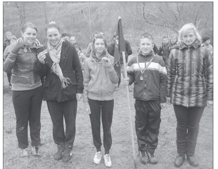
Kalētu komanda ceļojošā kausa izcīņā šogad ieguva 2.vietu.

Kalētu pamatskolas skolotāja un jaunsargu instruktore