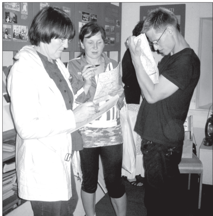
Dalībniekiem tika izsniegtas dalībnieku kartes, kurās vakara gaitā bija jāsavāc paraksti no darbnīcu un viktorīnu vadītājiem.