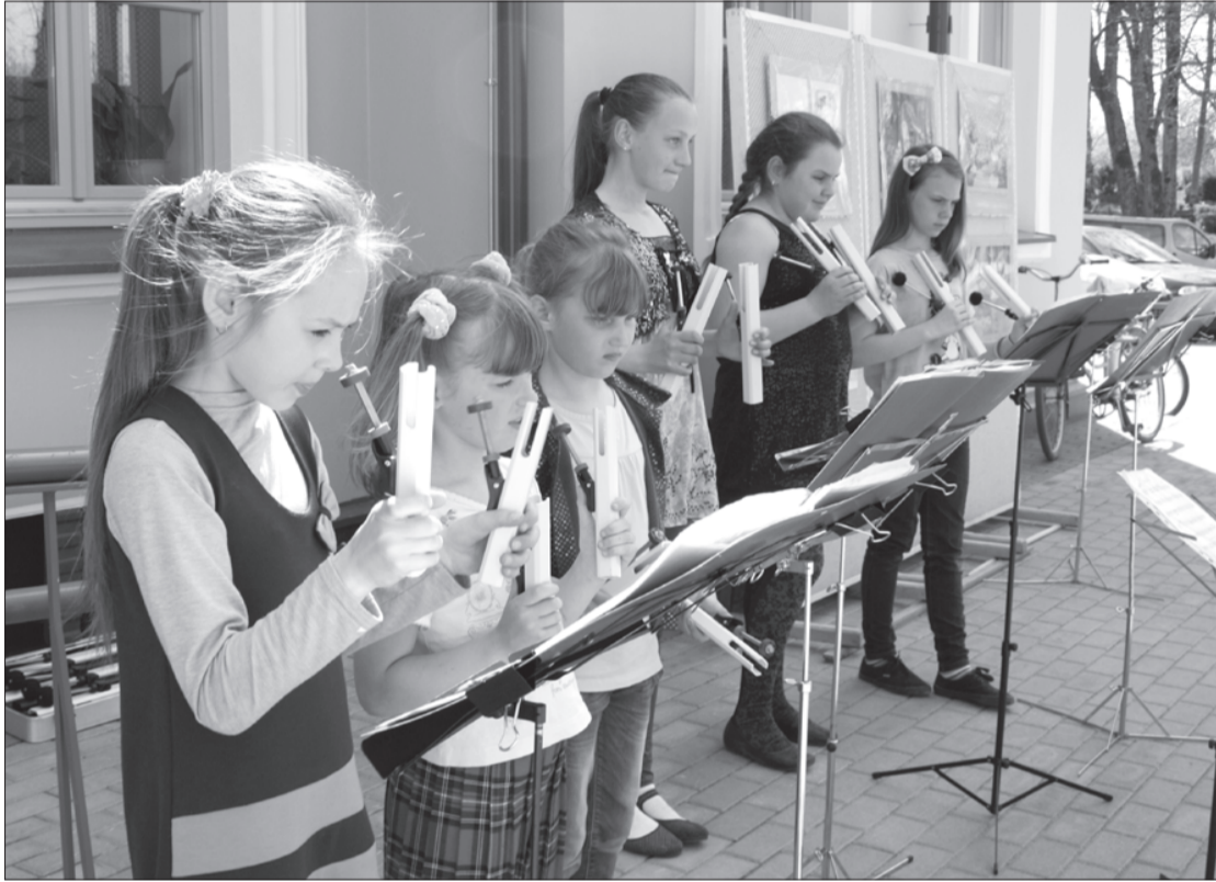
Mākslas dienas pasākumu ieskandināja Priekules mūzikas skolas zvanu ansamblis.