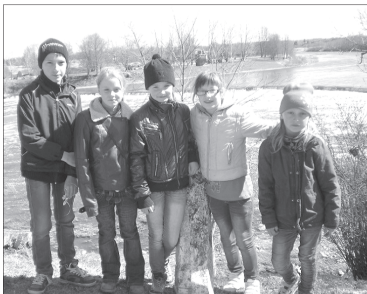
Brīvajā laikā konkursa dalībnieki apskatīja Kuldīgas skaidākās vietas.

Visiem dalībniekiem tika dota iespēja piedalīties dažādās radošajās darbnīcās. Skolēnu darbus vērtēja