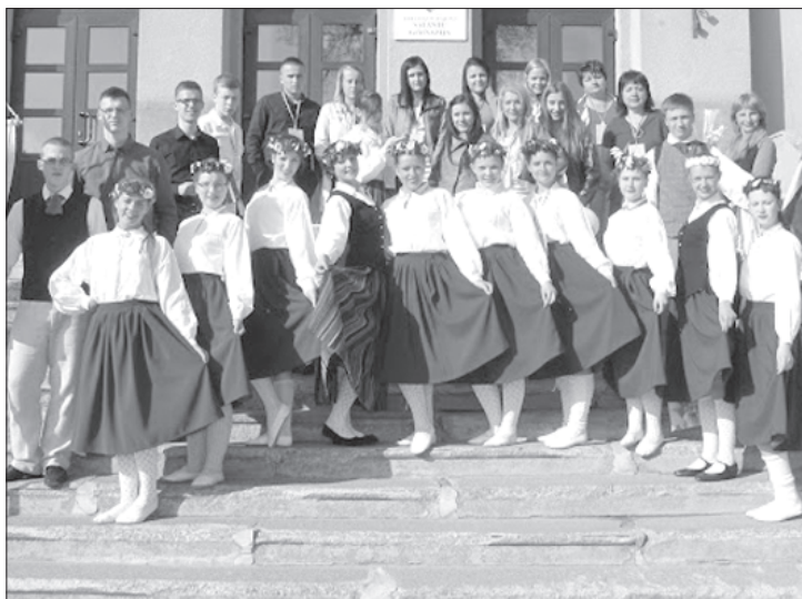
Latvijas delegācija pēc nacionālā tautas koncerta.

interesantas stafetes, ielu basketbols vai futbols, spēles brīvā dabā.