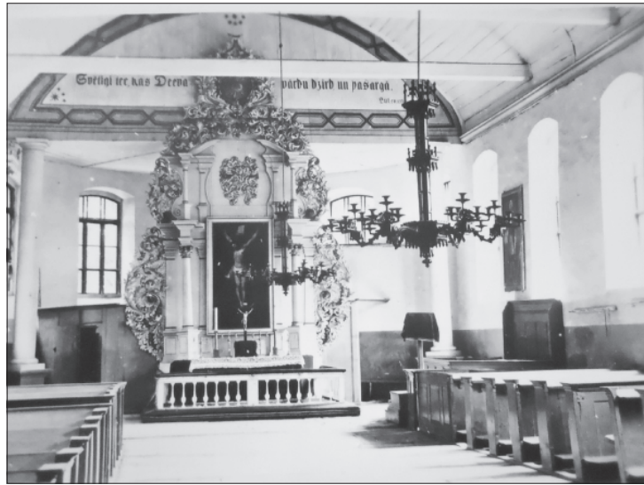
Gramzdas baznīcas altāris 20. gs. 20.–30. gados.

Viņš cēla savu svētnīcu līdzīgu augstajiem kalniem un tik spēcīgu kā zeme, kurai viņš mūžīgus pamatus licis. (Ps.78:69)