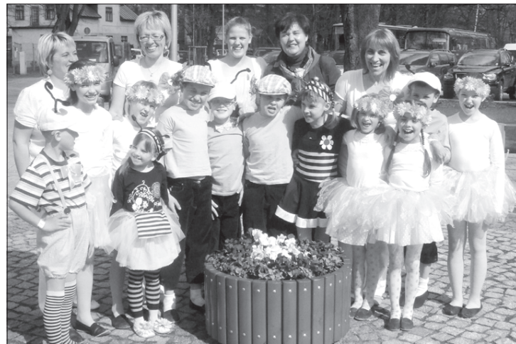
Šogad festivāla "Nāc līdzās!" laureātu gods tika Purmsātu Speciālajai internātpamatskolai.