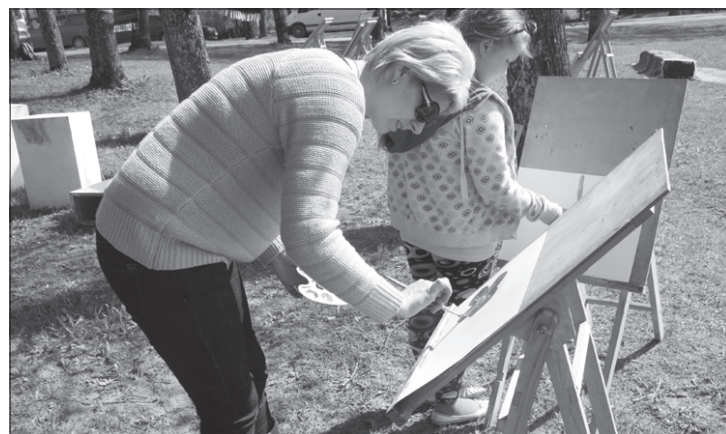
Pasākuma laikā gan bērni, gan pieaugušie varēja iemēģināt roku gleznošanā un piedalīties arī citās praktiskajās nodarbībās.