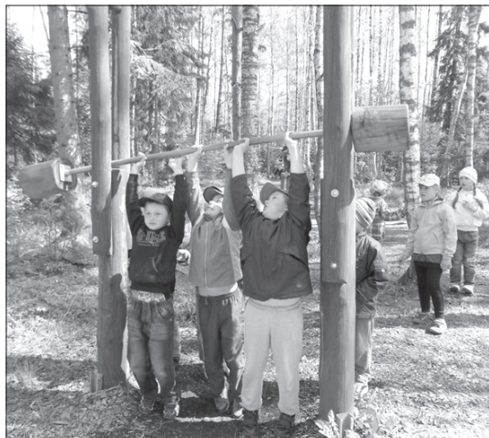
Bērņi ar lielu aizrautību izgāja sporta taku.

Ar to vēl ekskursija nebeidzās, pēc iepazīšanās ar bitēm gājām paēst līdzpaņemtās pusdienas, jo vēl ir jāredz putnu taka un jāizvingrinās sporta takā. Putnu takā bērņiem vislabāk