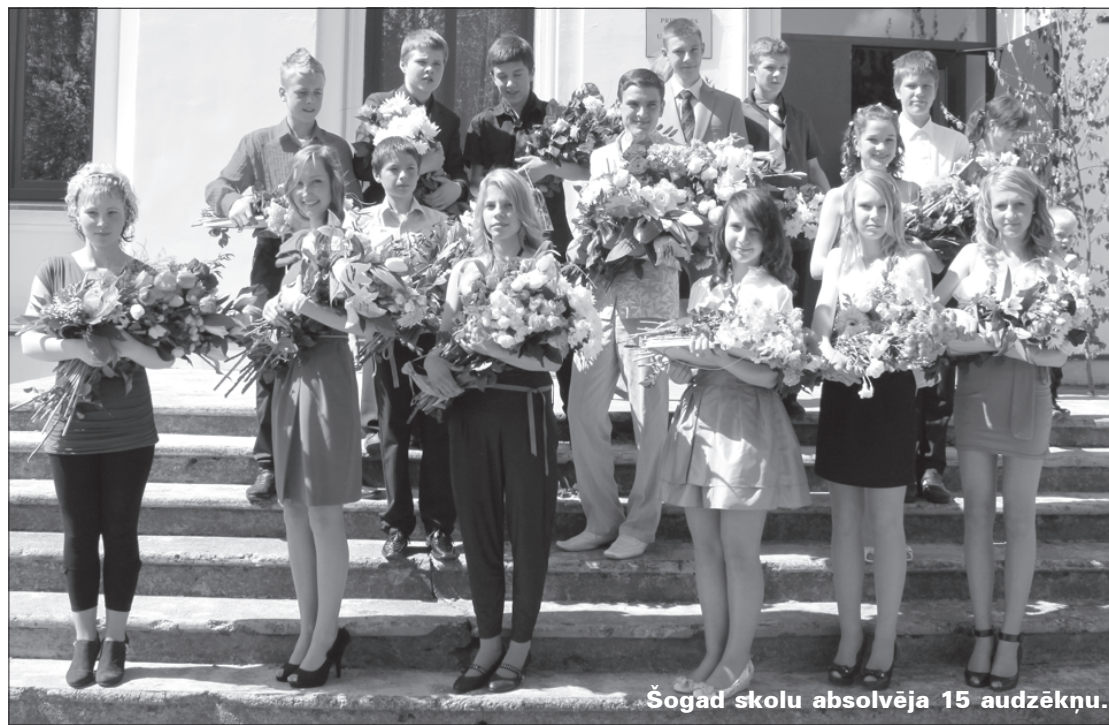
Šogad skolu absolvēja 15 audzēkņi.

apvienojās gan skolas mūziķi, gan mākslinieki, šī mācību gada laikā