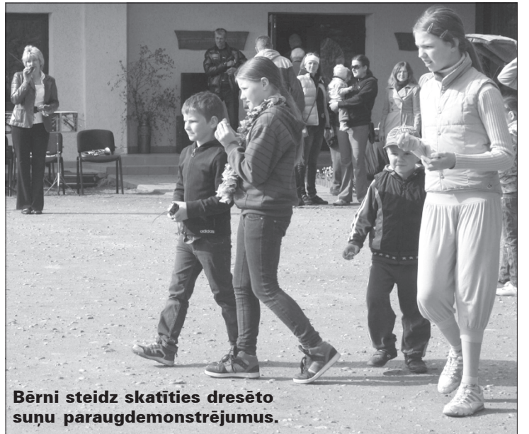
Bērni steidz skatīties dresēto suņu paraugdemonstrējumus.

Ar bagātu svētku programmu 4. maijā tika svinēti Bunkas pagasta svētki.