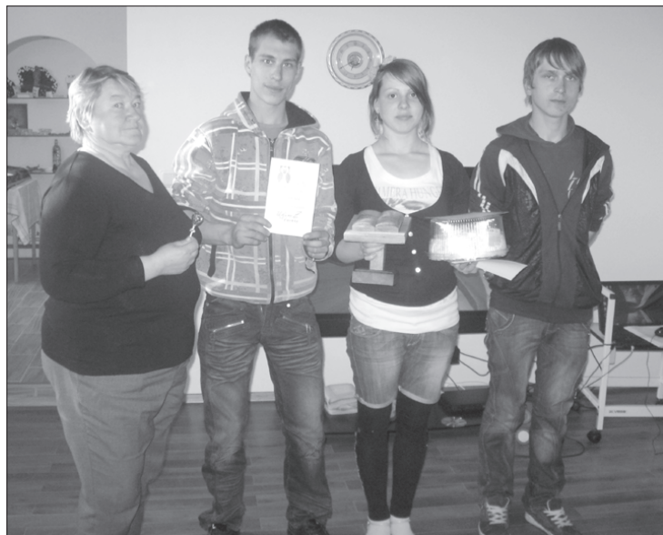
"Grāmatu dueļa" uzvarētāji – 1. kurss.

Šajā mācību gadā skolā aktualizējam lasītprasmes veicināšanu. Gada garumā visu klašu skolēni piedalījās trīs "Grāmatu dueļa" kārtās. Bērnu redzesloks tika paplašināts, izmantojot skolas bibliotēkas resursus, interaktīvo televīziju un multimediju iekārtas. Katra klase kopā ar audzinātāju izveidoja komandu ar nosaukumu, zīmēja un gatavoja komandas atbalsta grupas plakātus. Saistošs izdevās lielformāta ilustrētais darbs "Emīla nedarbi", tam blakus labprāt fotografējās gan komandu dalībnieki, gan klašu audzinātāji, arī "Grāmatu dueļa" vadītājas. Oriģināli tika veidoti grāmatu varoņu tērpi – princese no lugas "Sprīdītis", sirmmāmiņa no "Maijas un Paijas" – un vienotās emblēmas, kuras izveidoja 8. klases zēni. Spraigā komandu cīņā katra klase pelnīja uzvaras punktus. Par triju veidu uzdevumiem punktu skaits pieauga, daloties domās un precīzi atbildot uz jautājumiem par izlasītajām grāmatām, kā arī izveloties komandu noformējumu. Azartisku spriedzi radīja ikkatra puspunkta pārsvars, klases priekā triumfēja par godalgotajām vietām. Bērni un jaunieši