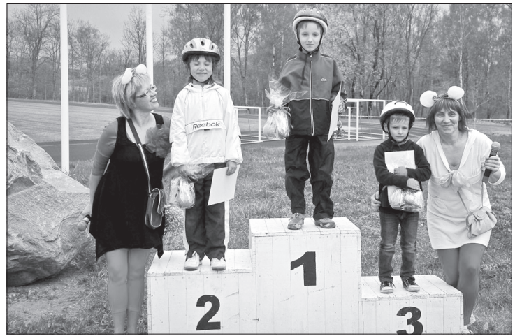
6 un 7 gadus veco bērnu grupas uzvarētāji kopā ar velosējiem.