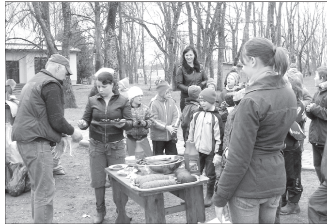
Krotas pamatskolas skolēni un pedagogi pēc labi padarīta darba mēlojas ar gardām pusdienām.

Bunkas pagastā talkots tika jau 20. aprīlī, kad skolas apkārtni un abus Krotas parkus sakopa Krotas Ata Kronvalda pamatskolas darbinieki un bērni, bet Bunkas pagasta pārvaldes darbinieki sakopa Bunkas centru, parku un mehānisko darbnīcu pagalmu.