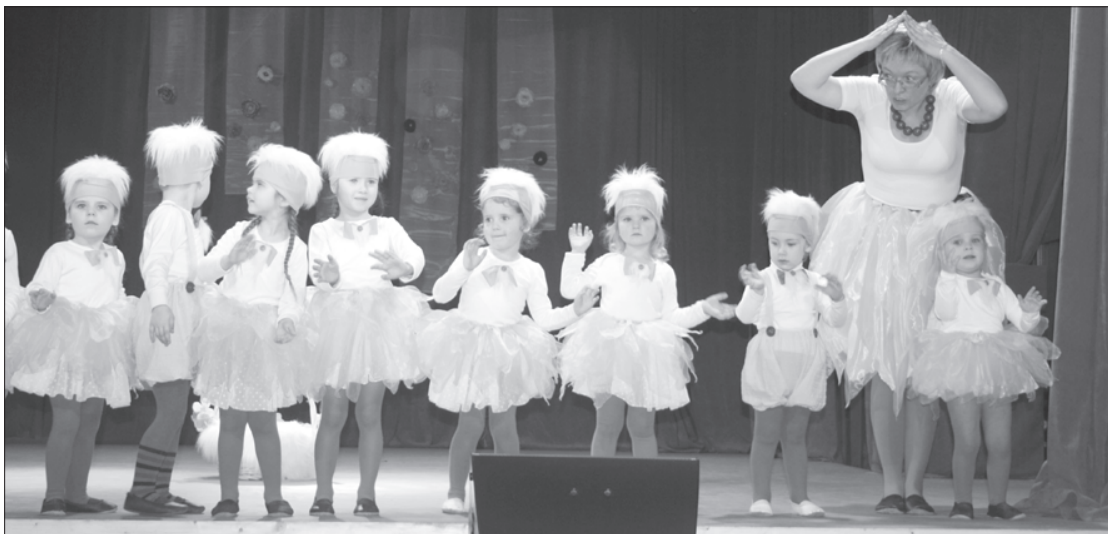
Pašdarbnieku koncertā skatītājus priecēja teatralās deju studijas "Ķiņķēziņi" mazākie dalībnieki.

22. aprīļa pēcpusdienā līdz ar Liepājas reģiona koru skates rezultātu paziņošanu ir pierimis Priekules Kultūras nama pašdarbnieku lielais uztraukums un pirmskates nervozēšana. Tie kolektīvi, kuriem ir bijis jāpiedalās skatēs, ir startējuši godam savu iespēju robežās. Līdz sezonas beigām dejojotājiem vēl jāpiedalās deju svētkos Liepājā un Ventspilī. Dramatiskais kolektīvs piedalīsies Grobiņas Pilsētas svētkos un Skrundas teātra festivālā. Sieviešu koris 2. jūnijā dosies uz sieviešu un vīru koru salidojumu Ērgļu novada