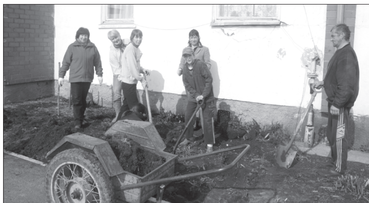
Aktīvi talkotāji šogad bija arī Priekules pagasta Kalnenieku ciema iedzīvotāji.

Projektā atjaunoti esošie elementi, segumi, pievienotas jaunas lietas, kuru pagalmā pietrūcis. Galvenais akcents likts uz bērnu atpūtas un brīvā laika pavadīšanas iespējām. Projektā piešķirti 1000 latu, taja ietilpa ainavas projekta izstrādes izmaksas, daļa rotaļu laukumu elementu, kā arī apzālumošanai paredzēto apstādījumu iegāde. Paši ie-