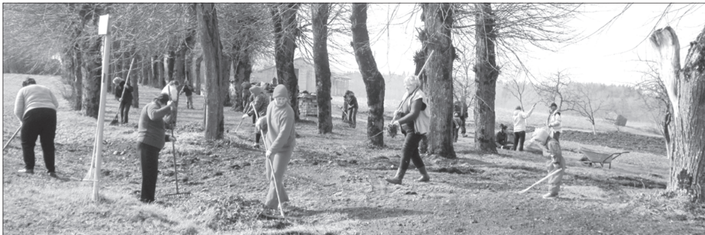
Gramzdā iedzīvotāji talkoja pie luterāņu baznīcas, kas maijā svinēs savu 445. gadadienu.