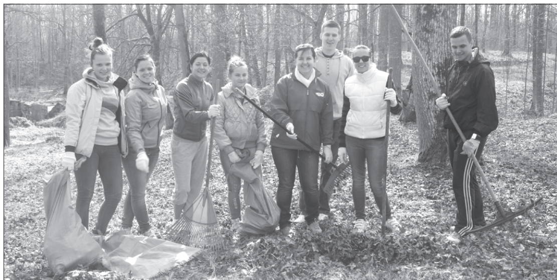
Priekules jaunieši sakopa pilsētas parku.