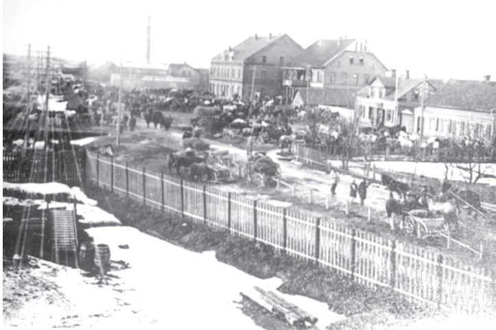
Priekules tirgus laukums. 20. gs. 30. gadi.

2012. gadā atzīmējam Priekules miesta tiesību iegūšanas 90. gadskārtu, tāpēc atcerēsimies dažas vēstures lapas.