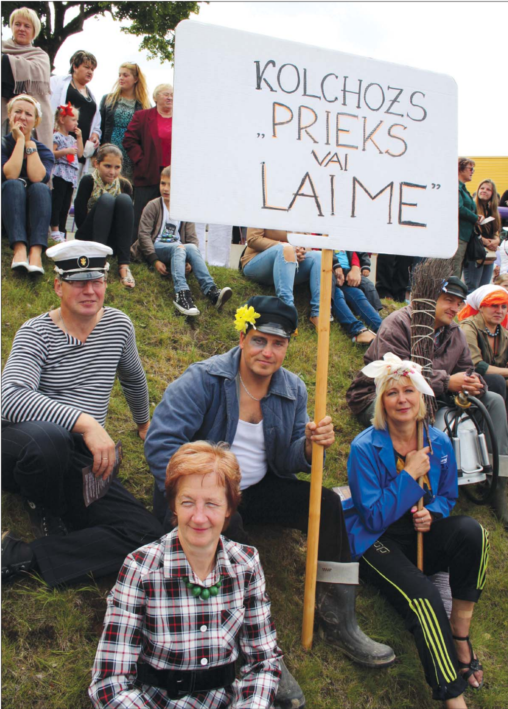
Priekules Kultūras nama dramatiskā kopa svētku gājienā pārtapa kolhoza ļaudis no "Prieks vai laime".

KLUCIM, kas ceļotājus muzikāli sagaidīja Priekules ev. lut. baznīcā.