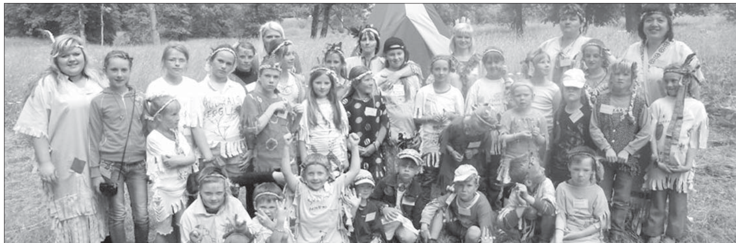
Nometnes "Jautrie indiāņi" dalībnieki.

Priekules vidusskolas apkārtnē tika iekārtots indiāņu ciemats ar vigvamu un ugunsgrābi. Nometnes dalībnieki tika iepazīstināti ar indiāņu vēsturi, tradīcijām un dzīvesveidu, savukārt vēlāk bērni izveidoja vairākas ciltis. Katra cilts izveidoja savu karogu, kā arī izvēlēja savu mazo virsaiti, kas visas trīs dienas par savu cilti rūpējās. Šajās dienās bērni apguva Priekules indiāņu himnu, gatavoja indiāņu galvas rotas, rokas-