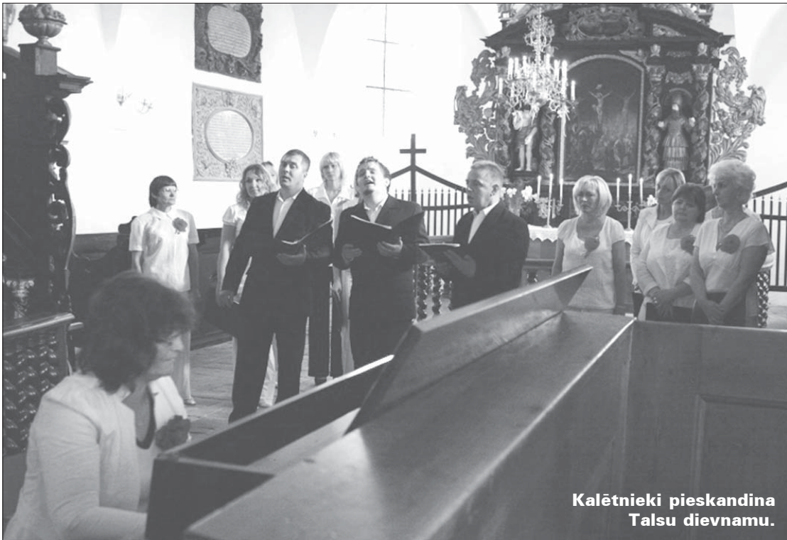
Kalētnieki pieskandina Talsu dievnamu.

Šovasar 22. jūlijā jauktais koris "Kalēti", vīru vokālais ansamblis, Kalētu bērnu un jauniešu instrumentālais ansamblis "Bukanti" kopā ar Liepājas katoļu skolas zvanu an-