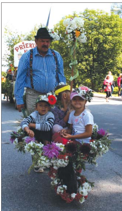
Svētku gājienam saposti bija pat braucamriki.

Gājienu kuplināja Baptistu draudzes māmiņas ar bērniem.