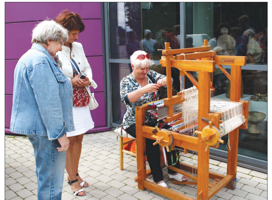
Svētku dalībniekiem bija iespēja piedalīties Priekules vēstures tapšanā, ieaužot kopdarbā savu vēstījumu pilsētai.