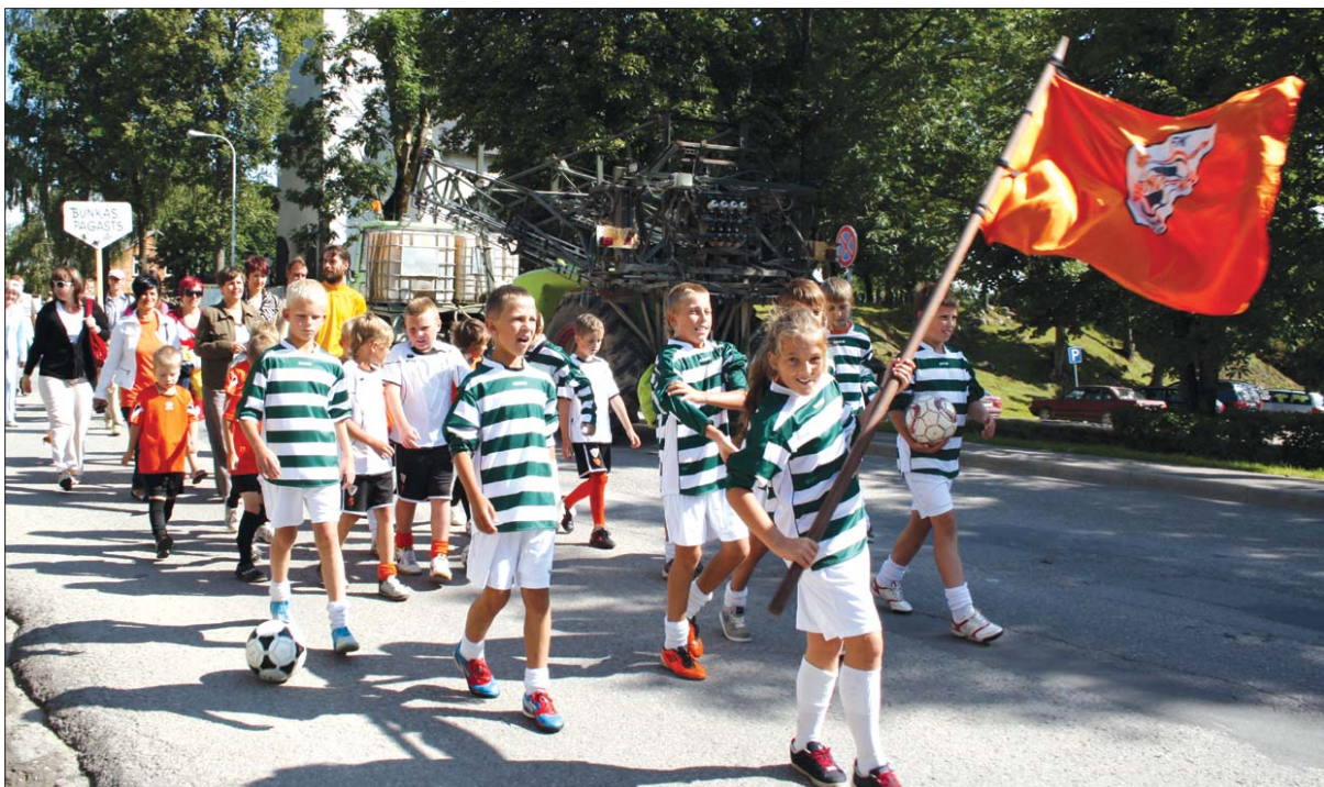
Sportiskā garā gājiēnā devās futbola kluba "Bandava" dalībnieki.