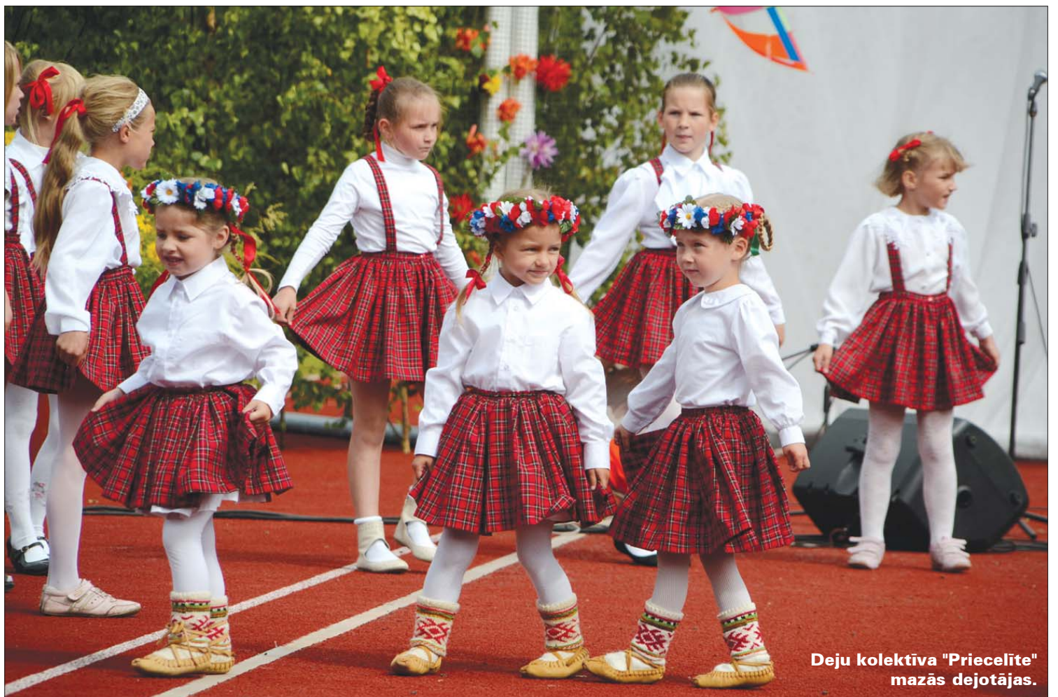
Deju kolektīva "Priecelīte" mazās dejotājas.