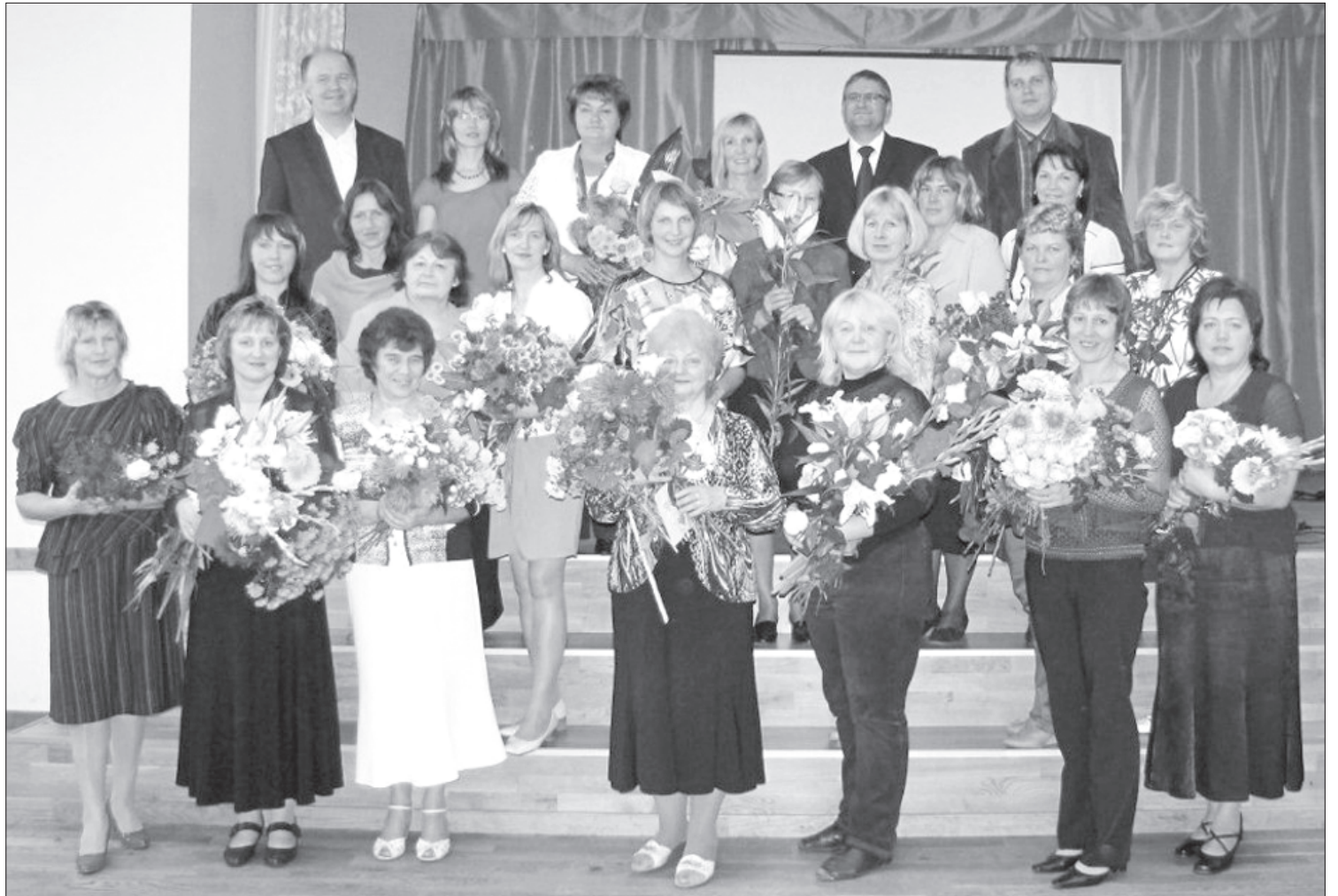
Priekules vidusskolas pedagogi ar skolēnu dāvinātiem ziediem.

5. oktobrī Priekules vidusskolā Skolotāju dienu organizēja 12. klases audzēkņi. Skolēniem, kuri mācās no 1. līdz 9. klasei, stundas vadīja 10. – 12. klases audzēkņi. Stundās skolēni gan rēķināja, gan spēlēja spēles, gan pildīja atjautības uzdevumus, gan darbojās ar rokdarbiem. Kamēr skolēni mācījās, skolotāji izbaudīja svētkus. No rīta pedagogi tika aicināti pie kafijas galda baudīt Priekules konditorijas kliņģeri un citus gardumus. Nedomājiet, ka skolotāji tikai atpūtās, nebūt ne, jo arī viņiem nācās pildīt dažādus āķīgus uzdevumus, kuru mērķis bija pārbaudīt viņu attapību. Kad kafijas tasītes jau bija tukšas un kliņģeris apēsts, pedagogi tika aicināti uz skolas zāli, lai baudītu īpaši viņiem gatavotu pasākumu. Tā sākumā 12. klases audzēkņi bija sagatavojuši TV šovu, kurā varēja novērtēt jaunākās "Top Shop" reklāmas, uzzināt jaunākās ziņas, noskaidrot laika prognozes, atskatīties uz olimpiskajām spēlēm u.c. Protams, tā nebija kārtējā garlaicīgā televīzijas pārraide, bet smieklīgs bagāts raidījums, kura laikā varēja dzirdēt jaunākos notikumus par un ap Priekules vidusskolas skolotājiem, minot viņus smieklīgos notikumus. Pasākumu izskaņā tika veltīts neliels