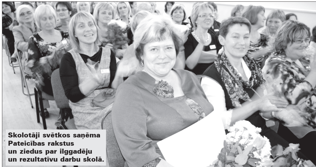
Skolotāji svētkos saņēma Pateicības rakstus un ziedus par ilggadēju un rezultatīvu darbu skolā.