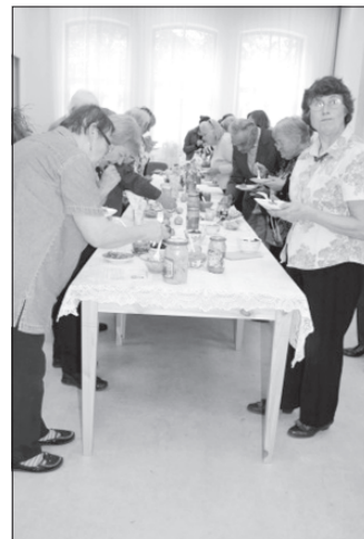
Sanākušās saimnieces degustē ziemai sagatavotos gardumus.