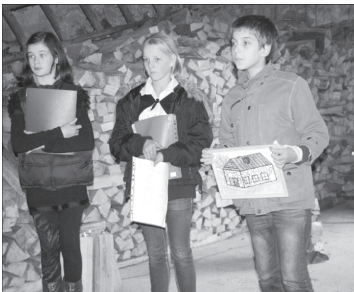
Bērni par godu "Rožleju" mājām bija gan zīmējuši, gan sacerējuši dzejoļus.