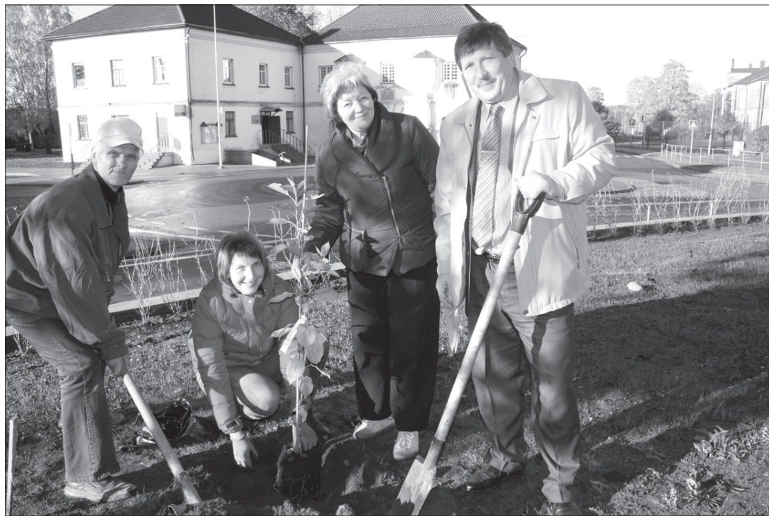
Ābeliņu stādīšanā piedalījās gan domes pārstāvji, gan Vaiņodes ielas 1. mājas iedzīvotāji.

25. oktobrī projekts "Aizputes, Vaiņodes, Uzvaras un Zviedru vārtu ielu krustojuma rekonstrukcija Priekules pilsētā" tika nodots ekspluatācijā. Būvdarbu kopējās izmaksas ir ap 343 000 latu, no kā Eiropas Reģionālās attīstības fonda finansējums ir 173 647,51 lats.