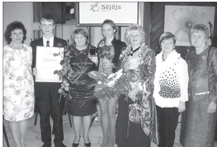
Laureātus sveica arī zemkopības ministre Laimdota Straujuma (trešā no kreisās).