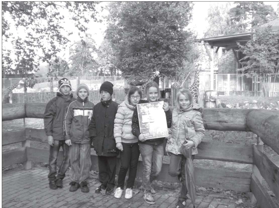
Bērni apskatīja arī citus zoodārza iemītniekus.

Kādu dienu mēs, Virgas pamatskolas 4. klases skolēni, saņēmām nolikumu konkursam "Sveiciens lāčiem jaunās mājās". Apspriedāmies un sākām gatavot konkursam darbu – izdomājām dzejoļus un zīmējām zīmējumus par lāčiem. Divās nedēļās darbs bija gatavs.