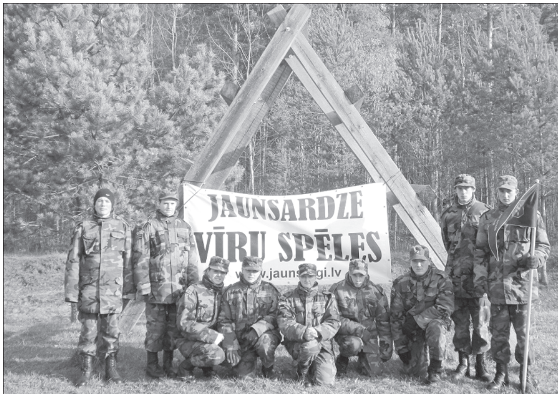
"Vīru spēlēs" piedalījās arī Kalētu komanda. Bija arī tādas komandas, kas šādā pārgājienā devās pirmo reizi, tāpēc bija liela neziņa, kā visi komandas dalībnieki fiziski un morāli izturēs šo trasi.

Visas nometnes garumā paralēli vīru spēlēm darbojās jau iepriekš pieminētā "Žurnālistu skola", kur vienam jaunsargam no katras vienības bija iespēja apgūt zināšanas militārajā žurnālistikā. Arī žurnālisti tika vērtēti. Nometnes "Žurnālistu skolas" jaunsargi