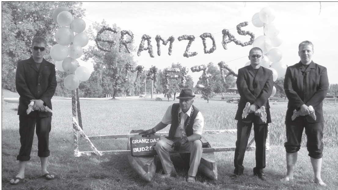
Gramzdas "mafijas boss" ar saviem miesassargiem.

Sestdien, 14. augustā, Priekulē tika svinēti septiņi Ikara svētki. Jau septiņos no rīta pilsētu modināja pūtēju orķestris. Šogad svētkus atklāja pie Kultūras nama, kur notika Ikara spārnu vēziens pāri strūklakas diķim. Komandas no katra pagasta bija izdomājušas ko interesantu. Priekuli pārstāvēja kalēja Ikara palīgi, kuri ar plosta un improvizētu spārnu palīdzību veiksmīgi "pārlidoja" diķīti. Gramzdas pagasts bija atsūtījis savu "mafiju ar bosu". Viņi vienīgi dabūja izbaudīt aukstas peldes, jo peldlīdzeklis nenoturēja "smago naudas portfeli", izpelnoties skatītāju aplausus un ovācijas. No Bunkas bija atlidojušas "nerātnās raganiņas", kuras Novada domes priekšsēdētājam uzdāvināja savu "braucamriku". Virga demonstrēja un piedāvāja Ikaram jaunu tērpu, bet Kalēti ar