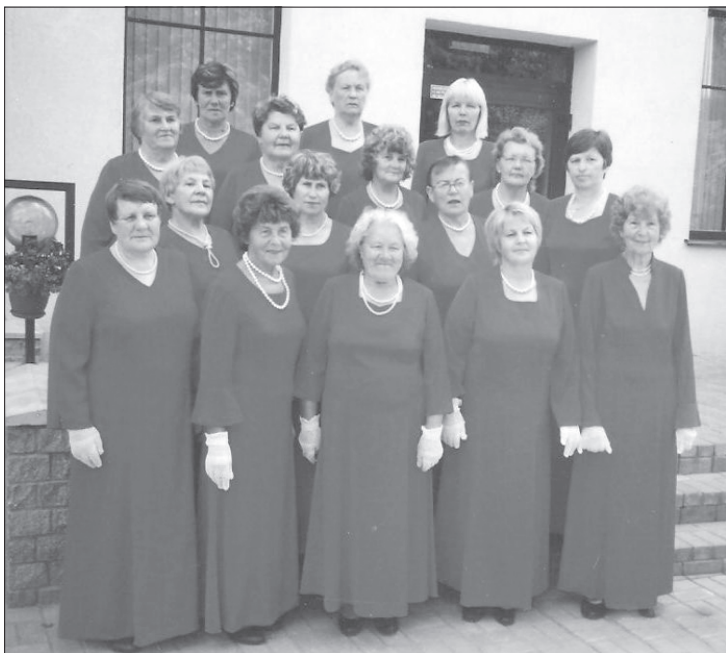
Saskanīgais, draudzīgais un dzīvespriecīgais kolektīvs.

30.–31. jūlijā Eiropas deju kopa "Valceris" devās uz Valku, lai dejotu trešajā starptautiskajā deju festivālā, kurš tiek rīkots reizi trijos gados. Šogad uz festivālu organizatori aicināja 25 deju kopas. Mums šķita, ka dodamies tālā, skaistā vasaras izbraukumā, kurā būs jānedejo piecas dejas, bet nokļūvām gandrīz vai Dziesmu un deju svētku mēģinājuma laukumā, kur pēc striktām virsvadītāja un režisora komandām jāveido laukuma zīmējumi, dejas kolektīvam jāmainās un jādejo ar cita kolektīva deju. Lielākā daļa kolektīvu apjuka, to skaitā arī mēs. Kādu brīdi iestājās "vistas aklums". Bet visi saņēmām un pēc ilgiem mēģinājumiem uzvedums "Sapņu kuģis Angelika" izdevās emocionāls un mākslinieciski augstvērtīgs ar savu ideju, stāstu un kapteini uz komandtiltiņa, īgaunu matrožu komandu un krāšņu uģužošanu nobeigumā.