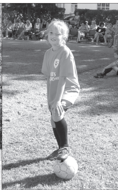
Futbola klubā "Bandava" spēlē arī meitenes.