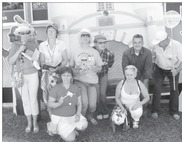
Priekules drāmas kopas kolektīvs.

Priekules dramatisks kolektīvs ar izrādi "Priekule bija, ir un būs" aicināja skatītājus iepazīties ar mūsu