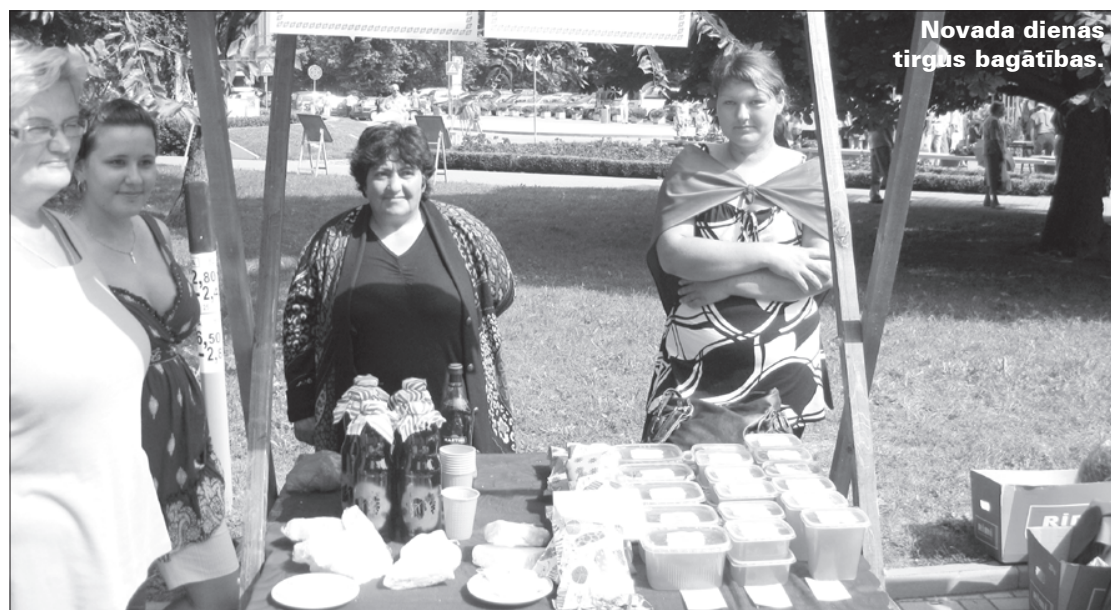
Novada dienas tirgus bagātības.