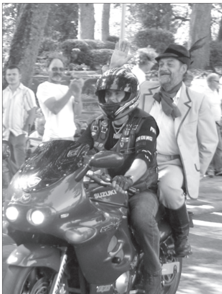
Motorizētā barona fon Korfa ierašanās.