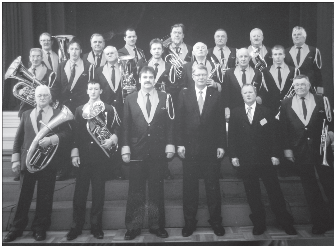
Laimonis Punga (otrajā rindā trešais no labās) kopā ar Kazdangas pūtēju orķestri un Valsts prezidentu Valdi Zatleru.

"Labām lietām cilvēks nekad nav par vecu..."