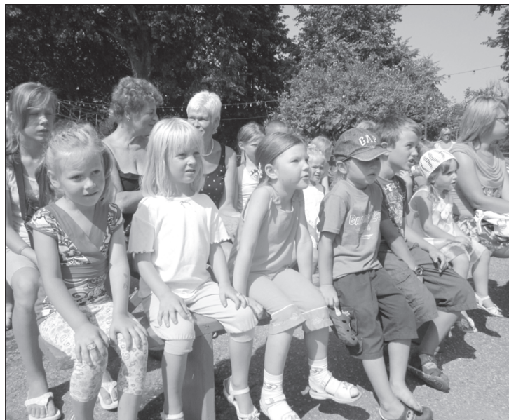
Bērni ar interesi skatījās leļļu teātra "Maska" izrādi "Draudzēsīmies".