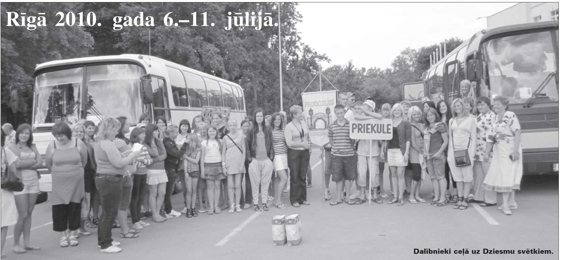
Dalībnieki ceļā uz Dziesmu svētkiem.