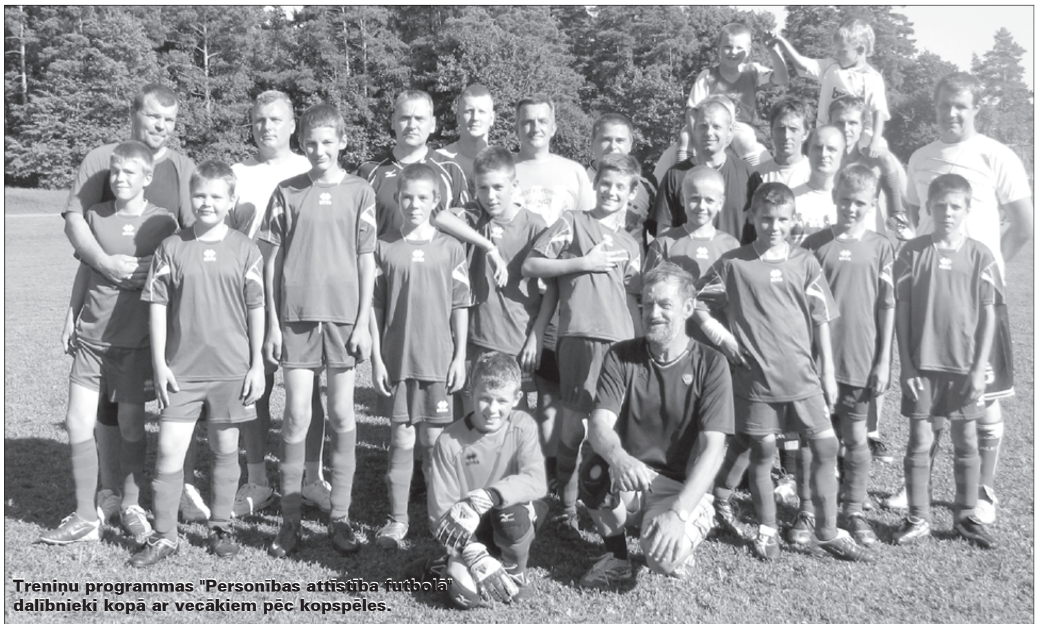
Treniņu programmas "Personības attīstība futbolā" dalībnieki kopā ar vecākiem pēc kopspēles.