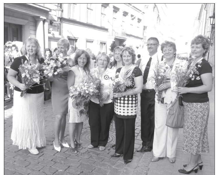
Pedagogi un Priekules Novada domes priekšsēdētāja jaukā svētku noskaņojumā.

Priekules vidusskolas folkloras kopa "Priecele" devās uz X Latvijas Skolu jaunatnes dziesmu un deju svētkiem. Jau no paša rīta jutāmiem pacilāti un satraukti. Tādi svētki ir ļoti gaidīti un ar īpašu auru. Jauko noskaņu paspilgtināja arī tas, ka pirms izbraukšanas izgreznojām autobusu ar zaru vītņi. Likās, ka visi redz un apskauž mūs, jo mēs esam tie, kas var klātienē izbaudīt lielos svētkus.