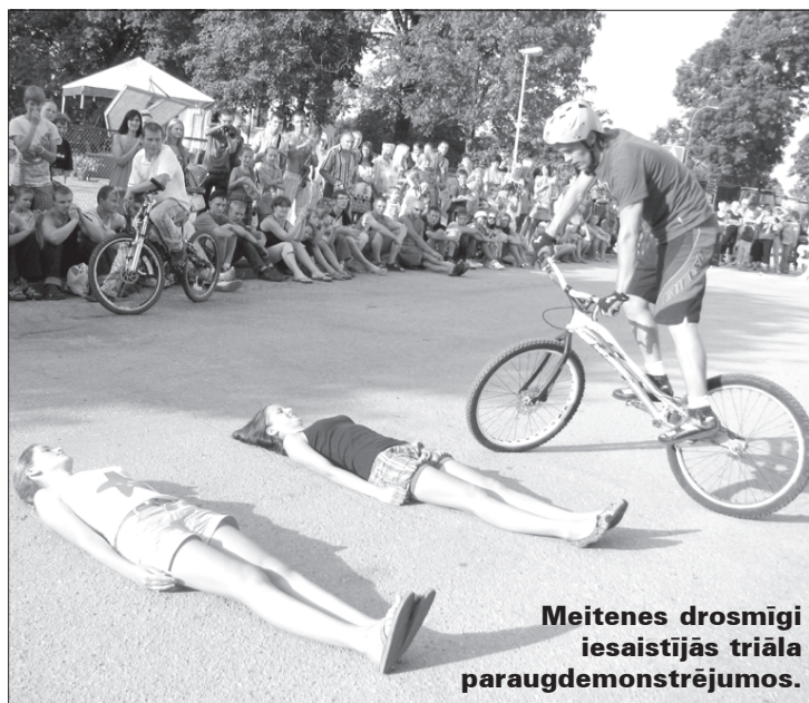
Meitenes drosmīgi iesaistījās triāla paraugdemonstrējumos.