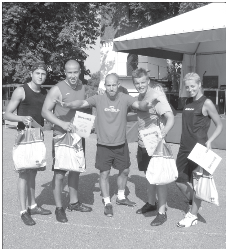
Priecīgie Ikara kausa ieguvēji.