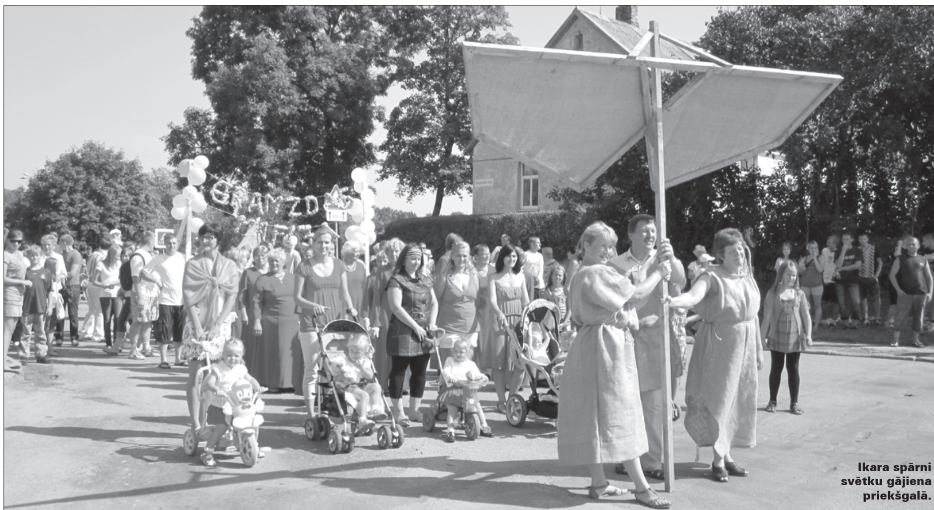
Ikara spārni svētku gājiena priekšgalā.