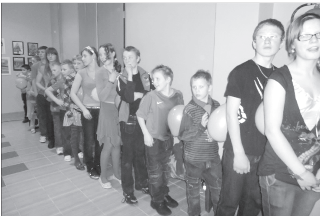
Diskotēku aizraujošāku padarīja daudzveidīgas atrakcijas.

Maija Bungše, Gramzdas pamatskolas latviešu valodas un literatūras skolotāja