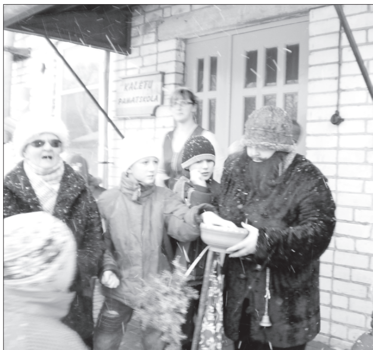
Ciemos pie mazajiem kalētniekiem bija ieradies pats Metenis.