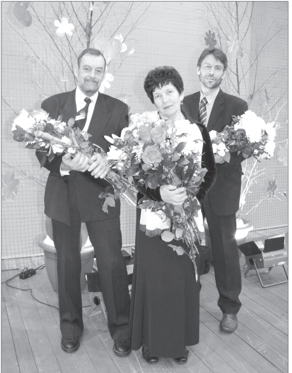
"Goda priekulnieki – 2010" – Dzintaru ģimene.