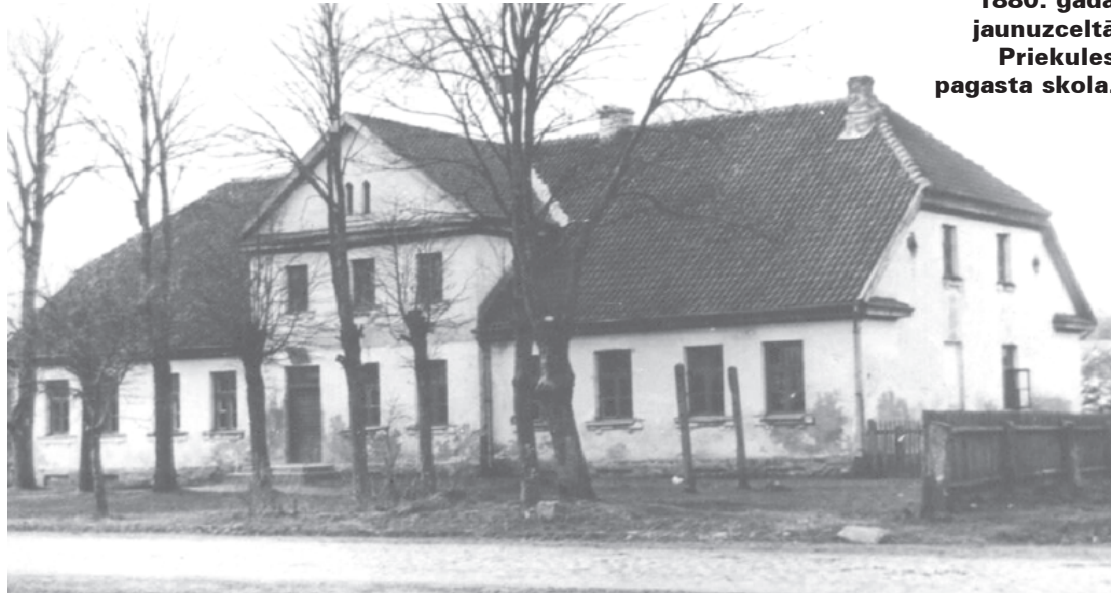
1880. gadā jaunuzceltā Priekules pagasta skola.