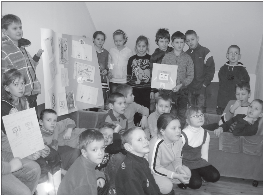
Jaunāko klašu skolēni ar plakātiem par drošu internetu.