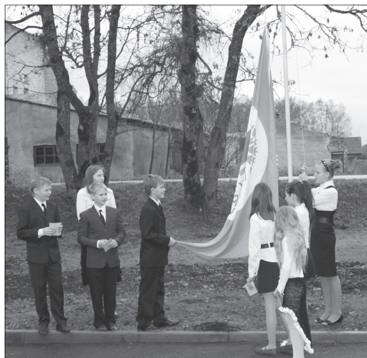
Zaļā karoga pacelšanas svētki.

Kalētu ekoskolas ekopadome izteic pateicību katram Kalētu pagasta iedzīvotājam un katram Kalētu skolas skolniekam, skolotājam un darbinie-