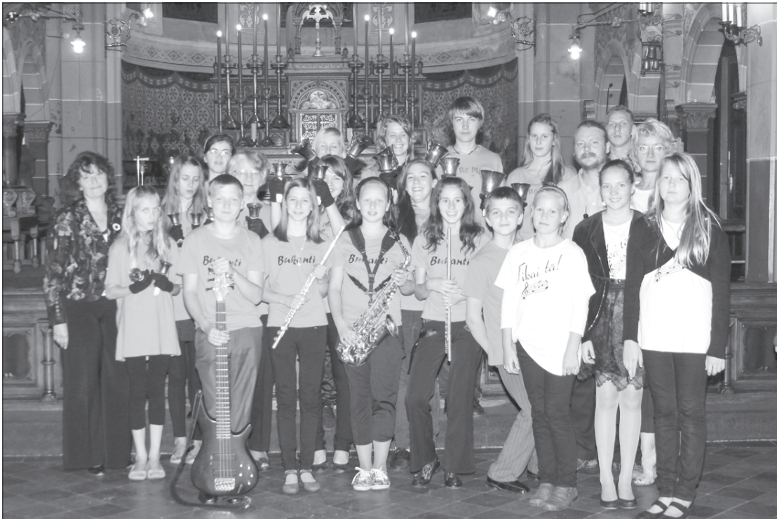
Ansambļa "Bukanti" dalībnieki.

Ir klāt septembris – pirmais rudens mēnesis, sācies jaunais mācību gads. Kalētu Mūzikas un mākslas skolas kolektīvam šī ir bijusi darbīga vasara. Ir licencētas divas jaunas mūzikas programmas – sitamo instrumentu spēle un kora klase, iegādāts jauns mūzikas instruments – marimba, kuras skanējumu pirmajā skolas dienā jau varēja baudīt visi svinīgā pasākuma dalībnieki. Arī klase atbilstoši jaunajam mūzikas instrumentam tika izremontēta un iekārtota.