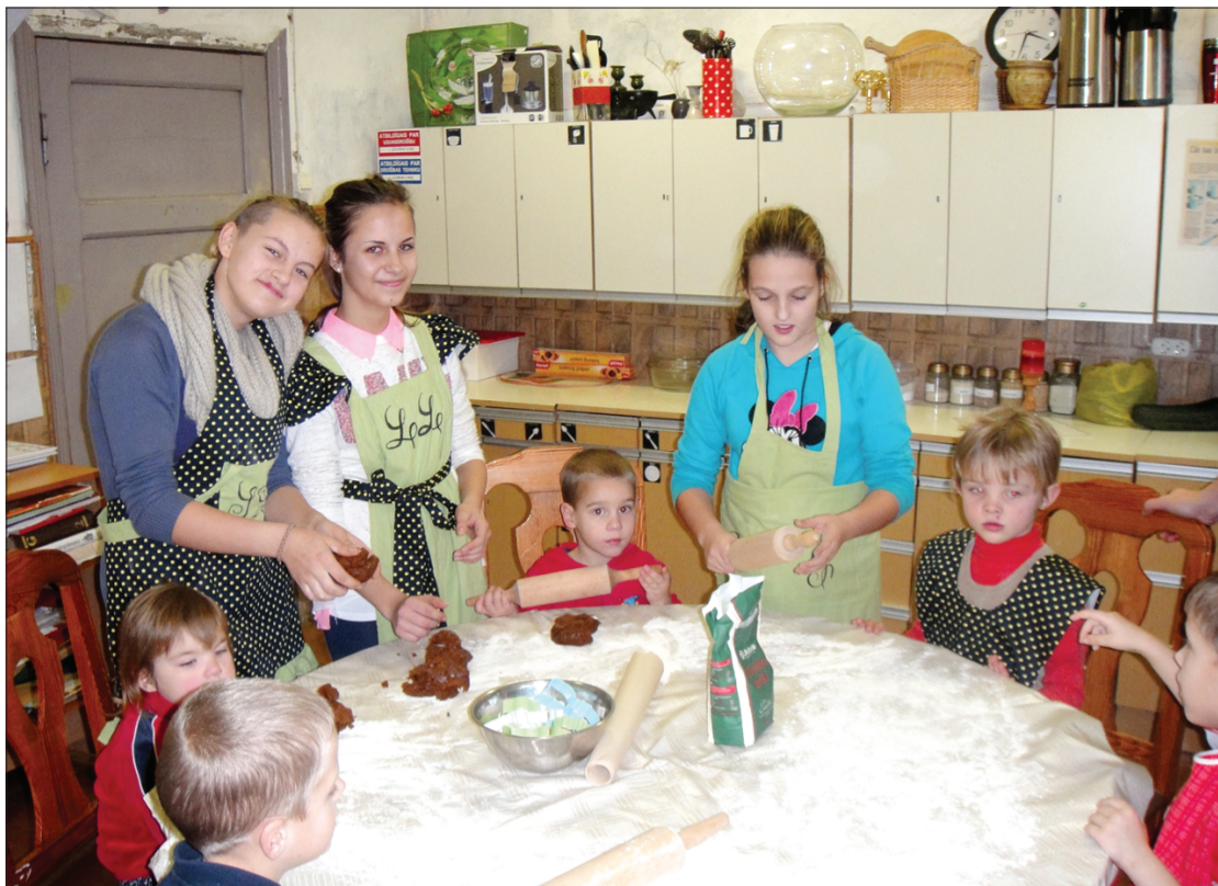
Visā skolā bija jūtama Piparkūku darbnīcas radītā smarža.