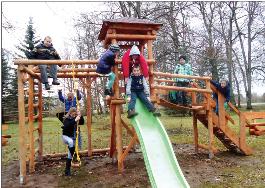
Priecīgi par jauno rotaļlaukumu ir Gramzdas bērni.