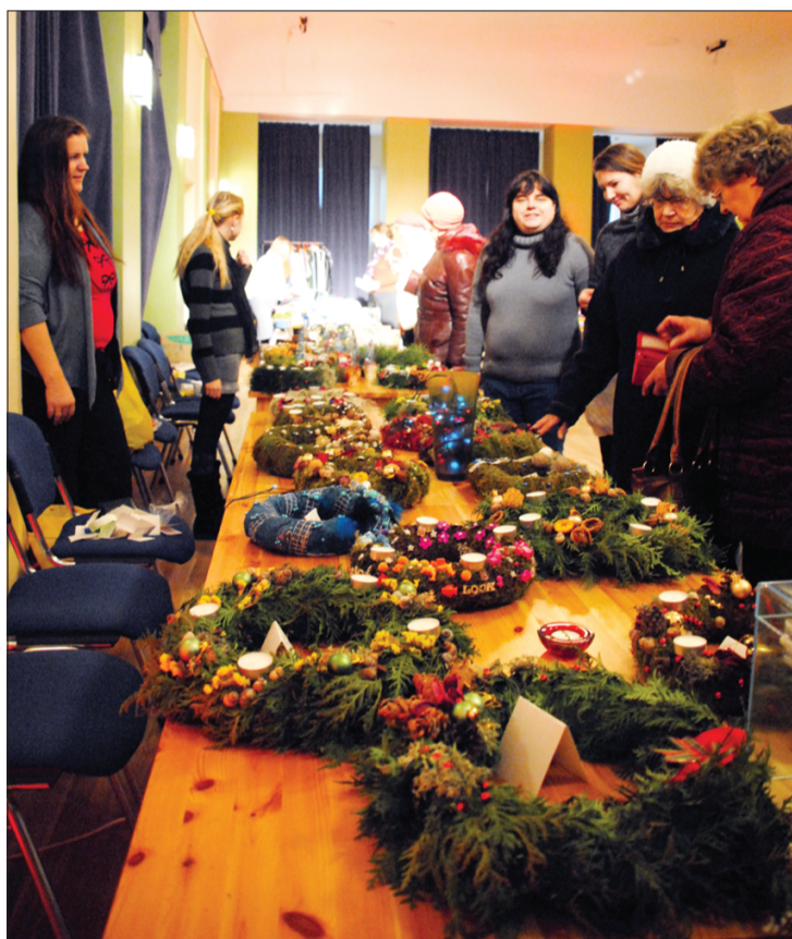
Pirmsadventes laikā tirdziņā īpašu uzmanību guva Adventes vainagi.