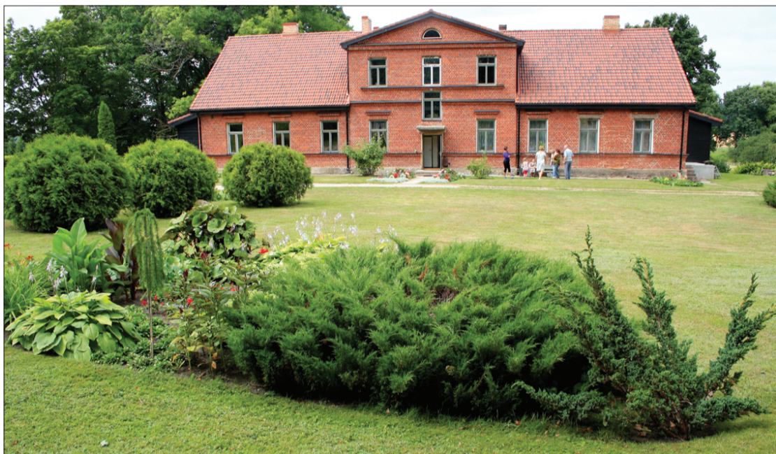
"Ozolbunču" īpašuma vizuālajā noformējumā veiksmīgi izdevies apvienot moderno ar klasisko.