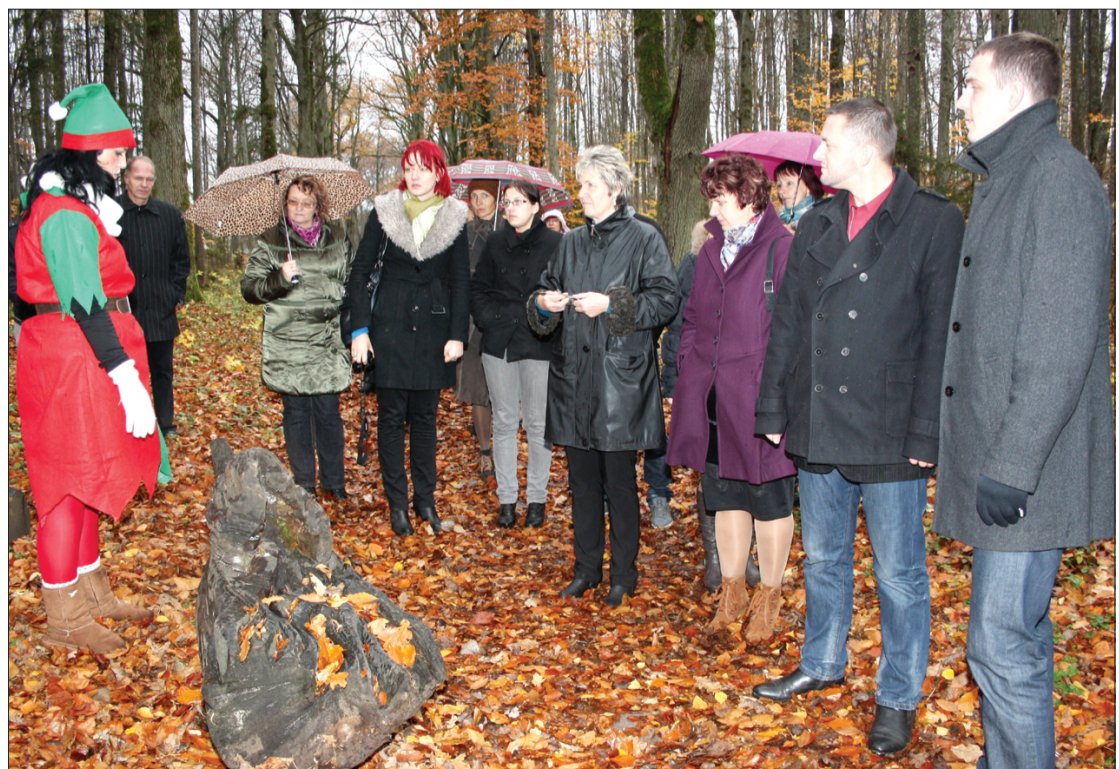
Kalētu "Priediena" rūķis aicināja Mērsraga ciemiņus iziet dzīvnieku taku.