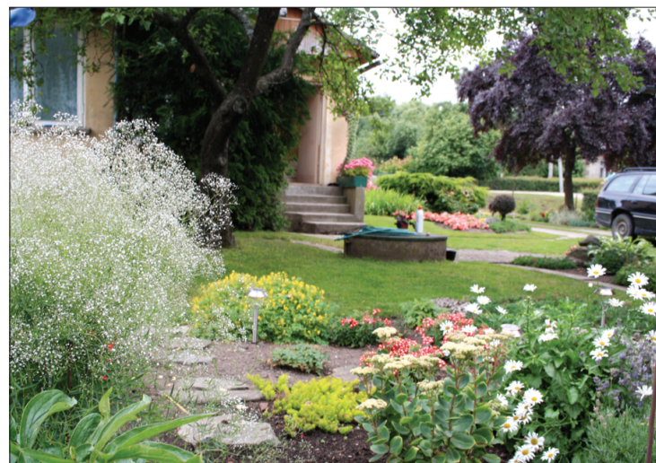
Baznīcas ielas 12 nama saimniekiem nelielajā īpašumā veiksmīgi izdevies apvienot acij tikamo ar ikdienā nepieciešamo.

ciema bibliotēkā. Par aktīvu piedalīšanos novada sabiedriskajā dzīvē, tās organizēšanā un Tadaikū ciema vēstures izziņāšanā.