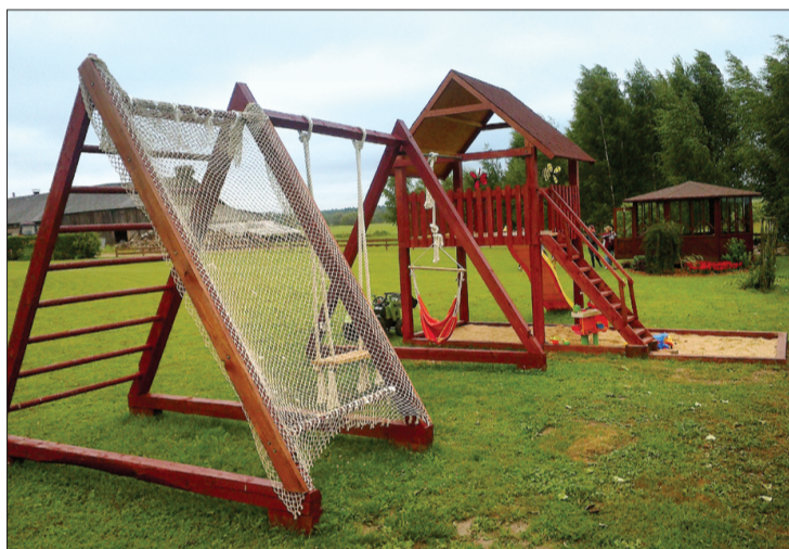
Zemnieku saimniecībā "Albrekši" ir padomāts par atpūtas iespējām gan lielajiem, gan mazajiem.