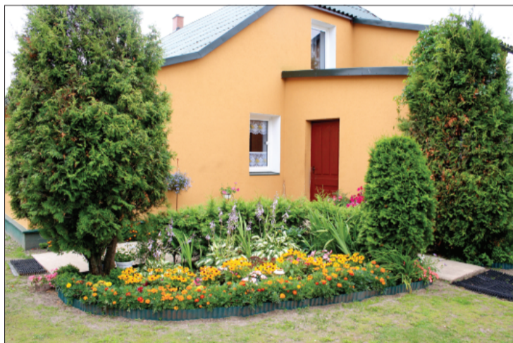
Zemnieku saimniecībā "Indrāni - 2" neaizraujas ar dārdzniecību, bet viss ir pārdomāts, un visam ir sava vieta.