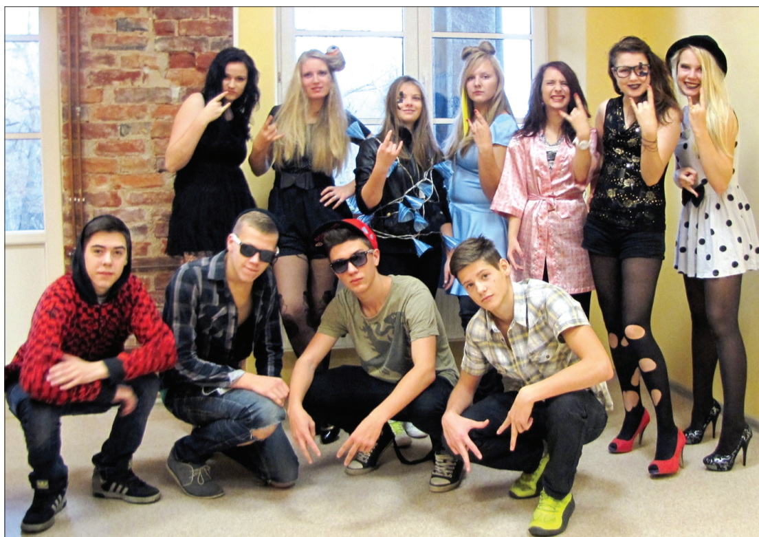
Fukšu nedēļā zēniem nācās iejusties popdziedātāja Džastina Bībera lomā, bet meitenes kļuva par popdziedātāju Lēdiju Gagu kopijām.

Arī otrās dienas uzdevums tika godam izpildīts – zēni iejutās popdziedātāja Džastina Bībera lomā, nešķiroties no cepures un saulesbrillēm pat stundu laikā. Turpretim meitenes