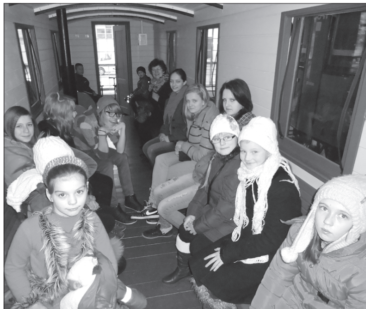
Ekskursijas laikā tika apskatīti dažādi Latvijas dzelzceļa vēstures muzeja eksponāti.