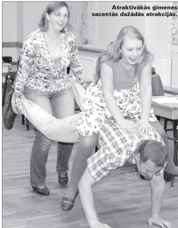
Atraktīvākās ģimenes sacentās dažādās atrakcijās.