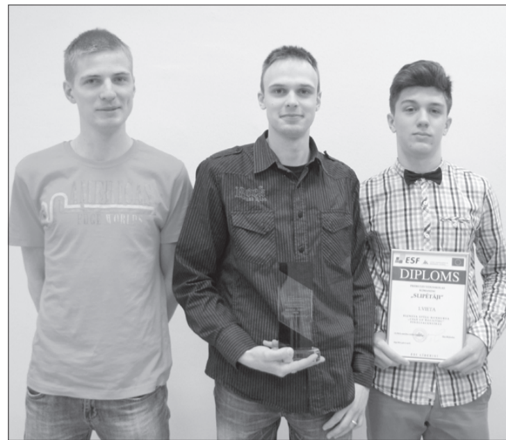
Komanda "Slīpētāji" guvuši jaunu pieredzi, lai varētu veiksmīgi startēt arī turpmāk.

Uzsākot spēli "Bankrots", viens no jauniešu uzdevumiem bija gūt peļņu, bet iepriekš bija jāizvēlas spēles stratēģija, kas palīdzētu vēlmi īstenot. Spēles laikā jauniešiem jābūt par sevi pārliecinātiem, jāspēj izdarīt izvēli, jābūt izveicīgiem, attapīgiem, orientētiem uz mērķi, viņiem jāspēj ietekmēt citus, vēl jābūt neatlaidīgiem un arī godkāriģiem. Spēlē jātiek galā arī ar