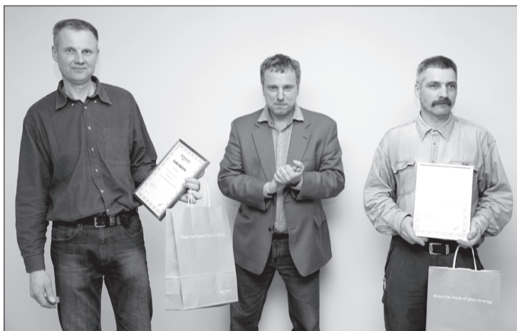
Uzvarētāji pastāstīja, ka abi jau 15 gadu strādā kā vienota komanda.

Rakstā izmantota informācija no SIA "Schneider Electric Latvija".