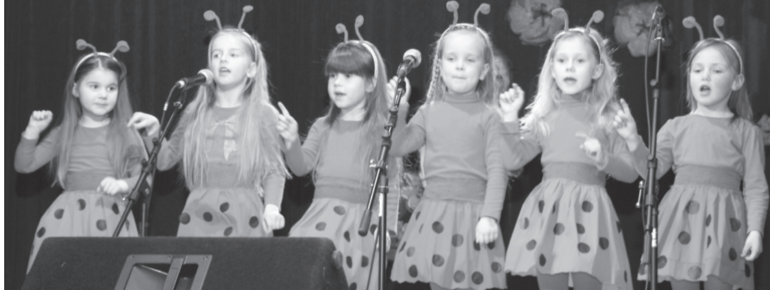
Atzinību par košāko noformējumu saņēma mazās dziedātājas par priekšnesumu "Mazā mārīte".

Priekules kultūras nama darbinieki, vērsoties pie tiem, kuriem ir talants, iedvesma un vēlme tos parādīt, 5. aprīlī veidoja talantu konkursu "Sev un saviem draugiem".