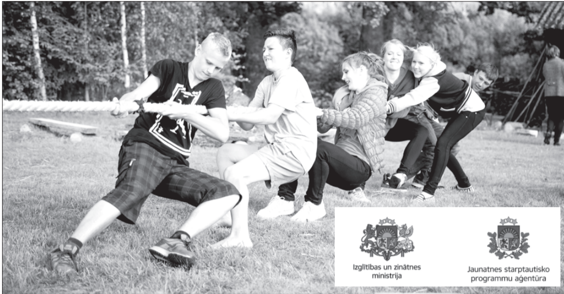
Jaunieši mērojas spēkiem virves vilkšanā.

Priekules novada pašvaldība 30. martā ar Jaunatnes starptautisko programmu aģentūru "Jaunatnes politikas valsts programmas 2015. gadam" 1. daļas "Valsts atbalsta nodrošināšana jaunatnes politikas īstenošanai pašvaldībās" 1.3. apakšsadaļas "Atbalsts jauniešu centru darbības nodrošināšanai pašvaldībās ar mērķi īstenot neformālās mācīšanās aktivitātes visiem jauniešiem, popularizējot līdzdalību un aktīvu dzīves veidu" ietvaros noslēdza līgumu par projekta "Atbalsta pasākumi Priekules novada jauniešu iesaistīšanai pašu valdībā" (Nr. 4-33/3) īstenošanu.