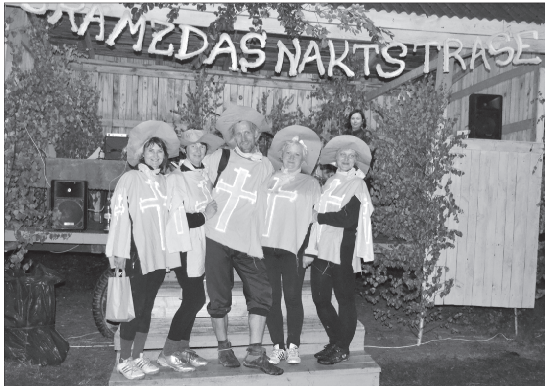
Par sestās Gramzdas nakts trases uzvarētājiem kļuva komanda "Muskatieri".

Vasarā, kad liela daļa cilvēku lūkojas pēc iespējām, kā aktīvi atpūsties, uz Gramzdu tiek aicināts ikviens, kas vēlas piedalīties komandas saliedēšanas pasākumā.