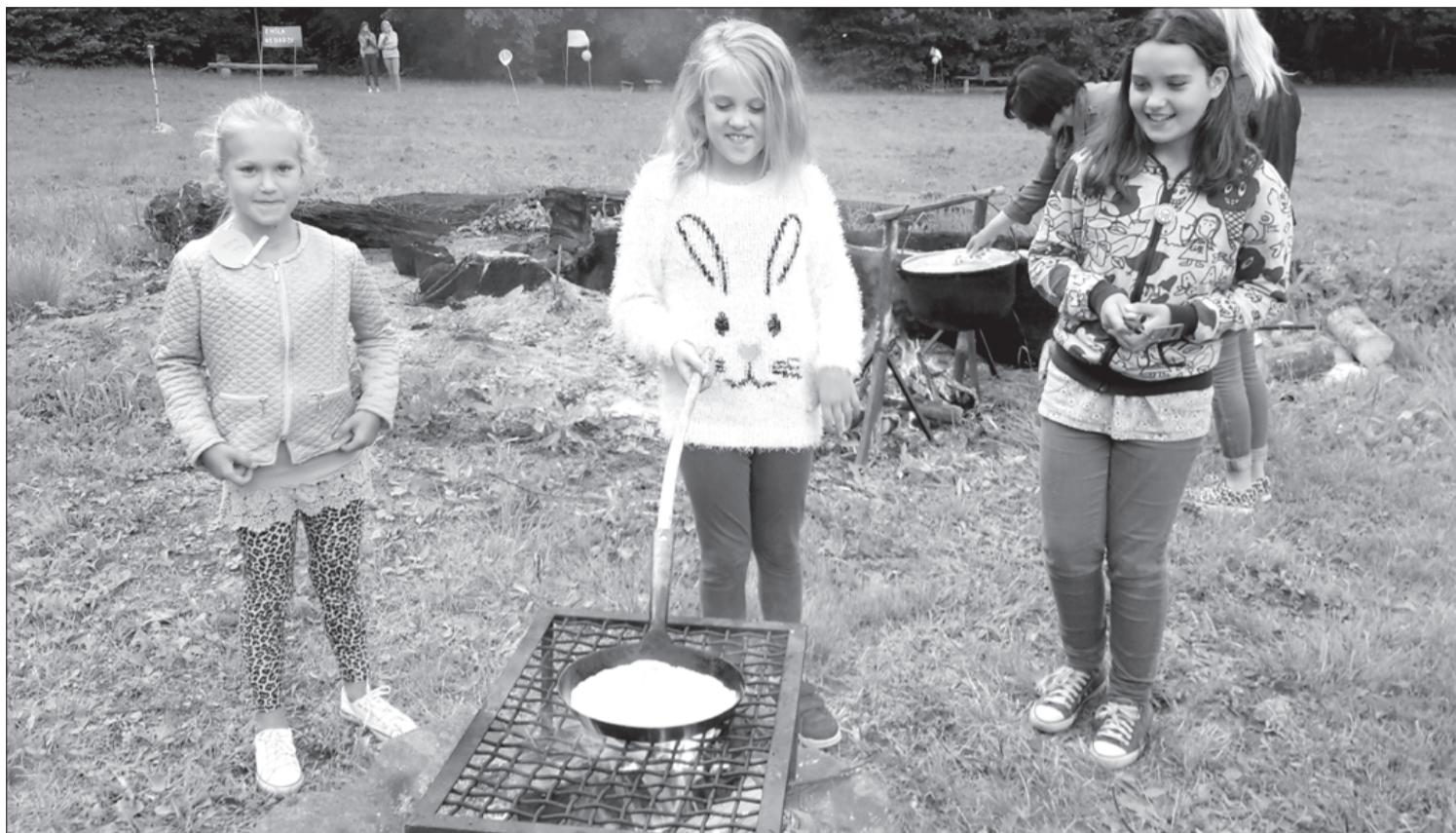
Jaunie pavāri sacentās pankūku cepšanā.

Noslēgumā visas komandas saņēma diplomus un saldās balvas. Pēc aktīvās atpūtas pasākuma "Kopā jautrāk" pirmās daļas gaisā tika