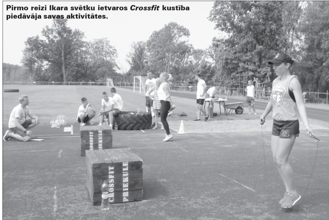
Pirmo reizi Ikara svētku ietvaros Crossfit kustība piedāvāja savas aktivitātes.