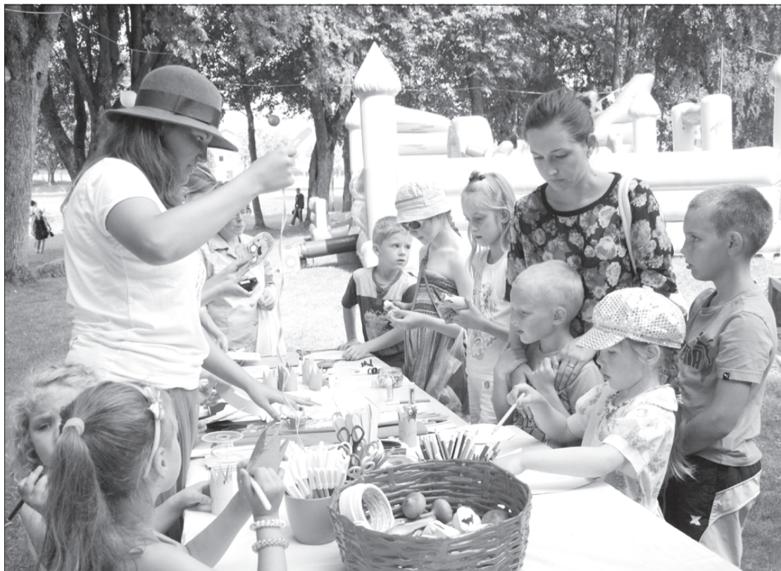
Pie Kultūras nama bērniem bija iespēja piedalīties gan radošās, gan sportiskās aktivitātēs.

Vērienīgi, priecīgi un ar pozitīvu noskaņu aizvadīti XII Ikara svētki, kuros satikās priekulnieki, novada iedzīvotāji, tuvi un tāli viesi. Noliktais ikdienas rūpes, bet smaids veltīts pretimnācējam – tādi bija šā gada svētki, un prieks mājaja it visā, sākot jau ar gājieni, kura moto bija "Dzīvo ar prieku!".