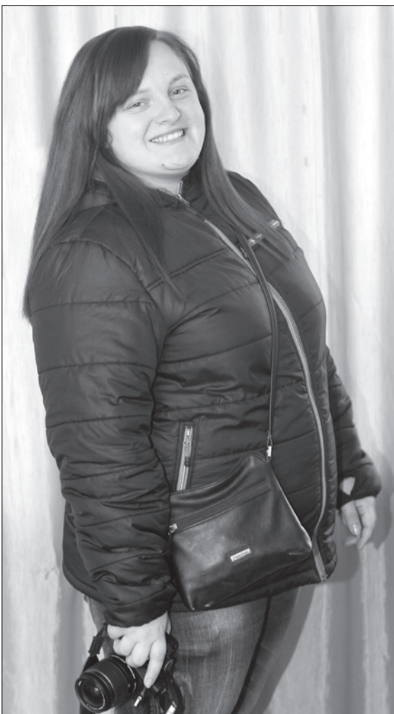
– Tuvojas skolas sākums, ko tu novēli visiem tagadējiem skolēniem jaunajā mācību gadā? – Mācies, kamēr gudrs tiec, visu labi vērā liec!