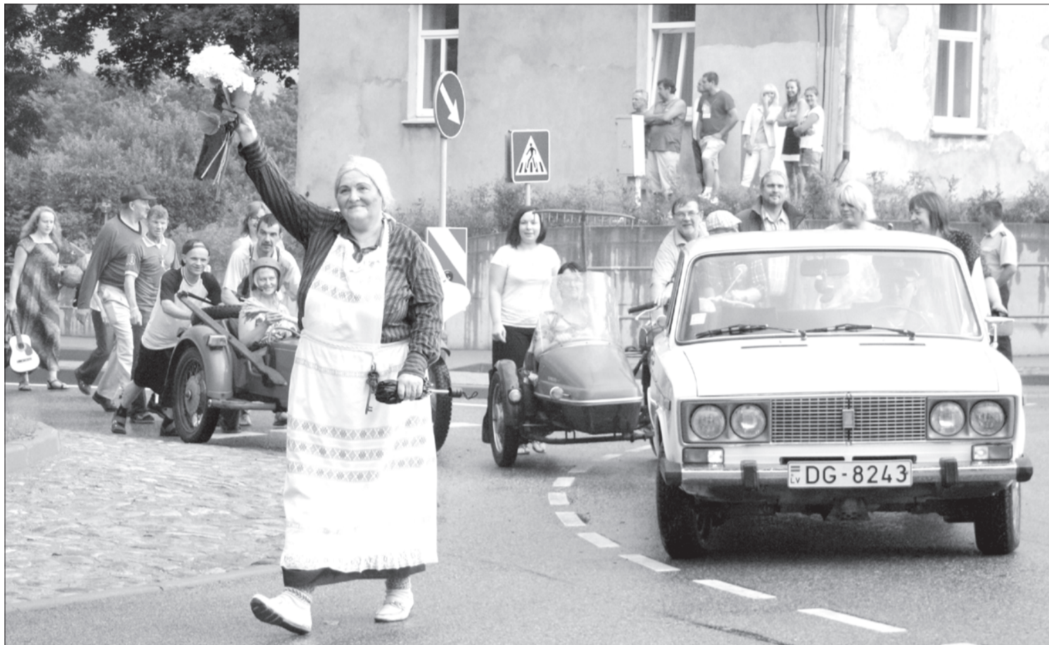
Svētku gājienā sevišķi atraktīvi bija personāži no filmas "Limuzīns Jāņu nakts krāsā" Gramzdas pagasta aktieru izpildījumā.