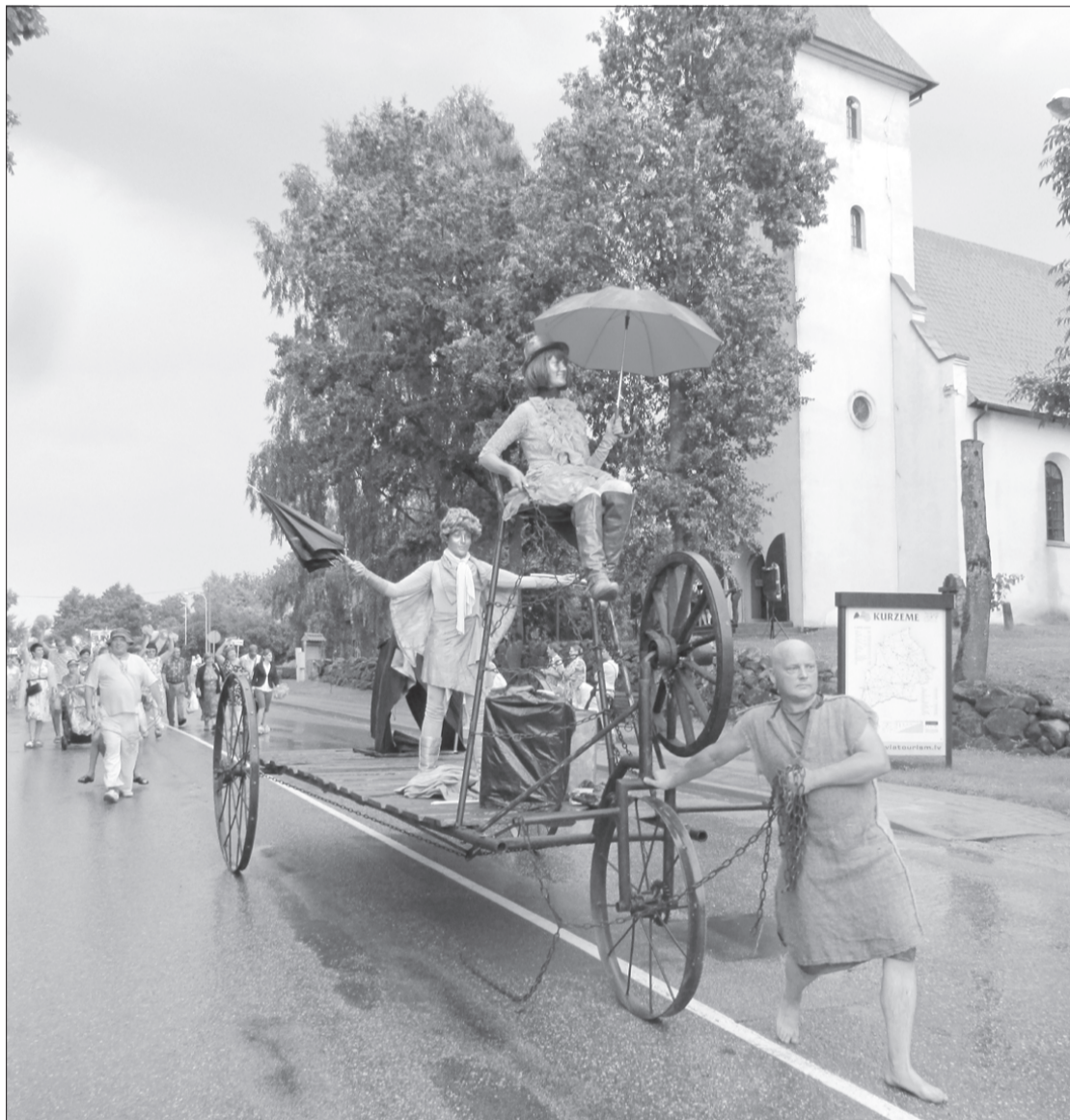
Svētku gājiena priekšgalā – Liepājas cirks "Beztemata".