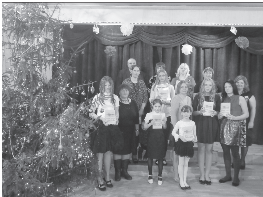
Svētku noskaņās skolēni saņēma savas īpašās liecības.

Skolas kolektīvs vienmēr priecējās par savu skolēnu sasniegumiem un bēdājas par neveiksmēm vai vienkārši slinkumu. Šoreiz par priecīgo. Krotē Kron-