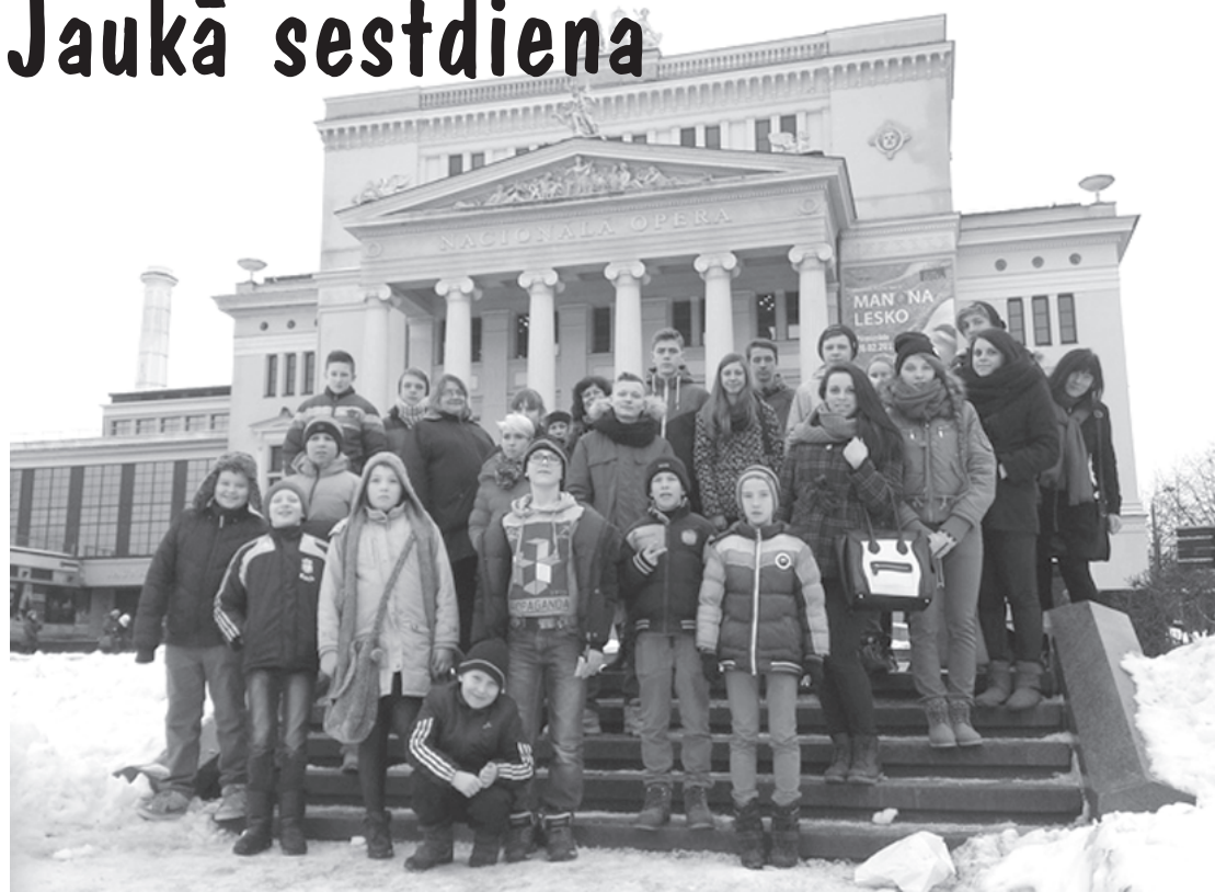
Skolēni gandarīti par ekskursijā piedzīvoto.