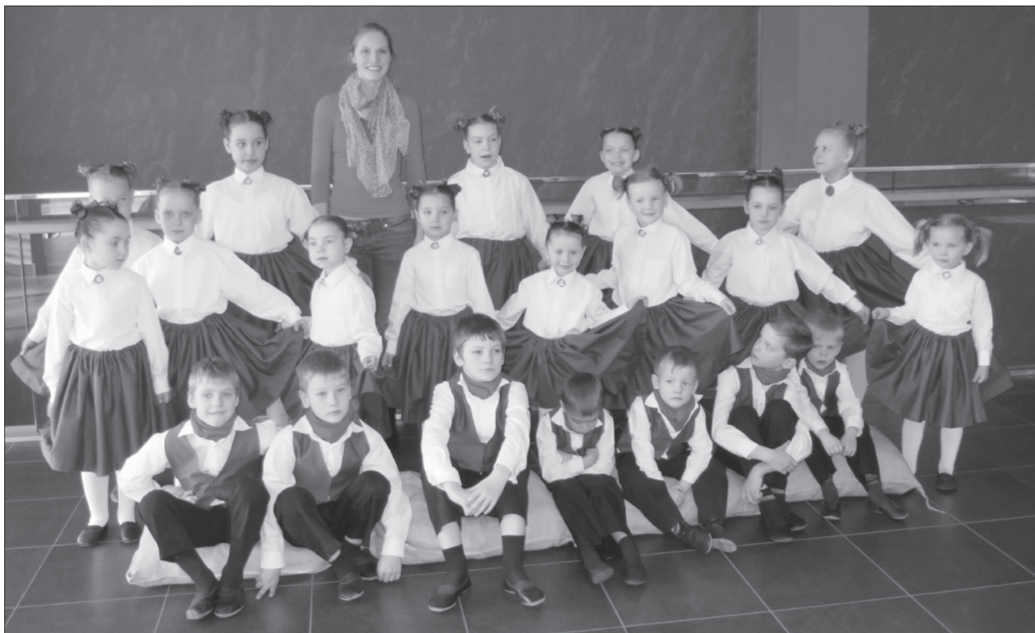
Mazie "sienāzīši" priecējās par jauniegūtajiem skatuves tērpiem.