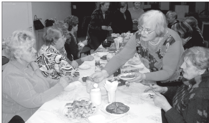
Pasākuma organizatori atzina, ka apmeklētāju skaits bijis pārsteidzoši liels.

Valsts svētku nedēļas noskaņojumā senioru biedrības "Zilais lakatiņš" dalībnieki 13. novembrī Priekules Kultūras namā organizēja "Pankūku pēcpusdienu".