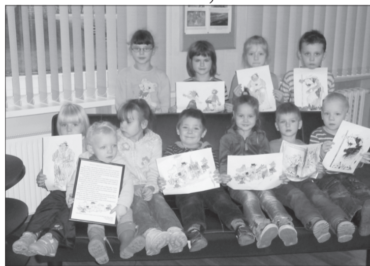
Mazie lasītāji kopīgi iepazīna troļļu pasauli.