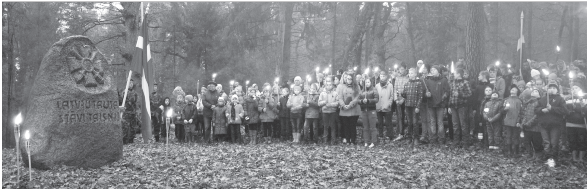
Lāčplēša dienas atceres pasākums Aizviķos.

Novembris Latvijā ir nozīmīgu valsts svētku un atceres dienu mēnesis. Šogad, kā ik gadu, novadā tas izskanējis svētku noskaņās, lāpugonis, dziesmās, dejās, ar laba velējumiem Latvijai un tās iedzīvotājiem. Tikai kopā mēs varam paveikt daudz, un prieks par mūsu novada jauniešiem, kuri aktīvi piedalījās Lāčplēša Kara ordeņa kavalieru kapa vietu sakopšanā. Gaidot Lāčplēša dienu, Aizsardzības ministrija aicināja ikvienu Latvijas iedzīvotāju nēsāt pie apģērba sarkanbaltsarkano lentīti, kas norāda uz 1919. gada 11. novembri, kad tika izēnīta izšķirošā uzvara pār Bermonta karaspēku. Aicinājumam atsaucās arī aktīvistu komanda no Priekules vidusskolas, kuri 10. novembrī organizēja patriotisko lentīšu locīšanu skolā.