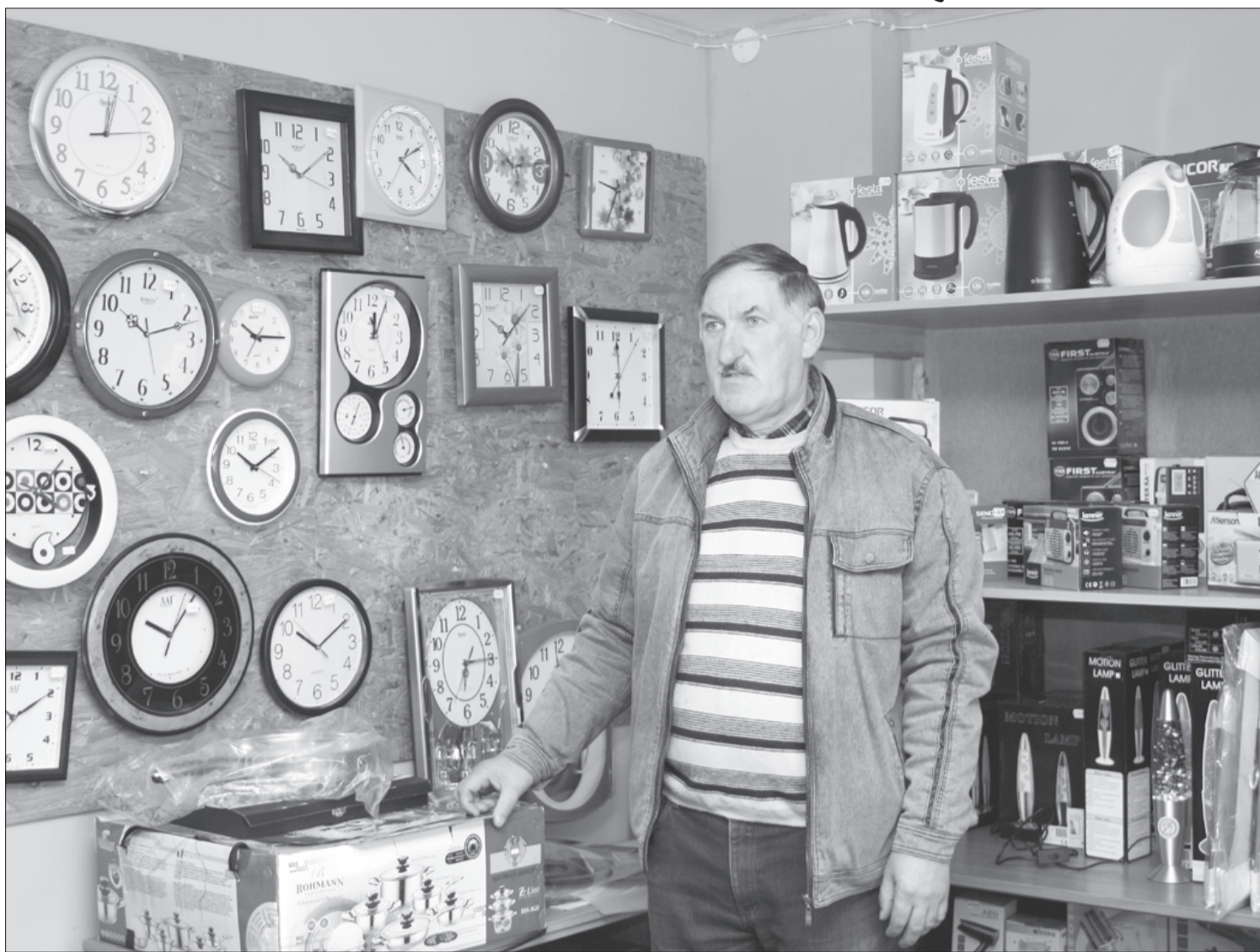
Veikalā atrodams plašs preču klāsts lauksaimniecībai, mājai un ģimenei.