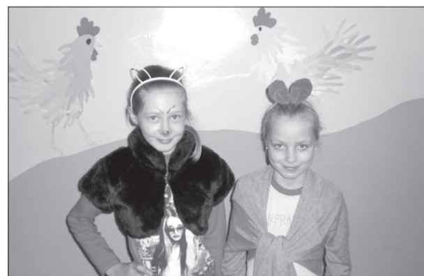
Mārtiņdienā bērni tērpās dažādās maskās.