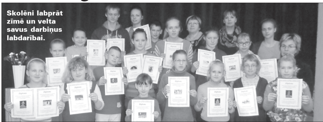
Skolēni labprāt zīmē un velta savus darbiņus labdarībai.

Kronvalda Ata Krotas pamatskolas skolēni 2014.gada sākumā piedalījās biedrības "Eurika" rīkotajā zīmējumu konkursā "Ziedo savu zīmējumu!". No šiem zīmējumiem tiek veidotas bērnu zīmētas apsvēkumu kartītes, kuras var iegādāties gan uzņēmumi, gan ikviens no mums mājaslapā www.eurika.lv .