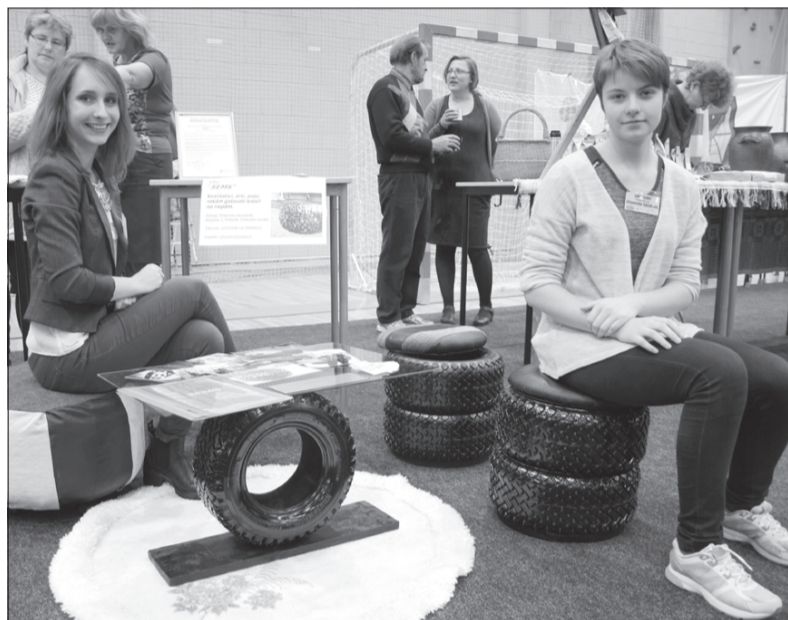
Tirdziņa apmeklētājiem skolēnu mācību uzņēmuma "Sems" meitenes piedāvāja kvalitatīvus, pašu rokām gatavotus krēslus no riepiņiem.

Tāpat apmeklētājiem bija iespēja nogaršot un vērtēt kūku konkursa dalībnieču veikumu.