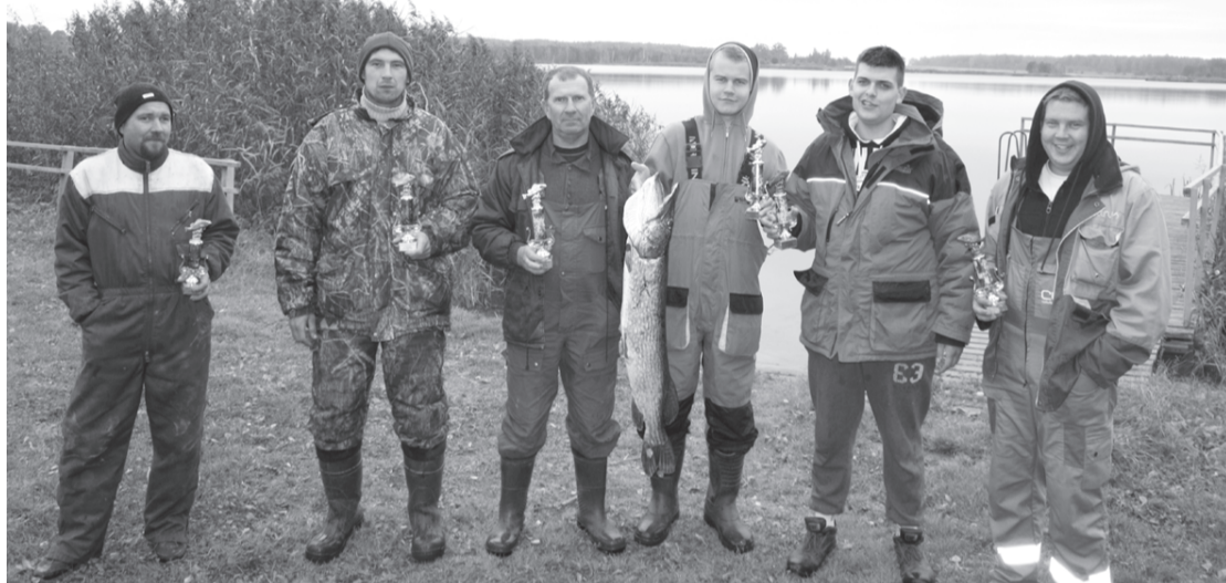
Priekules novada 2015. gada atklātā čempionāta spiningošanā kopvērtējuma līderi.

10. oktobrī Prūšu ūdenskrātuvē norisinājās Priekules novada 2015. gada atklātā čempionāta spiningošanā trešais posms, kurā piedalījās deviņas ekipāžas, katrā pa diviem dalībniekiem.