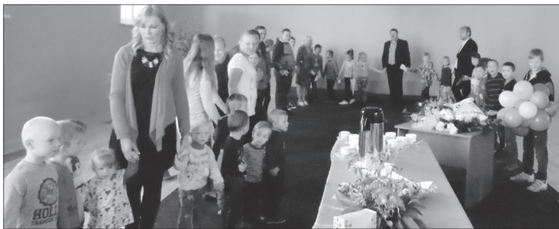
Zāles atklāšanā skolēni un viesi kopīgi veica pirmos vingrinājumus.