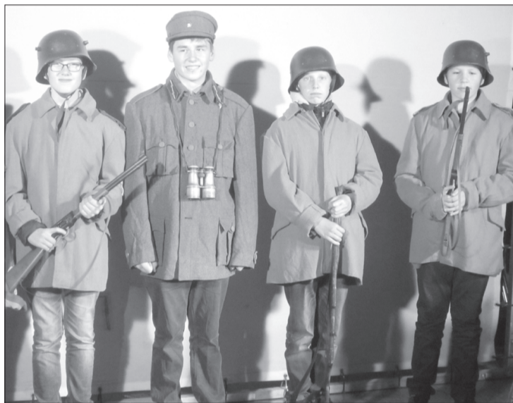
Kalētu jaunieši iejūtās kara laiku filmu personāžu tēlos.

Jaunieši bija guvuši pozitīvas emocijas no atjautīgiem, interesantiem gidiem un saņēma vairāk informā-