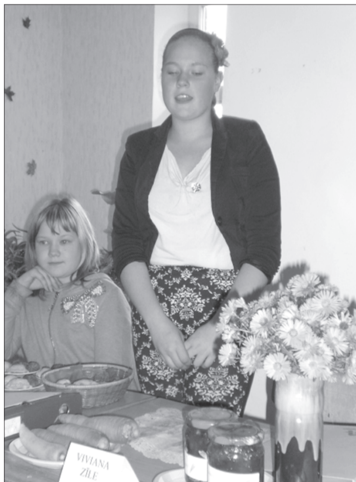
Mazpulku vērtētājiem bija iespēja nogaršot dažādus bērnu veidotus gardumus.

6. oktobrī Virgas mazpulcēni pulcējās skaisti izpušķotajā mazpulku telpā. Šogad trīs mazpulcēni audzēja dažādu šķirņu zirņus. Priekuļu selekcijas stacijas uzdevumā daži mēģināja izaudzēt neparastus dārzeņus: saldo kukurūzu, arbūzus uz lauka, netrūka arī burkānu, sīpolu, garšaugu audzētāju. Skatei gatavojamies ilgi, jābūt sakārtotai mazpulku dienasgrāmatai un jāprot prezentēt savu darbu. Mazpulcēni visus pārsteidza ar dažādiem neparastiem ēdieniem: zirņu kotletēm un