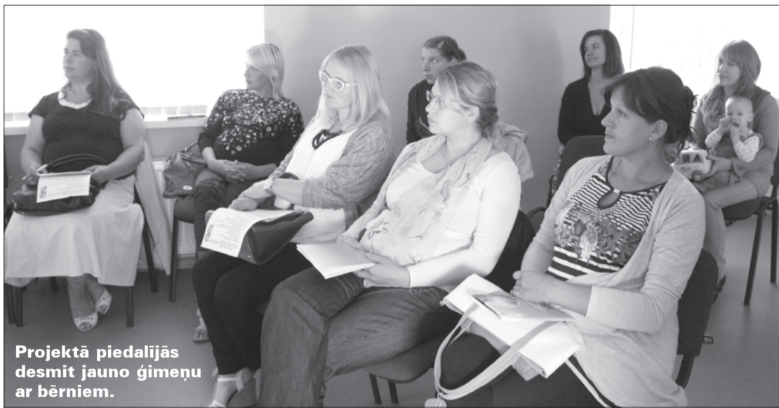
Projektā piedalījās desmit jauno ģimeņu ar bērniem.