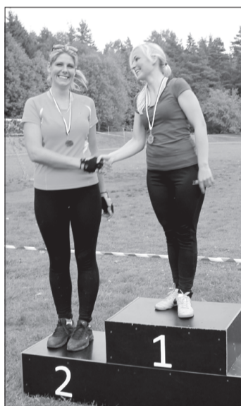
Sacensību "Gramzdas zobrats" pirmajā reizē piedalījās tikai divas sievietes.