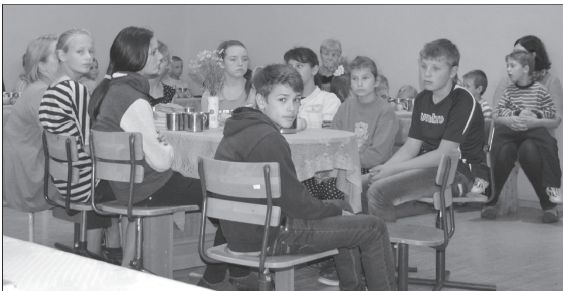
Skolēni šajā Dzejas dienu pēcpusdienā iejutās klausītāju lomās.