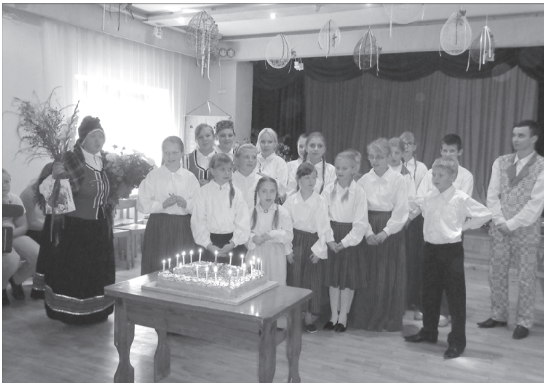
"Traistēnu" bērni ar viesiem svinēja jubileju pie svētku galda.

29. septembrī Krotē skolā Miķeļtirgus bija pārdomu pilns – visa kā bija daudz, raža un darbi bijuši labi, bet apmeklētāju mazāk nekā citus gadus, danči un dziesmas ritēja raiti un skaļi.