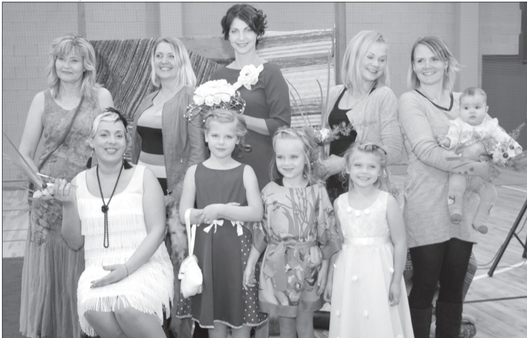
Pārvērtību šova meistas ar modelēm.

17. oktobrī jau ceturto gadu Priekules Daudzfunkcionālajā sporta hallē notika pasākums "Priekules novada zemnieku - uzņēmēju diena". Muzikāli lustīgu sveicienu radīja Priekules VPK "Duvzare" sadarbībā ar Skodas lauku kapelu "Bartuva".