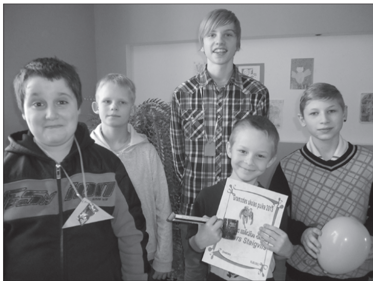
Gramzdas pamatskolas atraktīvākā, prasmīgākā un sportiskākā zēnu komanda.