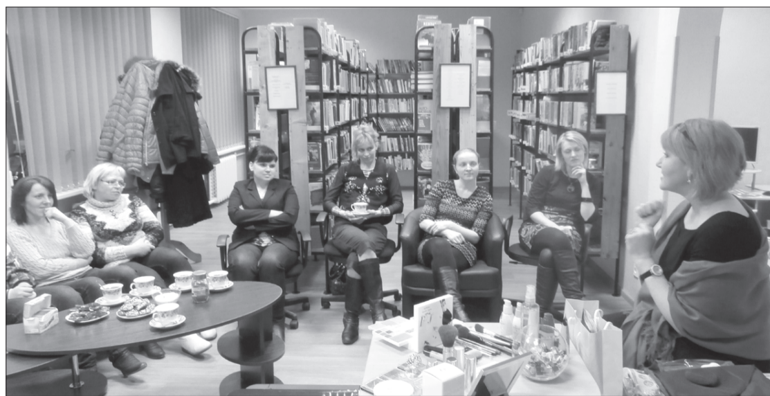
Sievietes ar interesi ieklausījās vizāžistes stāstītajā.