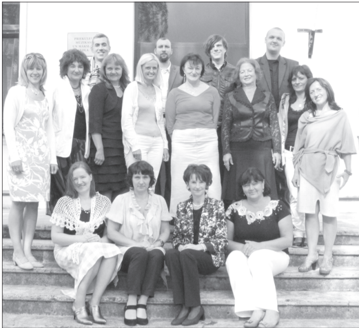
Priekules Mūzikas un mākslas skolas pedagogi.

Kad ziemas aukstie vēji sāk nomierināties, putnu balsis skan jau spirtāk un sirds sajūt pavasara tuvošanos, ikviens ar satraukumu skolā sagaida savus vecākus un tuviniekus, lai parādītu pirkstu veiklību, roku stingrību, balsis lokanību. Skolā sākas īsts koncertu maratona laiks. Cimos tiek braukts uz Gramzdu, Virgu, Kroti, lai katram jaunam zinību alkošam