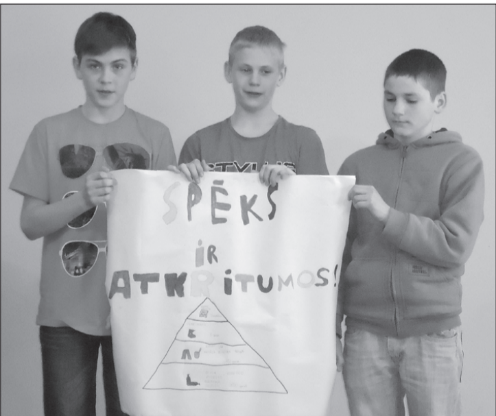
EKO darba dienas beigās tika rādītas prezentācijas par paveikto.

16.aprīlī pulksten 9.30 "Skrīveru saldumi" pārdos savu produkciju pie Bunkas Kultūras nama.