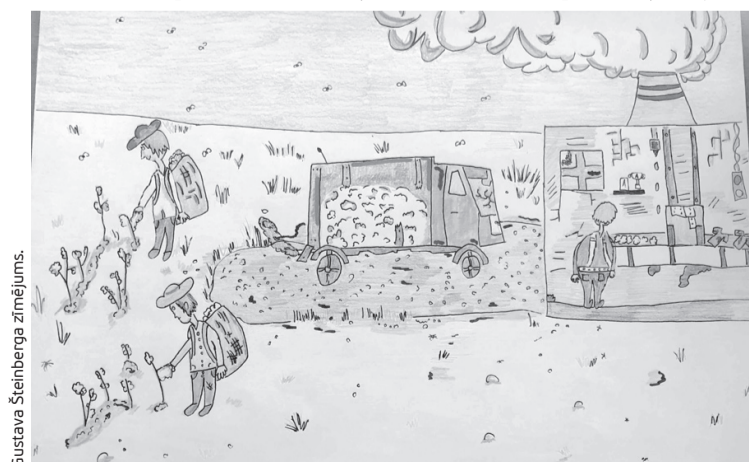
Gustava Šteinberga zīmējums.