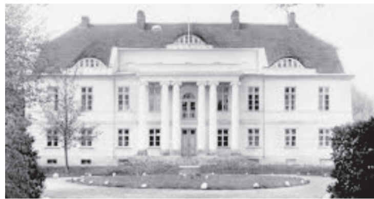
Kungu māja, kuras atklāšana notika 1808. gada 24. jūnijā.