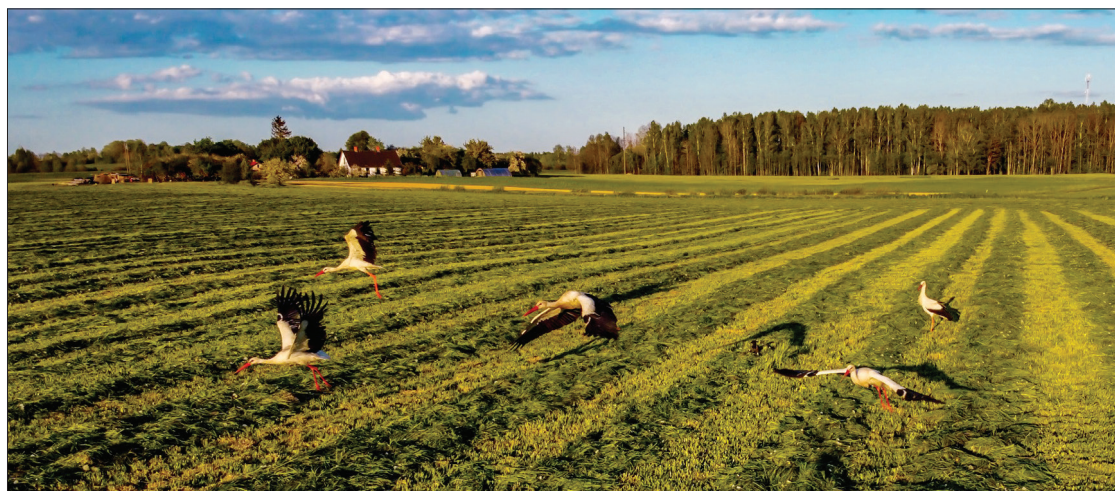
“Stārķi”. Autors: Mariks Vilkaveckis.