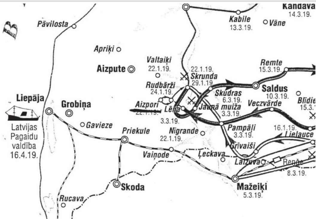
1919. gada 22. janvārī pie Aizpuriem beidzas 1. Latviešu atsevišķā bataljona atkāpšanās.

Šeit ir tā atspēriena vieta, No kuras kalpakiēši reiz Prom svešos iebraucējus trieca Pār Ventu cauri Kurzemei. (Olafs Gūtmanis)