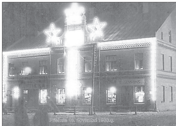
Valdes ēka Priekulē vai Tupuriņa namas svētku rotā vakarā pirms 1933. gada 18. novembra valsts neatkarības svētkiem.

1919. gada 11. novembris. Ticība Latvijai ļauj turpināt runāt par mūsu Latviju