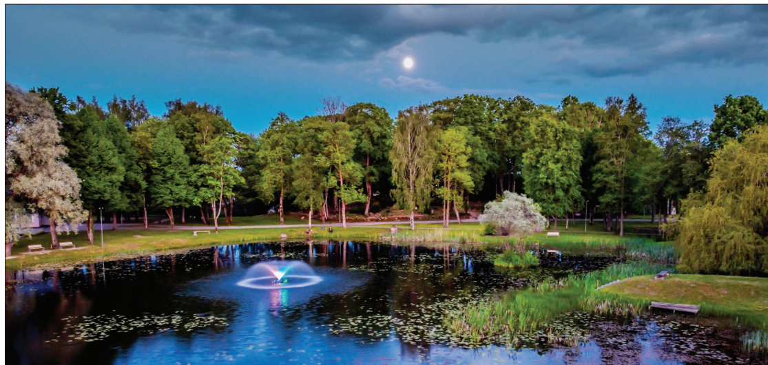
“Kultūras nama diķis mēnesnīcā”. Autors: Mariks Vilkaveckis.