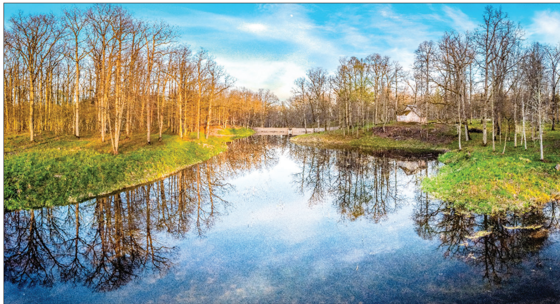
“Parka jaunais vecais atspulgs”. Autors: Elvijs Sisenis.