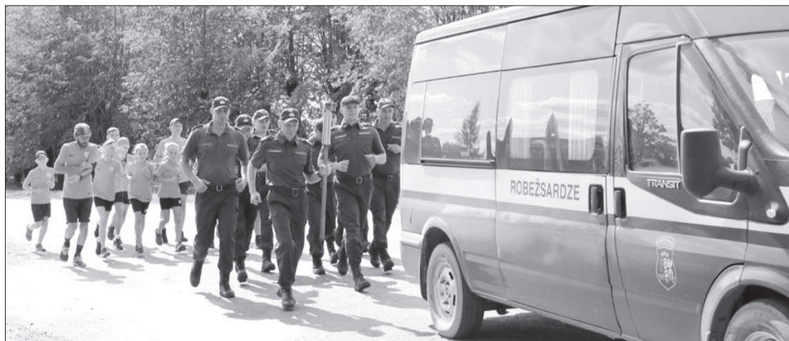
Robežsardzes skrējējus posmā no Gramzdas pagasta līdz Priekulei pavadīja Priekules novada sportisti.