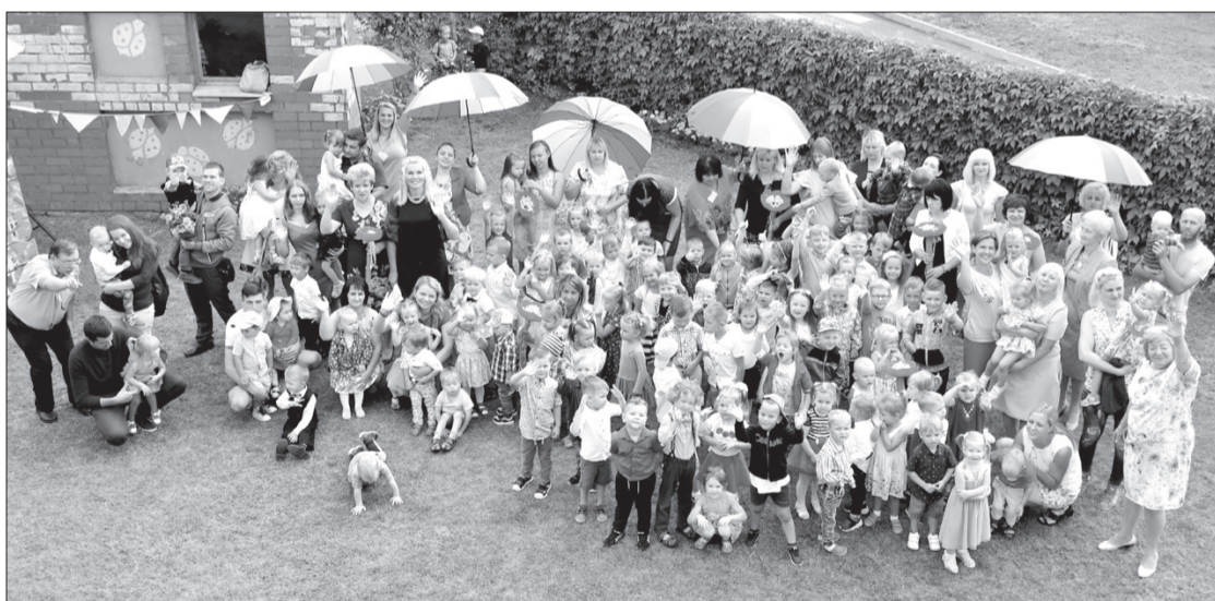
Priekules pirmsskolas izglītības iestādē "Dzirnaviņas" pirmsskolas izglītības programmas apgūst 116 bērni.

Kalētu Mūzikas un mākslas pamatskolas pirmsskolas Zinību dienas svinību laikā svinīgā ceremonijā tika atklāta nojume, kur turpmāk pirmsskolas bērni varēs gan rotaļāties, gan paglābties no lietus.