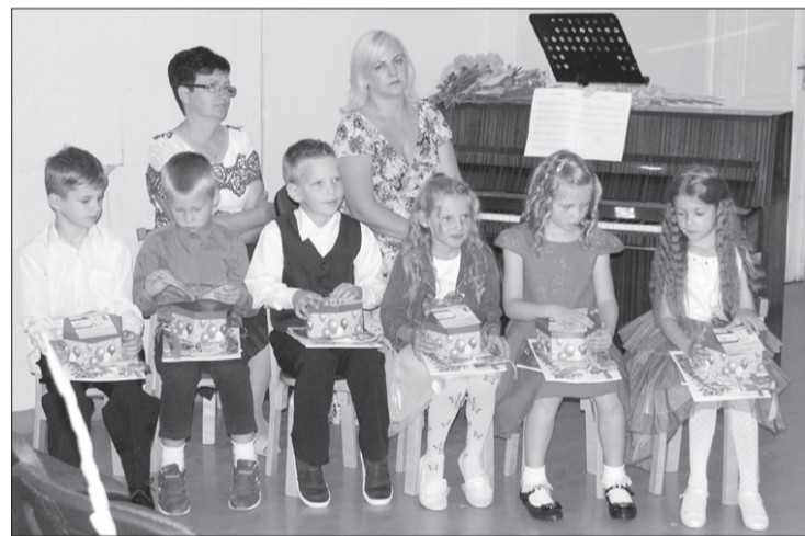
Virgas pamatskolas mācības uzsāka seši 1. klases audzēkņi. Kopā pamatskolā ir 76 bērni, kuru skaitā ir 35 pirmsskolēni.