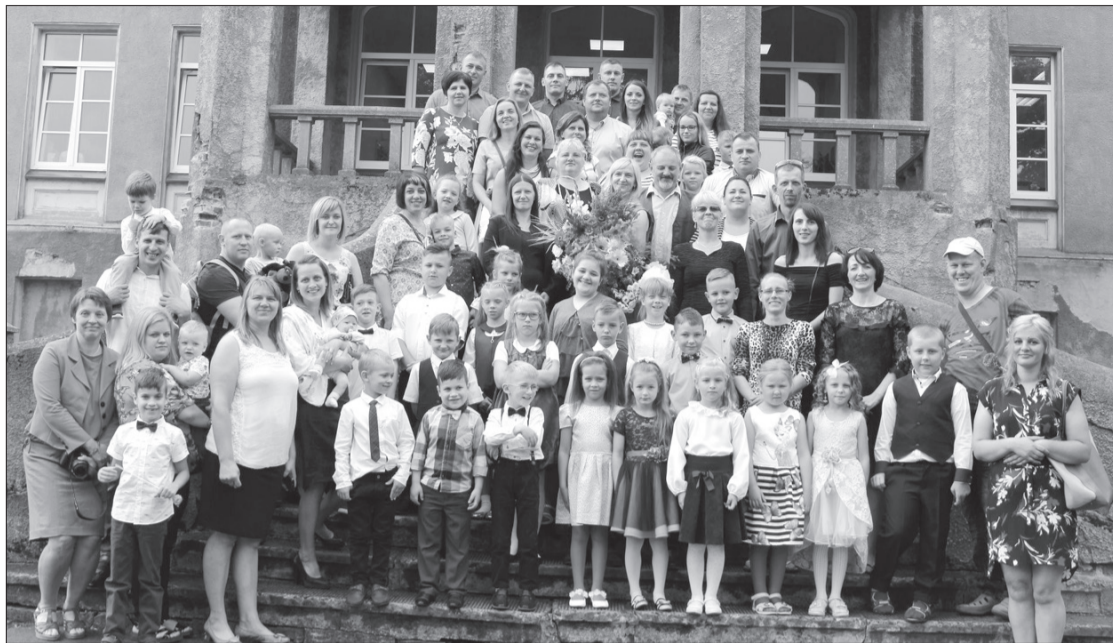
Priekules vidusskolā skolas gaitas uzsāka 24 pirmklasnieki. Kopējais skolēnu skaits vidusskolā ir 272.