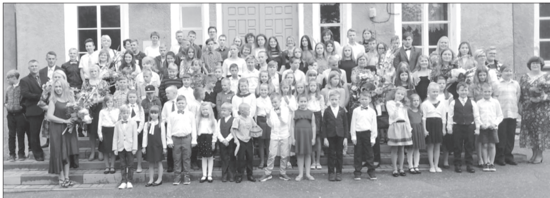
Kalētu Mūzikas un mākslas pamatskolā mācības uzsāka desmit 1. klases skolēni. Kopā mācību gaitas uzsāka 150 bērni, no kuriem 59 ir pirmsskolas audzēkņi. Skolas mūzikas un mākslas ievirzes programmās mācības uzsāka 59 skolēni.