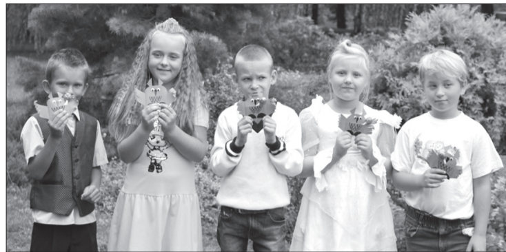
Seši bērni uzsāka pirmklasnieka gaitas Mežupes pamatskolā. Kopā skolā mācības uzsāka 74 bērni, no kuriem 6 ir pirmsskolēni, 53 apgūst pamatizglītību un 15 – profesionālo pamatizglītības programmu.