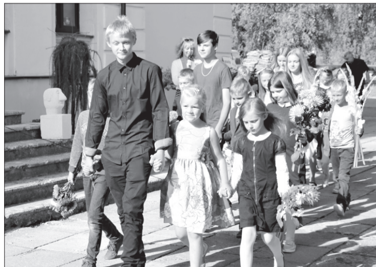
Priekules Mūzikas un mākslas skolā mācības uzsāka 129 audzēkņi.