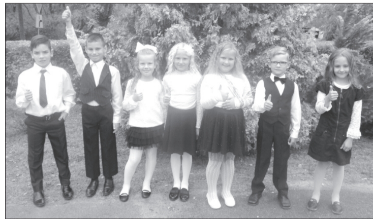
Krofes Kronvalda Ata pamatskolā mācību procesu uzsāka septiņi pirmklasnieki. Kopumā skolā mācās 107 bērni, no kuriem 30 ir pirmsskolēni.