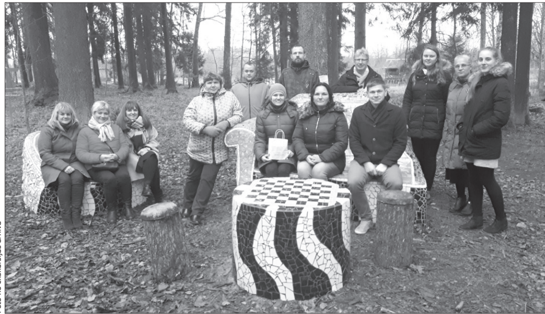
"Dabas viesistaba" Gulbenes novada Stāķu ciemā.