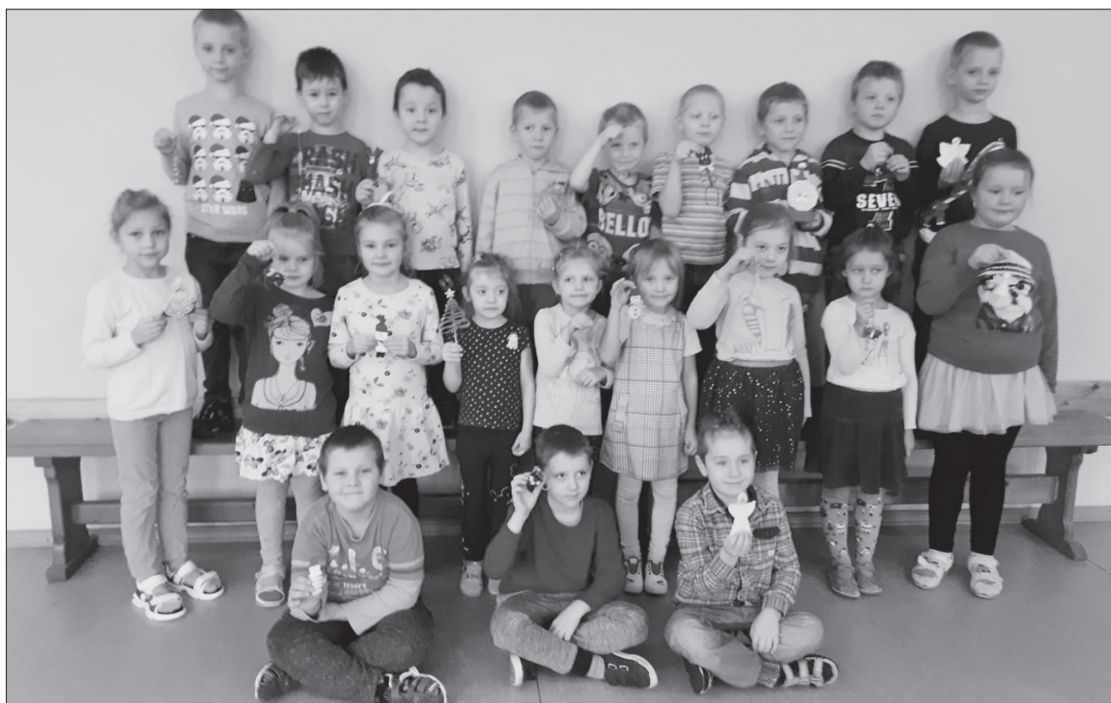
Kalētu pirmsskolas bērni ar pašu radītiem rotājumiem.