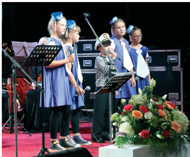
Dziesmu "KAPTEINIS REINIS" izpildīja Priekules vokālais ansamblis "PUĶU BĒRNI".