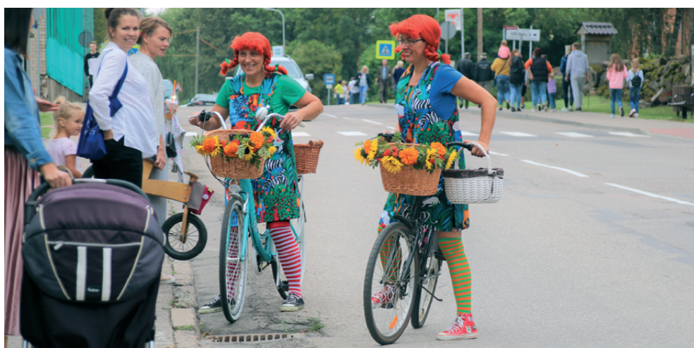
Atraktīvās Pepijas aicināja mazākos dalībniekus uz bērnu ciematu, kur izklaides bija pieejamas visām gaumēm – radošās priekā darbnīcas, leļļu teātris, piepūšamās atrakcijas, ūdensbumbas dīķi un putu ballīte!