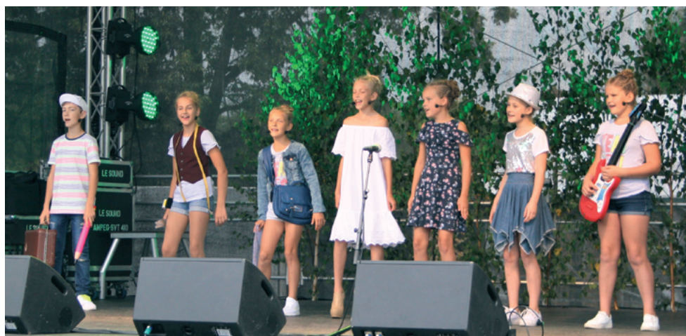
Priekules kultūras nama popgrupa priecēja klausītājus divreiz. Pirmo reizi uzstājoties torniša skatuvē pa dienu un vakarā dziedot Maestro mūzikas pavadījumā.

Aicinām Priekules novada iedzīvotājus izteikt savas domas par 16. Ikara svētku pasākumiem un norisi. Novērtēsim priekšlikumus un ierosinājumus nākamajiem 17. IKARA svētkiem. Jūsu viedoklis mums ir ļoti svarīgs! Informāciju sūtiet e-pastā priekulesavize@inbox.lv vai Priekules novada pašvaldības "Facebook" lapā. Priekules novada pašvaldības administrācija