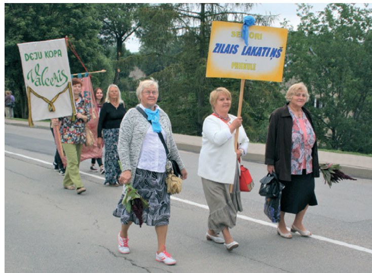
Svētku gājienā piedalījās milzīgs skaits novada iedzīvotāju. Arī mūsu seniņi.