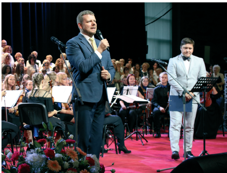
Nacionālā teātra aktieris Mārtiņš Egliens aicina komponistu Ēriku Ešenvaldu uz savas dzimtās pilsētas svētku lielkoncerta skatuves.