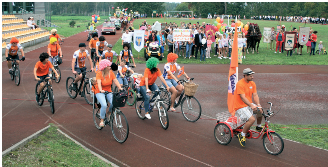
Gājiena noslēgums norisinājās pie Priekules daudzfunkcionālās sporta halles.