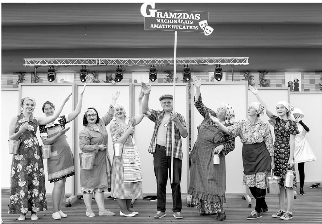
“Stopkadrs” Alūksnes Pilssalas estrādē.

Reizi piecos gados Latvijas amatiereteātru kolektīvi salido vienuviet, lai baudītu atkalredzēšanās prieku, lai lūkotu piecgades labākās lugas un lai smeltos iedvesmas enerģiju no kopā būšanas. Šogad XIV Latvijas amatiereteātru salidojums notika Alūksnē no 19. līdz 21. jūlijam ar salidojuma moto “Spoguļo!”, atsaucoties uz latviešu teātra tēva Ādolfa Alunāna savulaik trāpīgi teikto: “Dažs prasīs: kas tad nu īsi teāteris ir? Es še ar šo līdzību atbildēšu: teāteris ir kā spieģelis, kurā mēs paši savus labus un nelabus darbus, savas prieku, kā bēdu dienas, ar vārdu sakot, savu dzīvošanu redzam.”