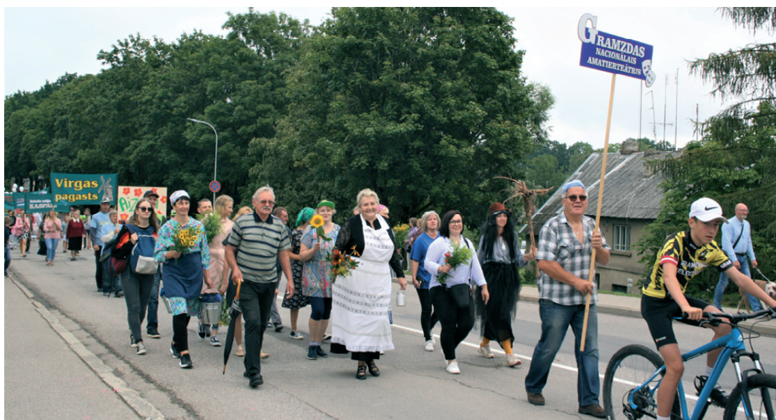
Gramzdas nacionālais amatiereteātris skatītājus priecēja divreiz. Pirmo reizi Ikara svētku gājienā un otreiz vakarā – torniša skatuvē, izspēlējot amatiereteātra izrādi "BRANGAIS ĶĒRIENS".