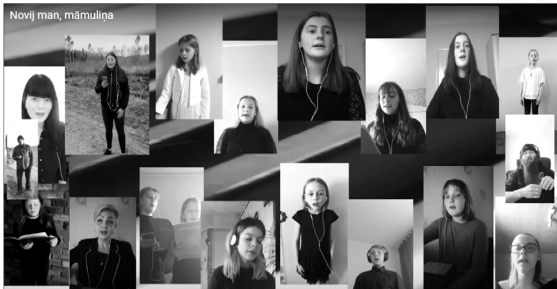
Kalētu Mūzikas un mākslas pamatskolas virtuālais sveiciens māmiņām.