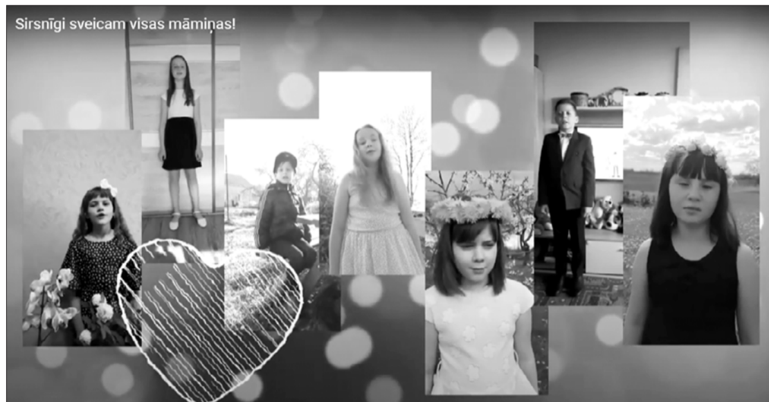
Virtuāls Māmiņdienas sveiciens Priekules Mūzikas un mākslas skolas audzēkņu izpildījumā.