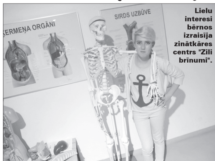
Lielu interesi bērnos izraisīja zinātkāres centrs "Zili brīnumi".

Ekskursijas sākumā baisajā "Stūra mājā" mūs sagaidīja laipna gide, kas pastāstīja par ēkas vēsturi, par karu, masu represijām un genocīdu. Jau, ieejot šajā mājā, varēja saprast, ka nekas