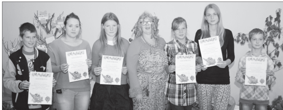
Veiksmīgākos mazpulka projektu veicējus izvirzīja uz reģiona skati Ezerē.

Krotas Kronvalda Atā pamatskolā 23. septembrī notika ikgadējā mazpulcēnu darbu skate jeb atskaites diena par paveikto no pavasara līdz rudenim.