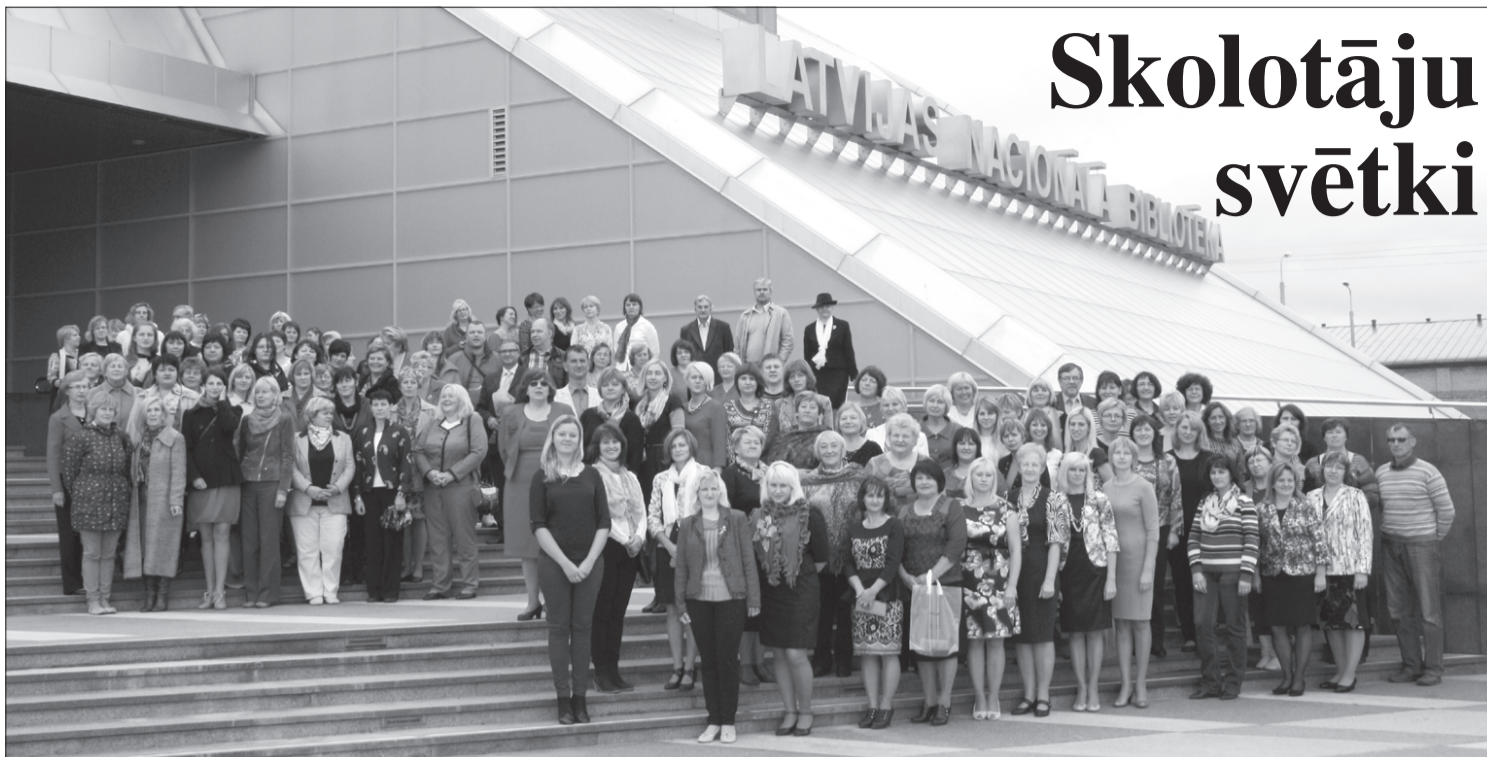
Ierodoties "Gaismas pilī", novada pedagogi pulcējās uz bibliotēkas kāpnēm, kur tapa Skolotāju dienai veltīts kopīgs foto.

29. septembra rītā mēs, Priekules novada izglītības iestāžu pedagogi, devāmies uz Rīgu. Patīkams satraukums, sirsnīgas sarunas, ceļš uz Latvijas Nacionālo bibliotēku. Stāvēt blakus ēkai, paveras skats uz Daugavu un galvaspilsētas panorāmu.