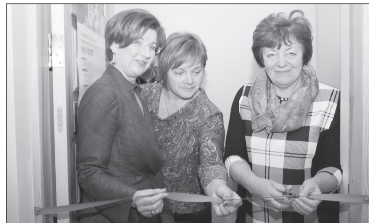
Svinīgā ceremonijā Purmsātu Speciālās internātpamatskolas ēkā atklāts Novada atbalsta centrs bērniem un jauniešiem.

tiskās vērtības un cilvēktiesību ievērošanu, veicināt sociālo integrāciju.