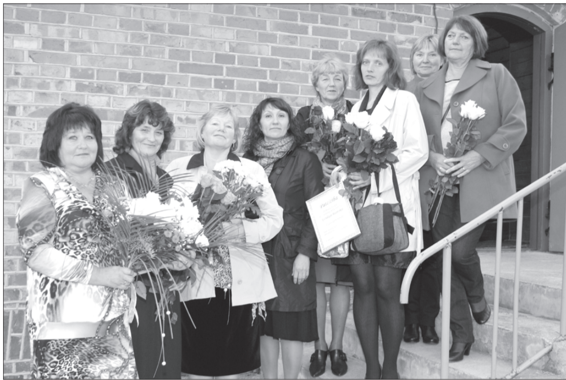
Īpašus sveicienus Skolotāju dienā saņēma pedagogi, kuri šajā gadā atzīmē apaļas darba jubilejas.

pirmsskolas kā arī mūzikas un mākslas skolas audzēkņus māca 177 pedagogi, no tiem 21 jeb 12% ir vīrieši.