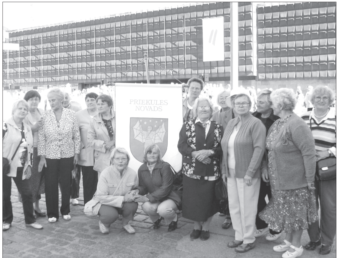
Priekules novada seniори Latvijas Pensionāru federācijas organizētajā mītiņā.