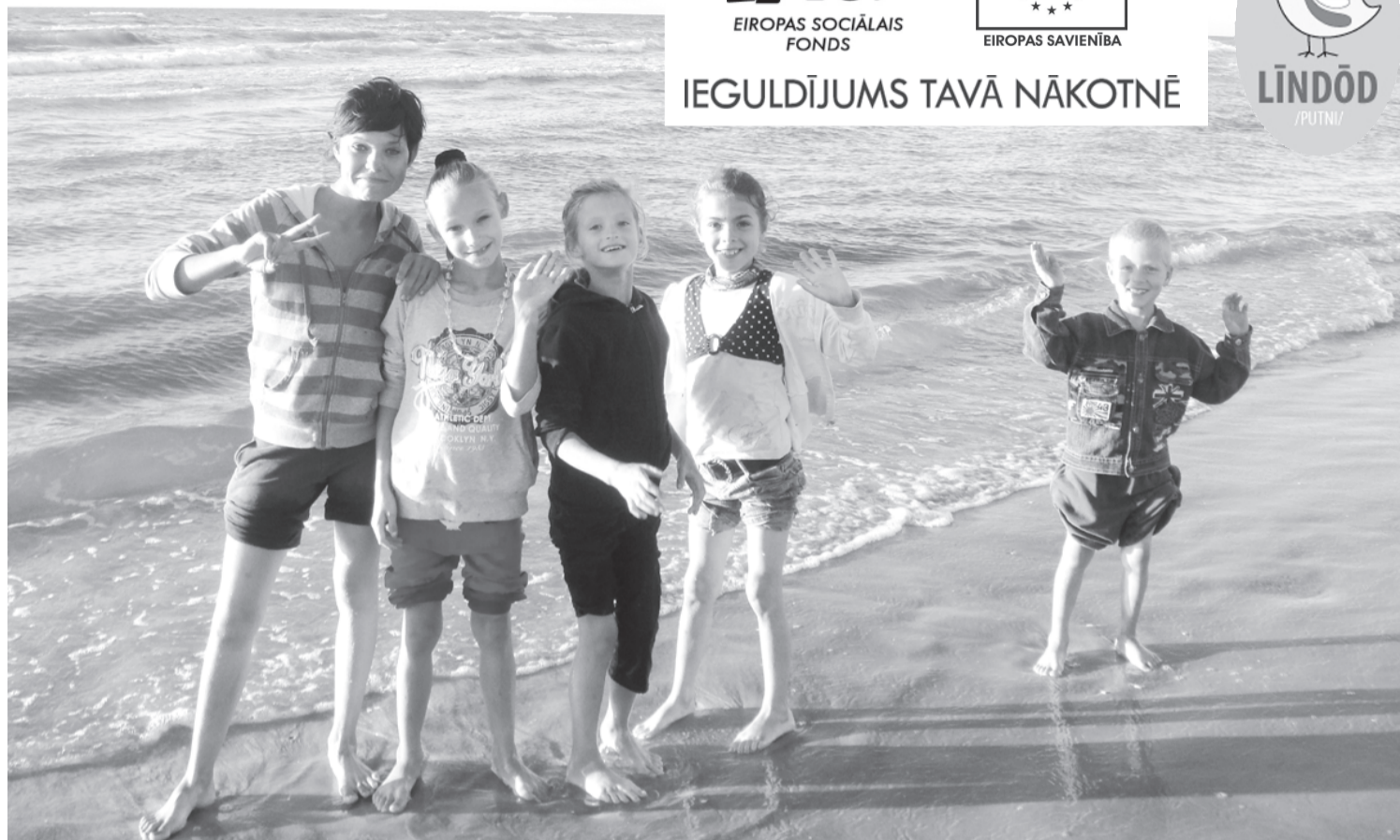
Nometnes dalībnieki pastaigā gar jūr malu.

Neilgi pirms jaunā mācību gada sākuma – no 12. līdz 16. augustam – 30 skolēni no Purmsātu un Liepājas speciālās internātpamatskolas piedalījās aizraujošā, piedzīvojumiem bagātā nedēļas nometnē Mazirbē.