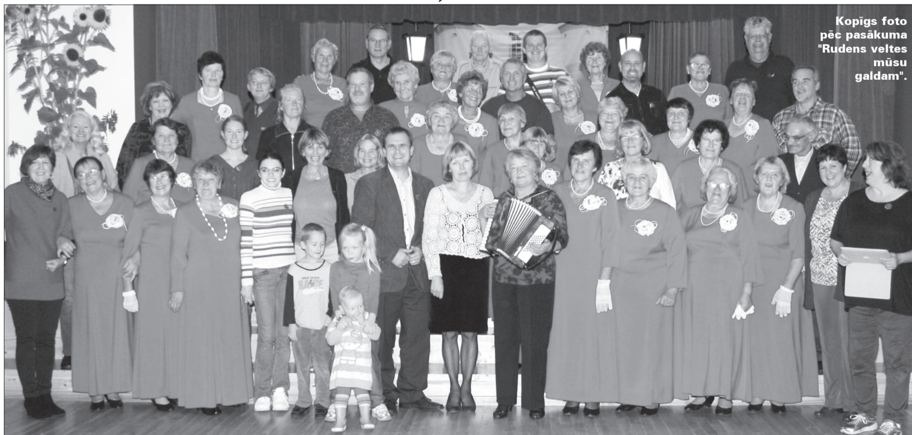
Kopīgs foto pēc pasākuma "Rudens veltes mūsu galdam".

No 19. līdz 23. septembrim Priekulē viesojās cieņi no ASV Floridas štata Fortmaiersas Makgregora baptistu draudzes 16 muzikālu cilvēku sastāvā. Viņu mērķis bija kalpot Dievam un cilvēkiem Priekules novadā, lai stāstītu par sevi un misijas darbu.