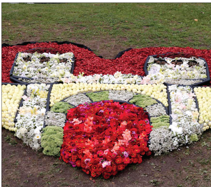
Priekules dārzos uzplaukušos ziedus daudzi puķkopji atvēlēja floristēm krāšņas kompozīcijas veidošanai pie tornīša.