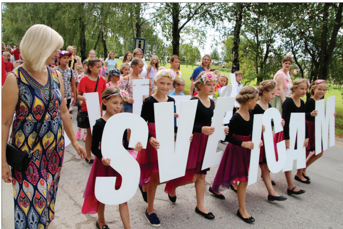
Jaunākā paudze gan sniedza muzikālus sveicienus, gan izbaudīja svētku atmosfēru visas dienas garumā.