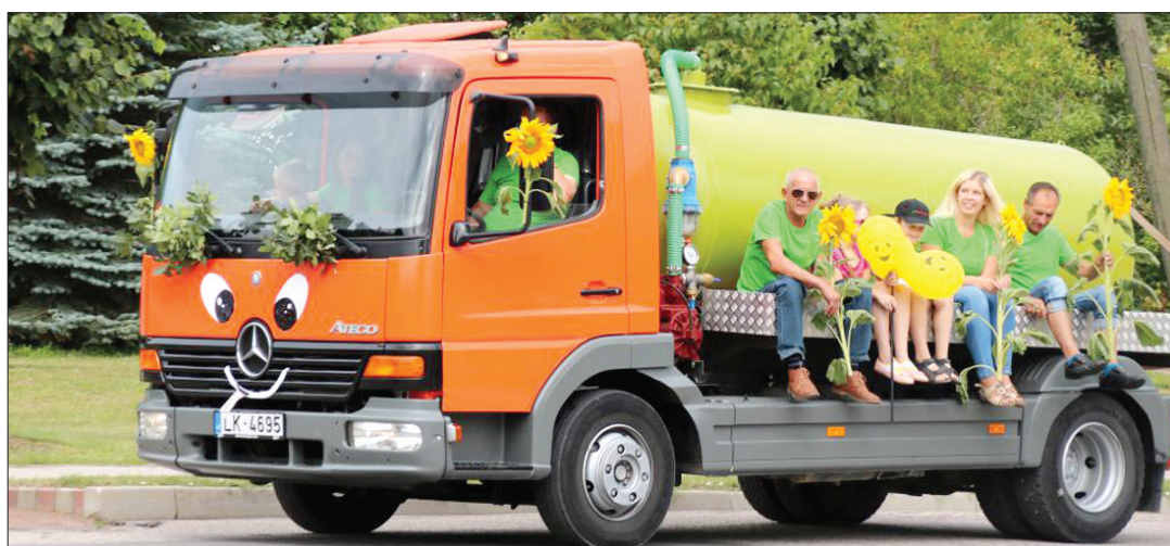
SIA "Priekules nami" komanda bija viens no kolektīviem, kas gājiena laikā izmantoja arī motorizētus līdzekļus. Par godu svētkiem auto krāšņi uzposts.