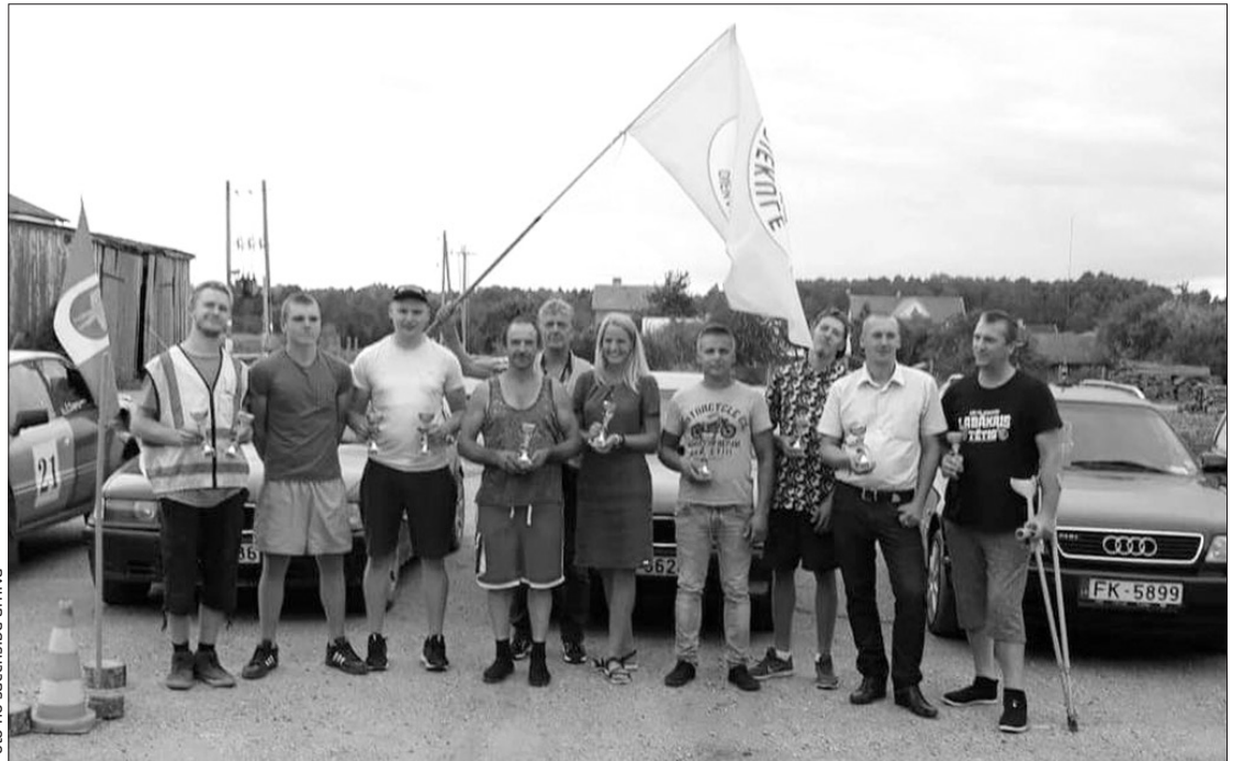
Veiklības brauciena dalībnieki.