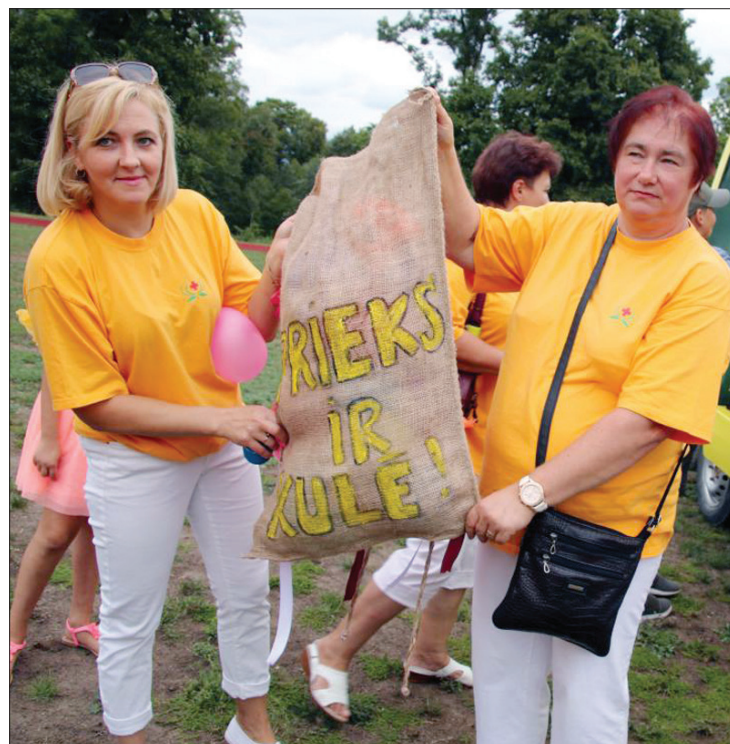
Priekule ir pilsēta, kur prieks mājo kulē – pārliecināti medicīnas darbinieki.