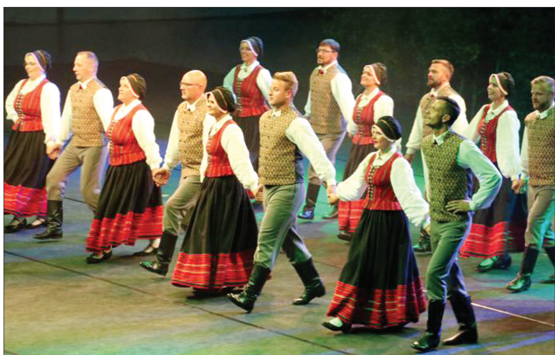
Vidējās paaudzes deju kolektīvs "Duvzare" kopā ar draugiem no citiem Latvijas novadiem vakara lielkoncertā "Četriem vējiem siets" uzbūra deju svētkiem raksturīgo noskaņu.