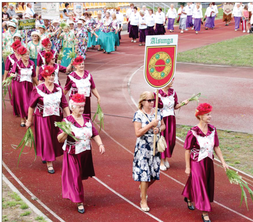
Vecākā paudze prot svinēt dzīvi – to apliecināja kuplais senioru muzikālo kolektīvu pulks, kas krāšņos tērpos un priecīgā garastāvoklī devās kopējā gājienā un vēlāk uzstājās uz skatuves Priekules centrā.