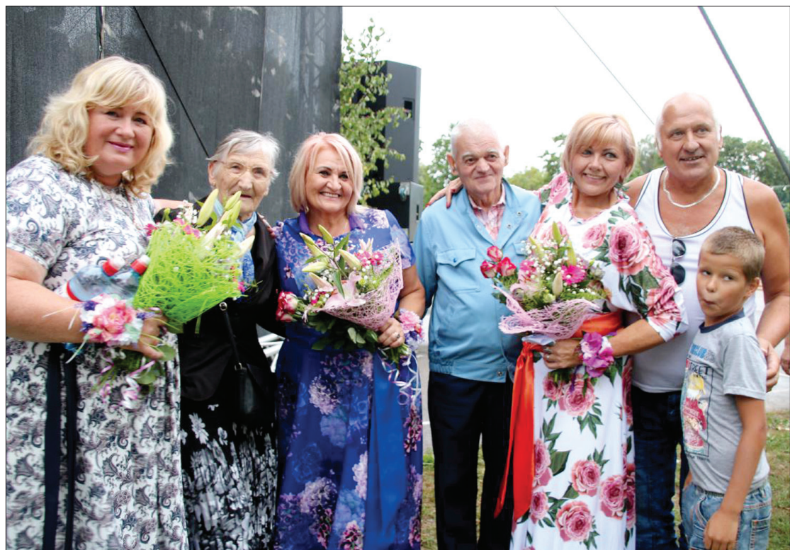
Dziedošajām māsām Legzdiņām ir savs pielūdzēju pulks. Dažādu paaudžu klausītāji kopā ar viņām koncertā labprāt uzdziedāja un vairāki pāri arī uzdejoja.