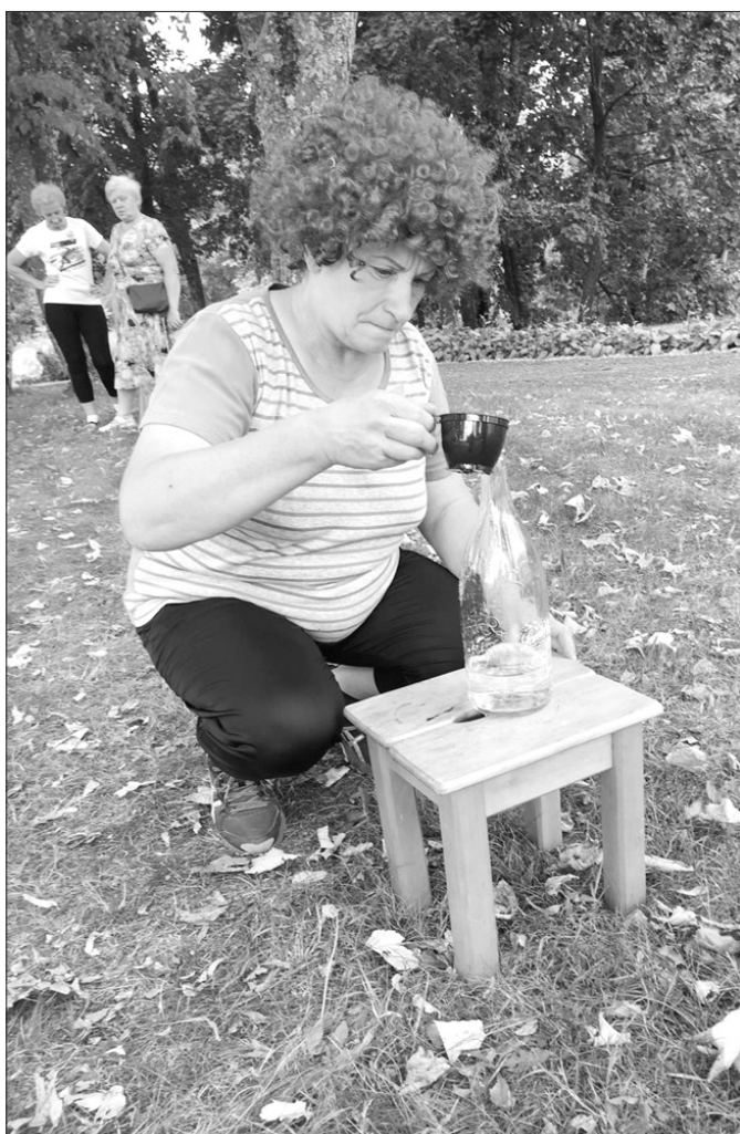
Pasākuma dalībnieki veica dažādus atraktīvus uzdevumus.