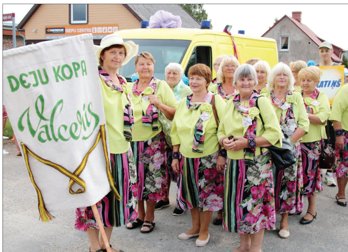
Eiropas deju kopa "Valceris" šogad sevi krāšņi parādīja ne tikai gājiena laikā, bet arī koncertā "Svinam dzīvi", uzstājoties kopā ar draudzīgajiem senioru kolektīviem no dažādām Latvijas malām un Lietuvas.