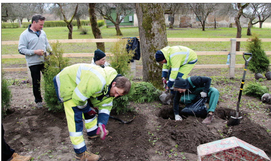
Kupju ģimene Lielajā talkā stāda tūjas Virgas kapos.