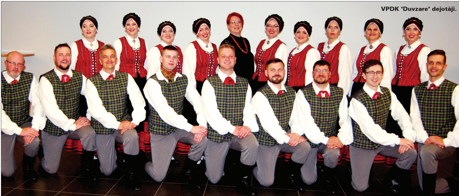
VDPK "Duvzare" dejotāji.