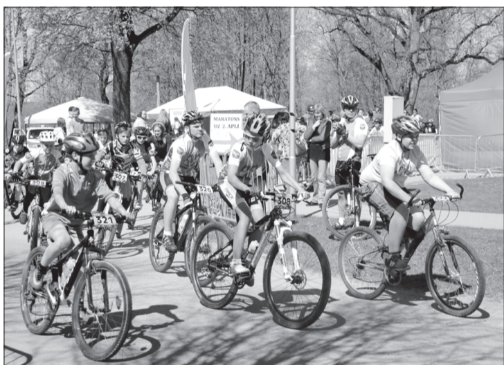
Jaunie ritenbraucēji startē ar lielu azartu.