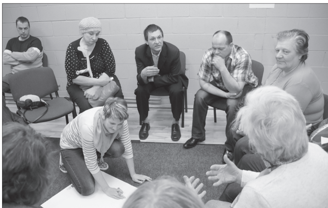
Konferences dalībnieki strādāja grupās, kopīgi meklējot idejas.