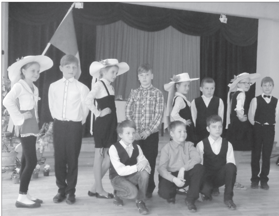
4. klases skolēnu priekšnesums A. Kronvalda atceres pasākumā.