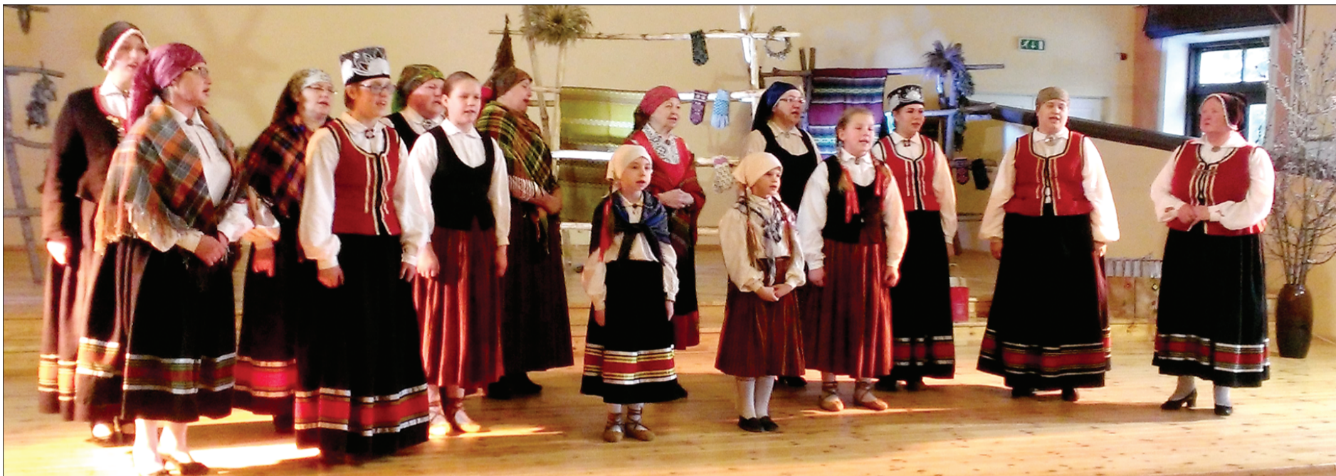
Folkloras kopa "Traisti".