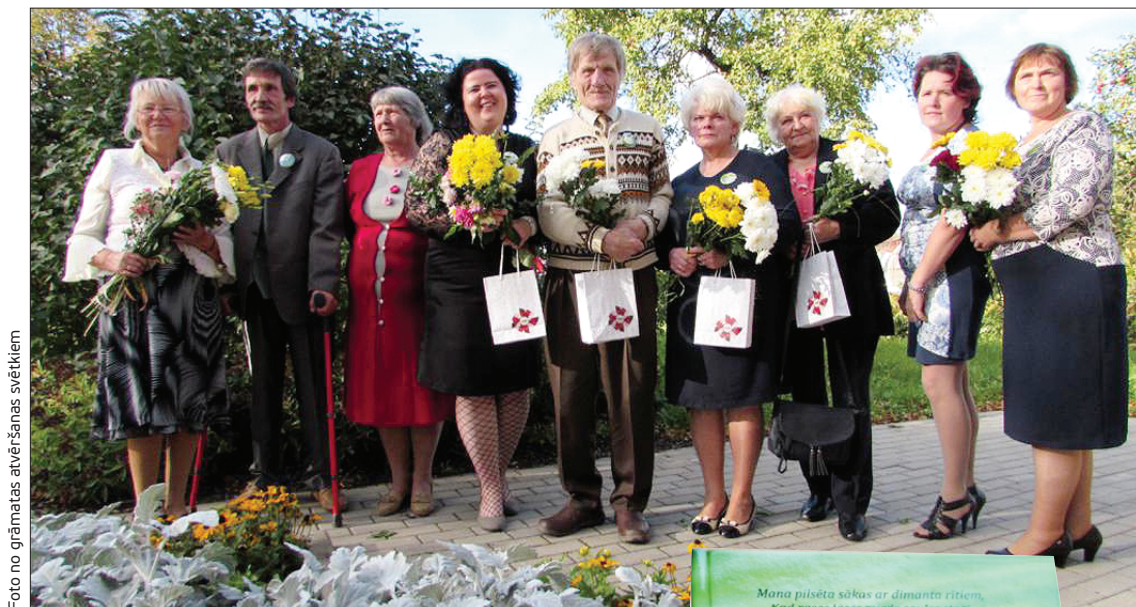
Autori, kuri nebaidījies savus darbus publiskot dzejoļu krājumā "Pa lāsei prieka".