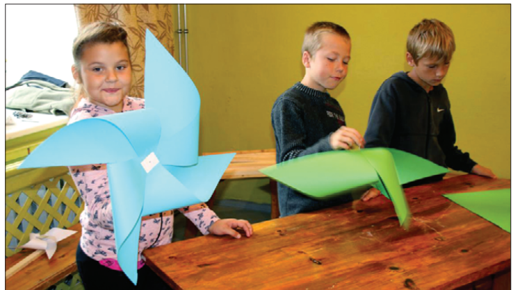
Kalētnieki priecājas par pašdarinātajām dzirnāviņām.