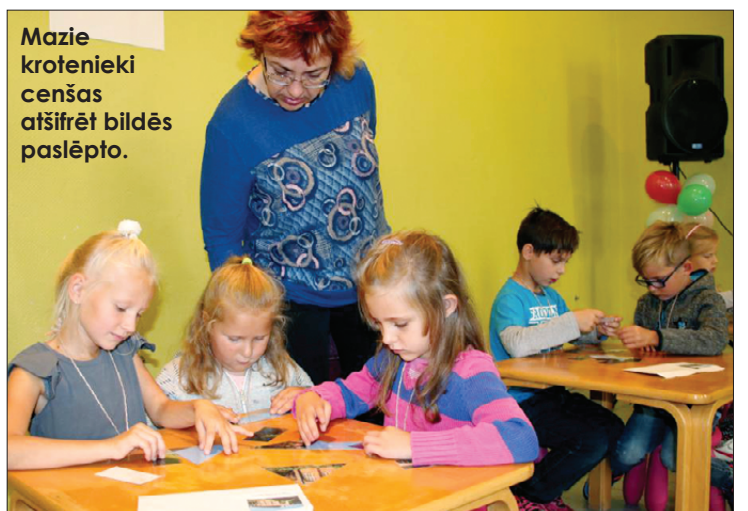
Mazie krotenieki cenšas atšifrēt bildēs paslēpto.