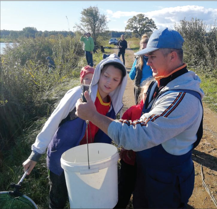
Jaunie makšķernieki ar azartu sacentās par lielāko lomu.

29. septembrī notika bērnu sacensības makšķerēšanā. Meitenes un zēni rādīja savu varēšanu divās vecuma grupās.