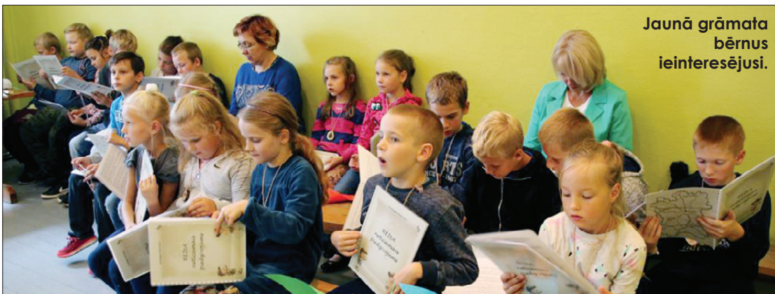
Jaunā grāmata bērnus ieinteresējusi.

Biedrība "Rumula" sadarbībā ar Purmsātu senlietu krātuvi izveidojusi grāmatu "Reiņa neticamais piedzīvojums", kurā saistošā veidā atspoguļoti Priekules novada vēstures fakti, kā arī iekļauti bērnu spējām piemēroti uzdevumi.