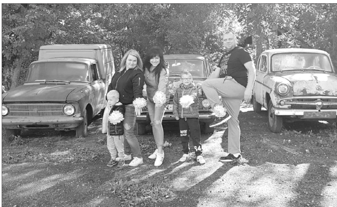
Komanda "Bumbulīši" bija viena no vizuāli radošākajām.