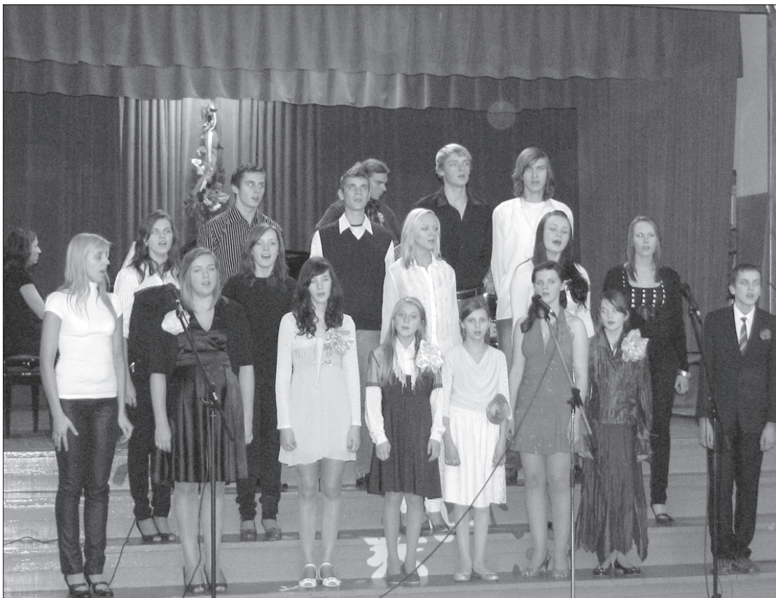
Priekules mūzikas skolas vokālais ansamblis "Puķu bērni", kopā ar skolas absolventiem izpildot dziesmu "Latvju zeme vaļā stāv".

Otrdien, 17. novembrī, Priekules Kultūras namā notika Latvijas dzimšanas dienai veltīts koncerts un izstāde.