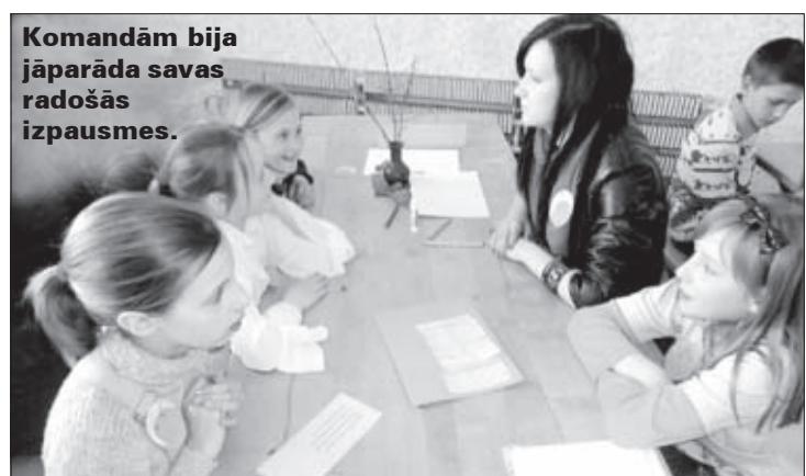
Komandām bija jāparāda savas radošās izpausmes.

Vērtēšanas kritēriji jau bija paredzēti nolikumā: originalitāte, emocionalitāte, atbilstība minētajam žanram, vārdu krājuma bagātība, māksliniecisko izteiksmes līdzekļu lietojums, valodas stils. Jāsaka,