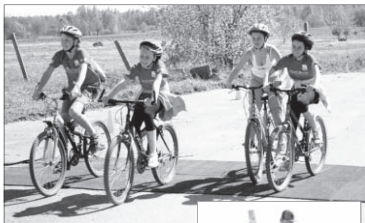
Finisē velotūrisma klases meiteņu kvartets.

Jau pēc neilga laika, apmēram 1,5 stundas, finišu sasniedza pirmie sportisti no 30 km distancēs. Pa laukam finišu cits pēc cita sasniedza lielākā daļa maratona dalībnieku, ieskaitot velotūrisma klasi, kas pa ceļam paspēja apskatīt skaistākos dabas un tūrisma objektus – Ruņupes ieleju ar Lielajā talkā izveidoto skatu laukumu aiz "Rudzīšiem", izbraukt SIA "Inerto Materiālu