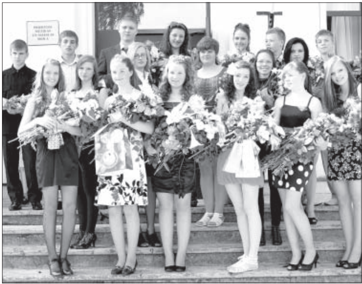
Priekules Mūzikas un mākslas skolas absolventi.