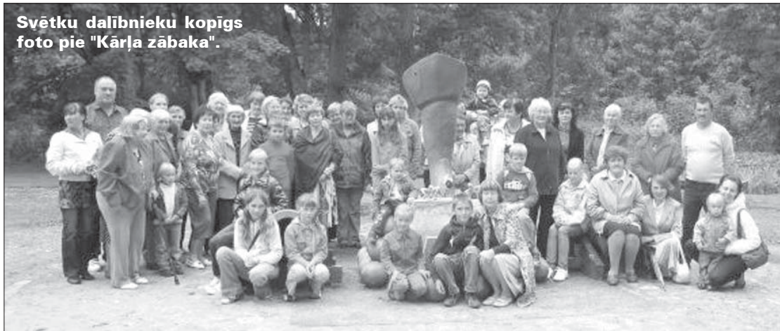
Svētku dalībnieku kopīgs foto pie "Kārļa zābaka".

Biedrības "Zviedru draugu kopa" un Virgas pagasta pārvaldes vārdā – Ruta Balode