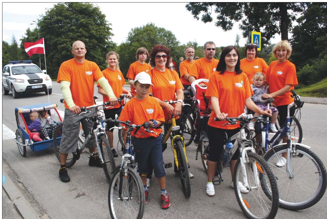
Velobrauciena kuplais dalībnieku pulciņš.