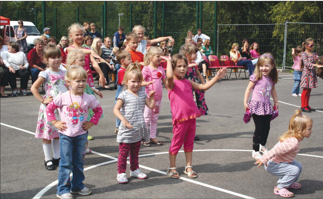
Bērni dziedāja, dejoja un jautrojās leļļu teātra disenītē.