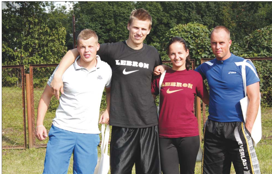
Sporta spēļu uzvarētāju komanda "Es, tu, viņš un Ribiš".