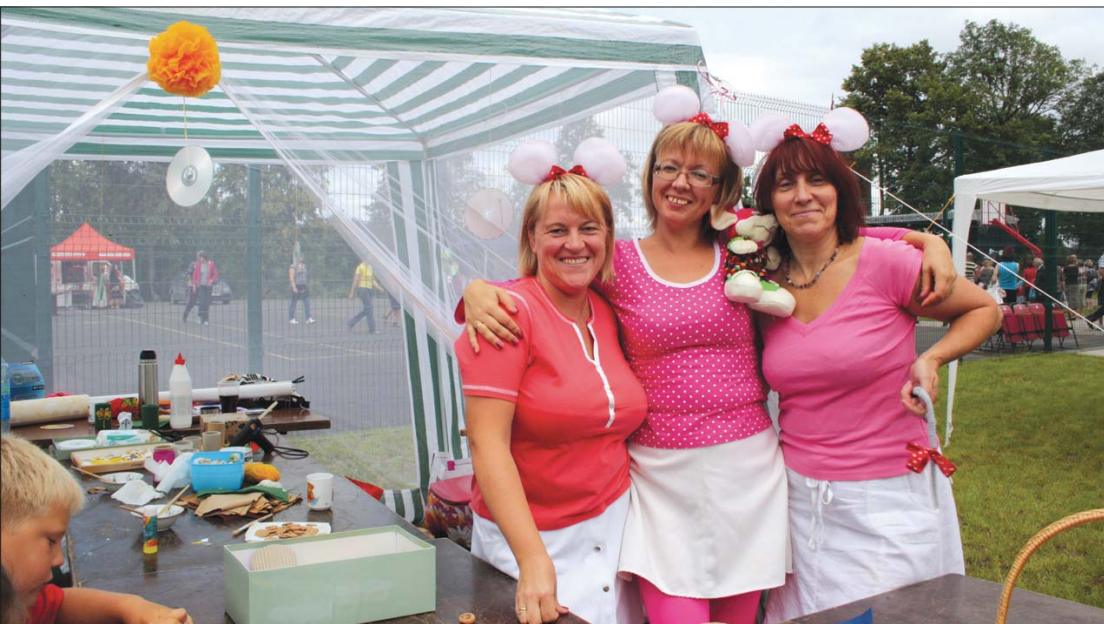
Krāsainās muižas peles aicināja bērnus uz radošām nodarbībām.