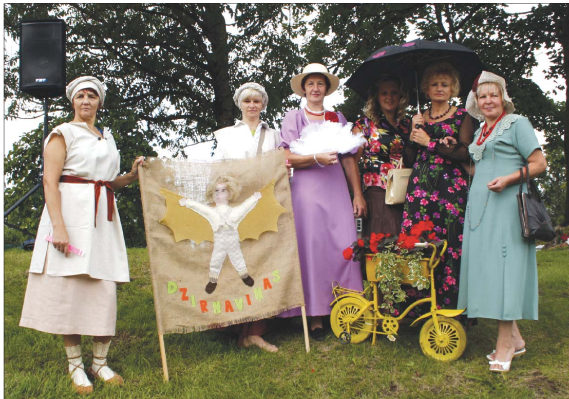
Bērnudārza "Dzirnaviņas" kolektīvs tērpies atbilstoši barona fon Korfa rīkojumam.