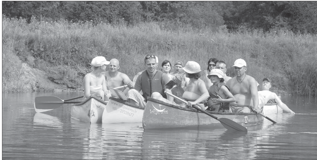
Laivotāji bauda neskartās dabas mieru.

Bariņš priekulnieku pēc aktīvāko Priekules prātu "Priekules velokluba" iniciatīvas devās divu dienu laivu izbraucienā ar kanoe laivām pa Rindu un Irbi 23. un 24. jūlijā.