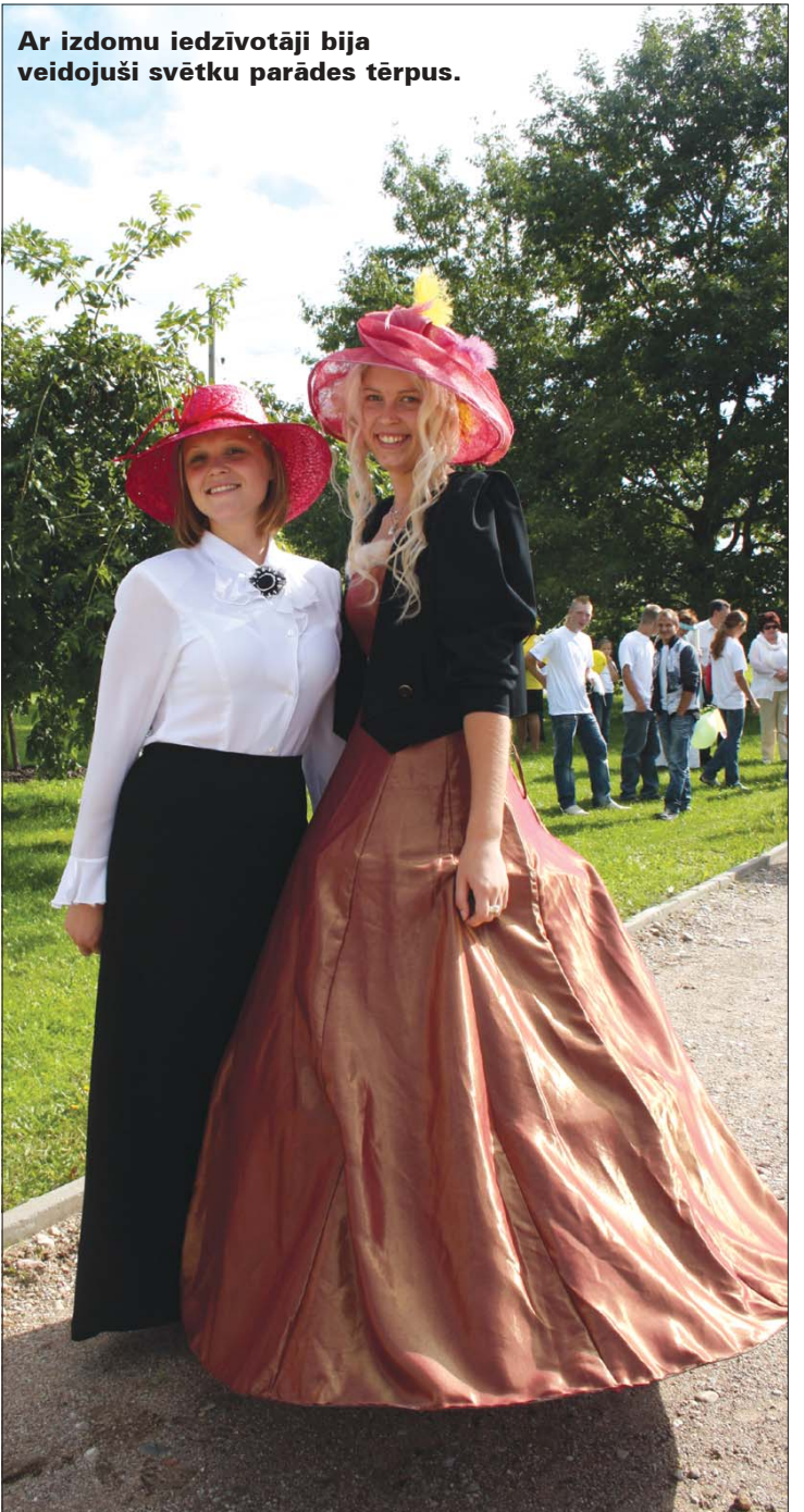
Ar izdomu iedzīvotāji bija veidojuši svētku parādes tērpus.