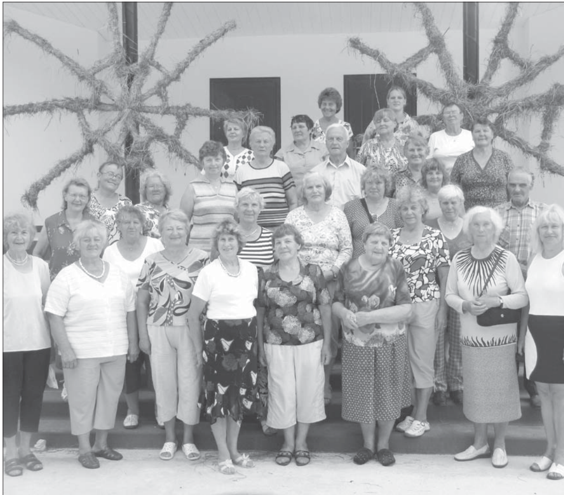
Ekskursijas dalībnieki Riebiņu novada estrādē.