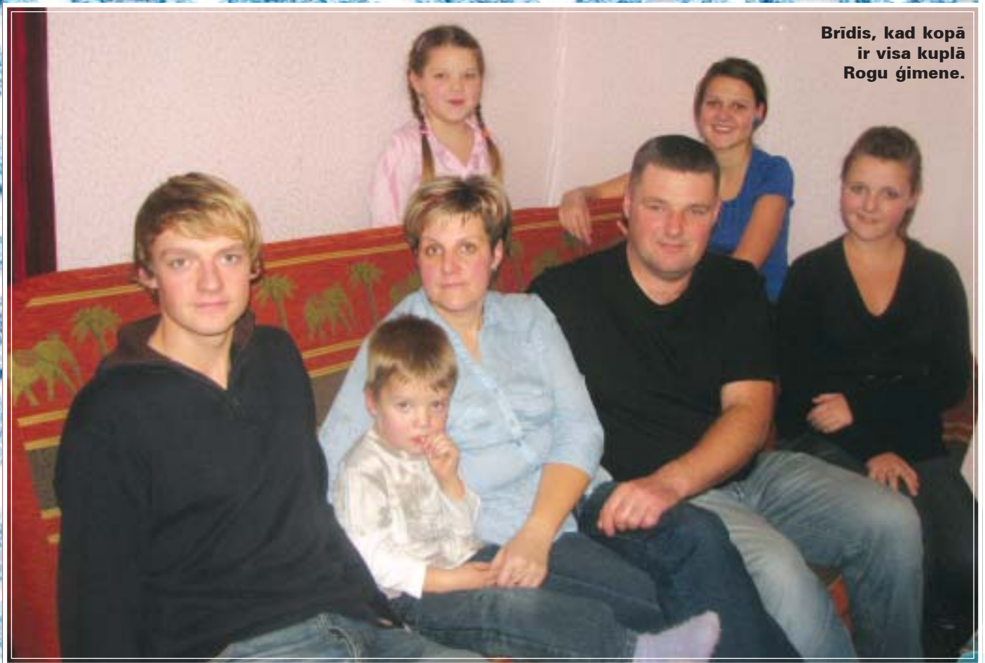
Brīdis, kad kopā ir visa kuplā Rogu ģimene.