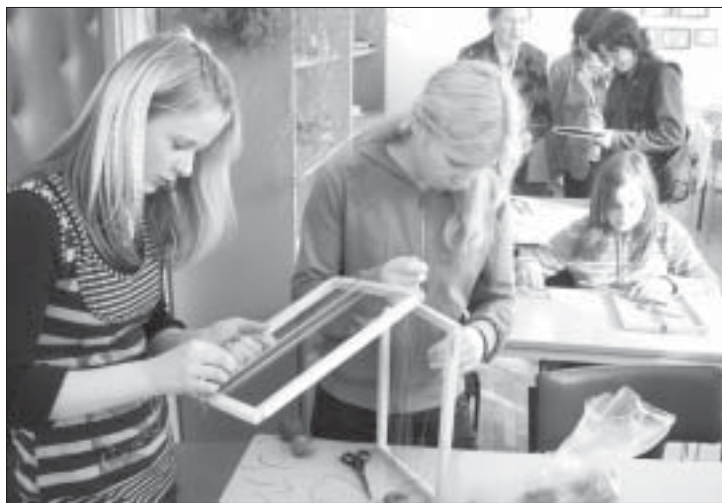
Ar centību un rūpību tiek gatavots katrs darbiņš.

Virgas pagasta biedrībai "Zviedru draugu kopa" šis gads ir bijis bagāts un darbīgs. Visa gada garumā biedrība realizēja projektu "Ģimeņu atbalsta grupa "Varavīksne"", ko finansiāli atbalstīja Latvijas Kopienas iniciatīvu fonds, projekta aktivitātēm piešķirot 2248 latus. Ar 272 latu līdzfinansējumu projektā piedalījās Virgas pagasta padome un ar 167 latiem SIA "Virgas piensaimnieks". Projekta laikā ģimenēm ar bērniem bija iespēja pavadīt savu brīvo laiku dažādās jaunrades darbnīcās un nodarbībās.