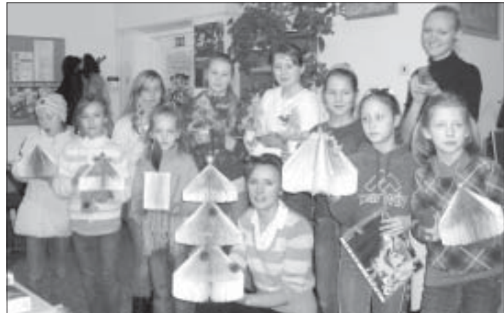
Pasākuma dalībnieki ar prieku izrāda pašdarinātās dāvanīgas.