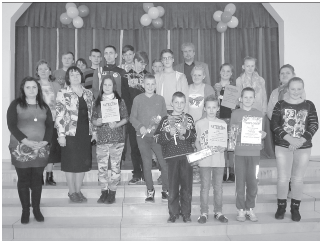
Joku dienas pasākuma dalībnieki.

1. aprīlis visā pasaulē ir pazīstams kā joku jeb smieklu diena, kad cilvēki savā starpā izspēlē dažādus jokus. Tāpēc šajā dienā Gramzdas Tautas namā notika anekdošu šovs, lai visiem smieties gribētājiem būtu iespējams baudīt jautrību.