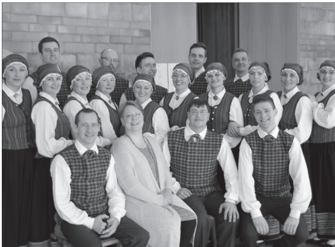
Priekules vidējās paaudzes dejojāji jau otro gadu piedalās Liepājas Deju aprīnča kolektīvu skatē.