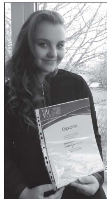
"Ekselentā smidzinātāja" Lejaskurzemē.

Konkursā dalībniekiem un uzvarētājiem bija sagādātas bagātīgas dāvanas. Mans mērķis ir krāt un apkopot interesantākās anekdotes, lai varētu piedalīties arī nākamajos konkursos. Smeijieties un esiet veseli un laimīgi!