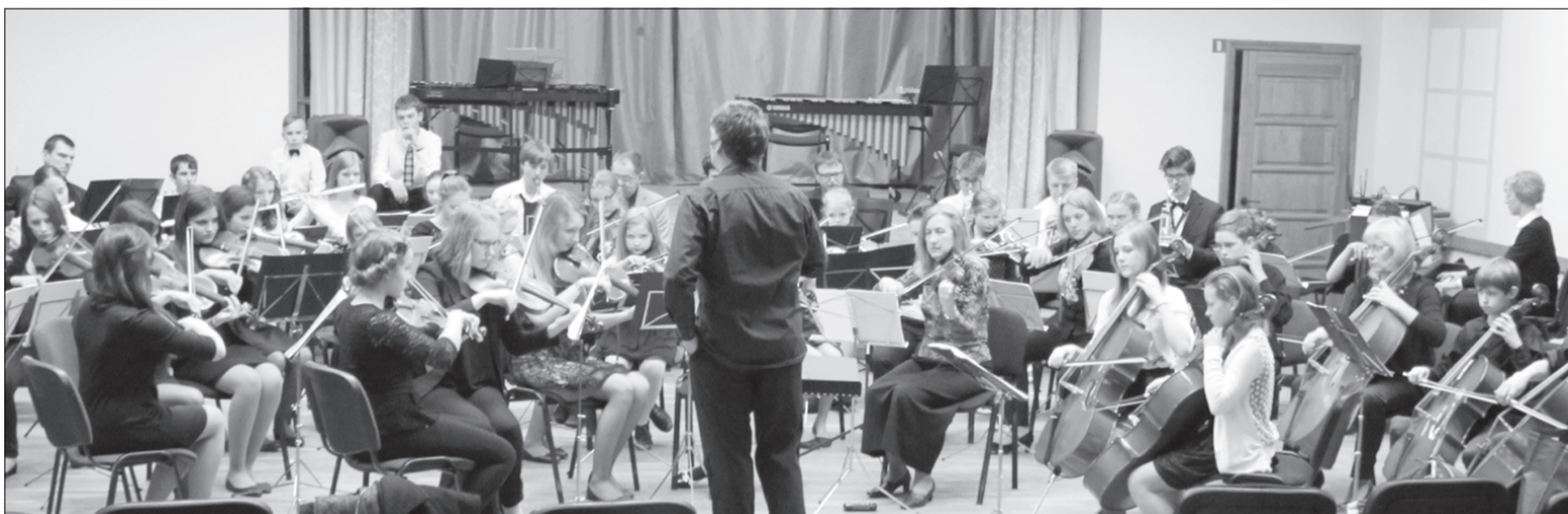
Pasākuma izskaņā spēlēja simfonisko orķestru apvienotais sastāvs, kas izpildīja pazīstamas kino un deju melodijas.

27. martā Priekulē viesojās Krimuldas-Limbažu jauniešu un Mārupes Mūzikas un mākslas skolas simfoniskais orķestris. Dienas gaitā notika Priekules un Mārupes skolu simfonisko orķestru kopmēģinājumi, gatavojot programmu skatei un