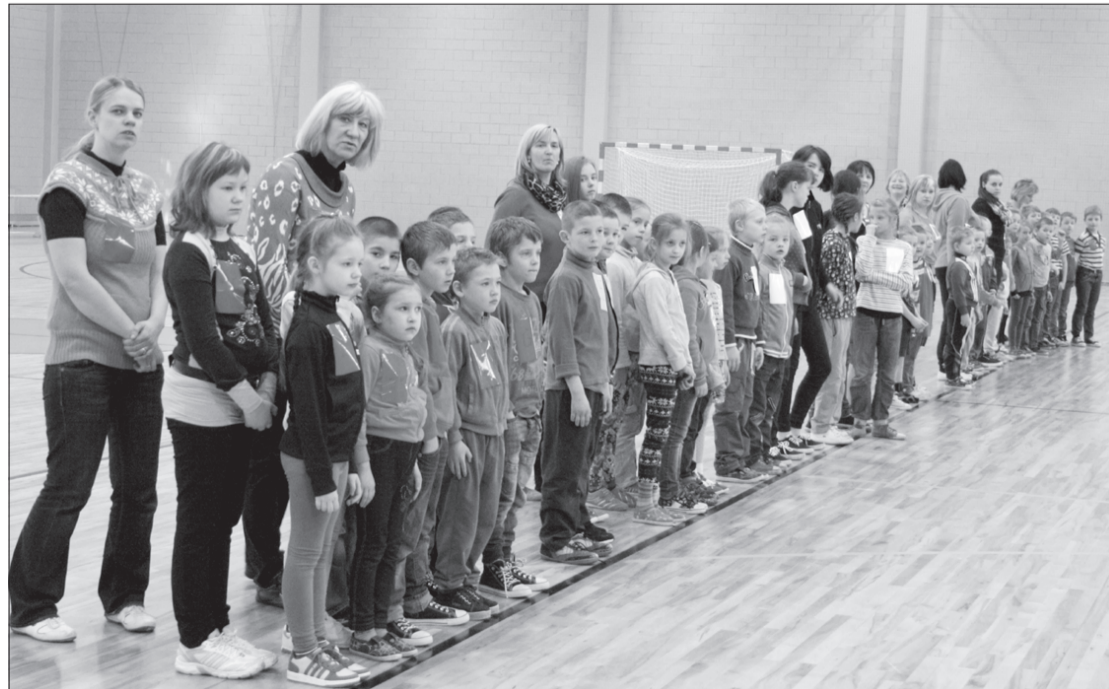
Pasākums pulcēja ap 40 bērnu no visa novada.

Modris Baumanis, Attīstības plānošanas nodaļas vadītājs