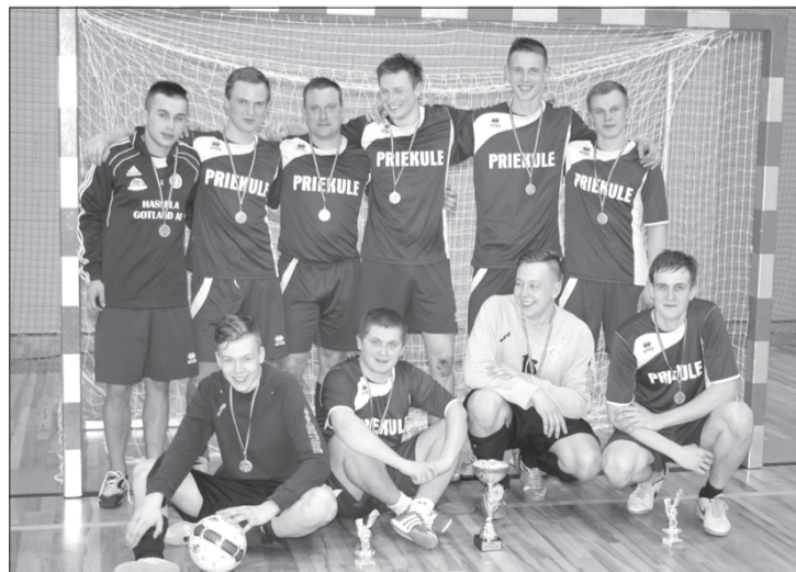
Jaunie čempioni priecīgi par gūto uzvaru.