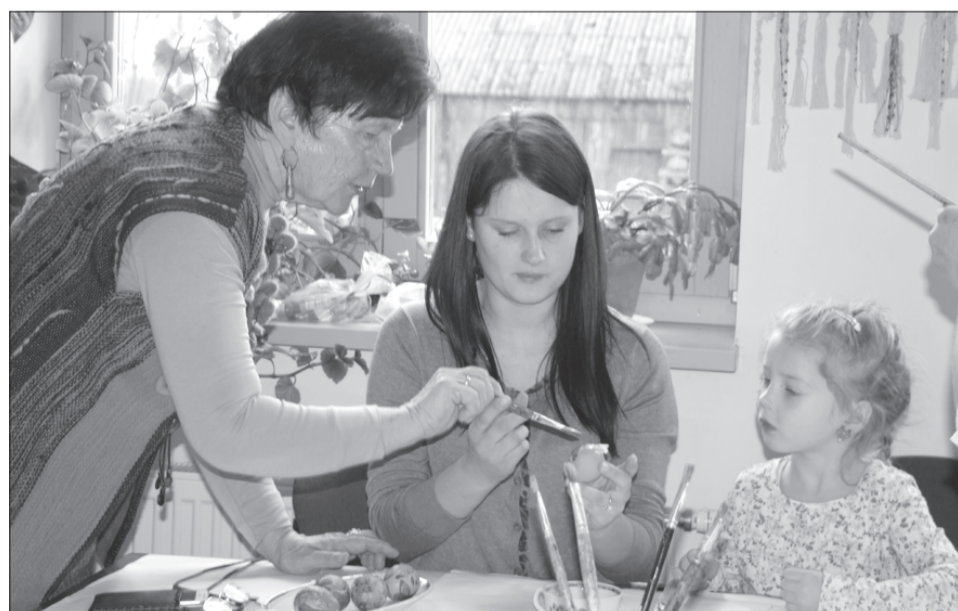
Radošās darbnīcas pulcēja dažādu paaudžu pārstāvjus.