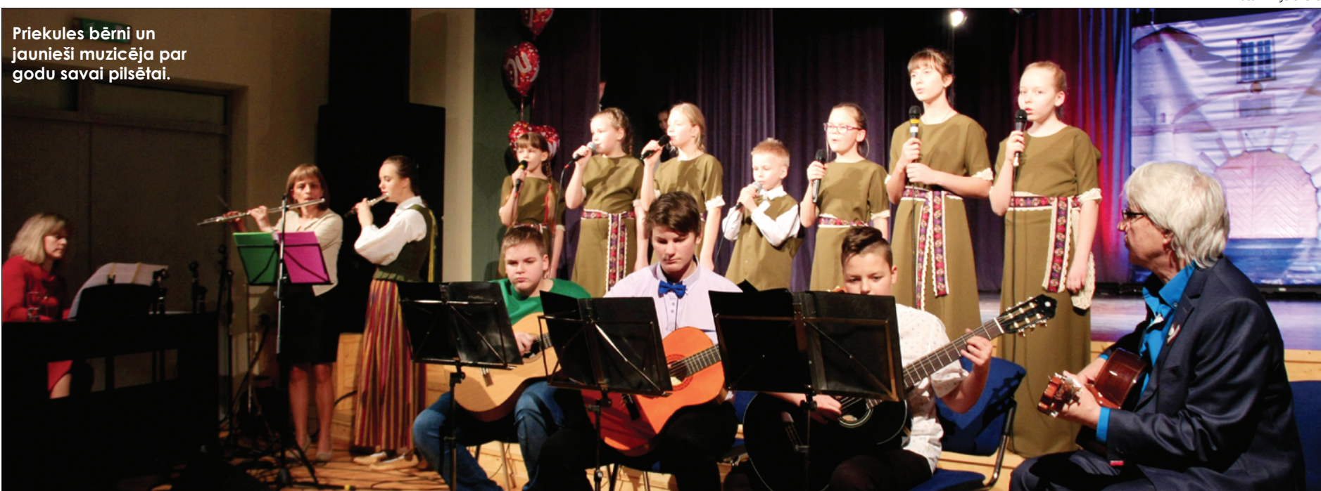
Priekules bērni un jaunieši muzicēja par godu savai pilsētai.