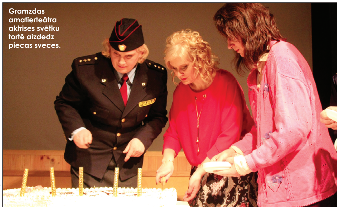
Gramzdas amatierteātra aktrises svētku tortē aizdedz piecas sveces.