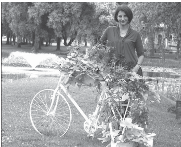
Liene ik gadu meklē idejas, kā ziedošos velosipēdus atjaunot un padarīt interesantākus.

Kopš 2009. gada, kad izveidots Priekules novads, ikviens pagasta centrs kļūst arvien sakoptāks. Novada iedzīvotāji un viesi var novērtēt, kā gadu gaitā mainās un dienu pēc dienas skaistāka kļūst mūsu novada pilsēta – Priekule.