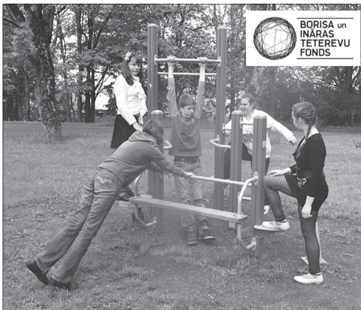
Bērni un jaunieši uz vingrošanas iekārtām priecīgi rādīja savu fizisko varēšanu.

Biedrība "Rumula" projekta "Veselībai un dzīvotpriekam" ietvaros 26. maijā noorganizēja pēdējo no plānotajām aktivitātēm – pasākumu "Trīs vienā" terapeitiskās vingrošanas laukumā. Tajā bija iespēja satikties visām Purmsātu iedzīvotāju paaudzēm.