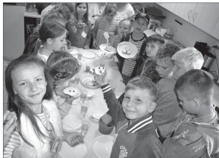
Bērni paši sev pagatavoja ikdienas uzkodas.

kurās bērni varēja skriet, sacensties komandu stafetēs, kā arī mācīties gan uzvarēt, gan zaudēt. Nodarbību beigās bērni devās mājup ar misijas uzdevumu – izdarīt kādu labu darbiņu ģimenē.