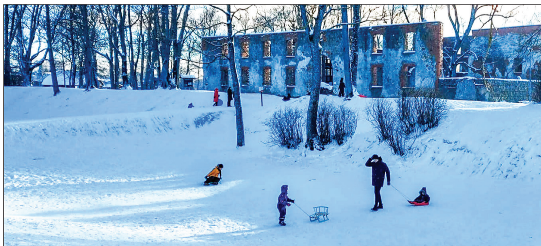
Kalniņš Grobiņā pie pilsdrupām sniegotās brīvdienās ir pilns ar ziemas prieku baudītājiem.