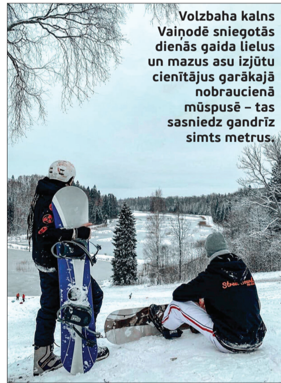
Volzbaha kalns Vaiņodē sniegotās dienās gaida lielus un mazus asu izjūtu cienītājus garākajā nobraucienā mūspusē – tas sasniedz gandrīz simts metrus.