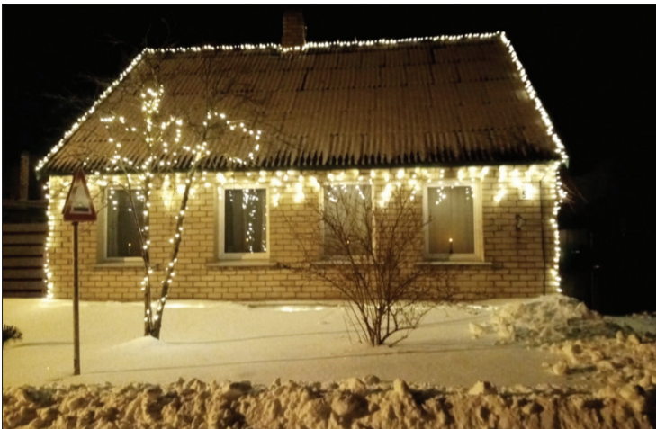
Siltu un gaišu noskaņojumu namiņam Pāvilstā, Viļņu ielā 5, uzbūrusi Šnoru ģimene.

Marita Horna, biedrības "Pāvilstas kultūrvēsturiskais vides centrs" vadītāja