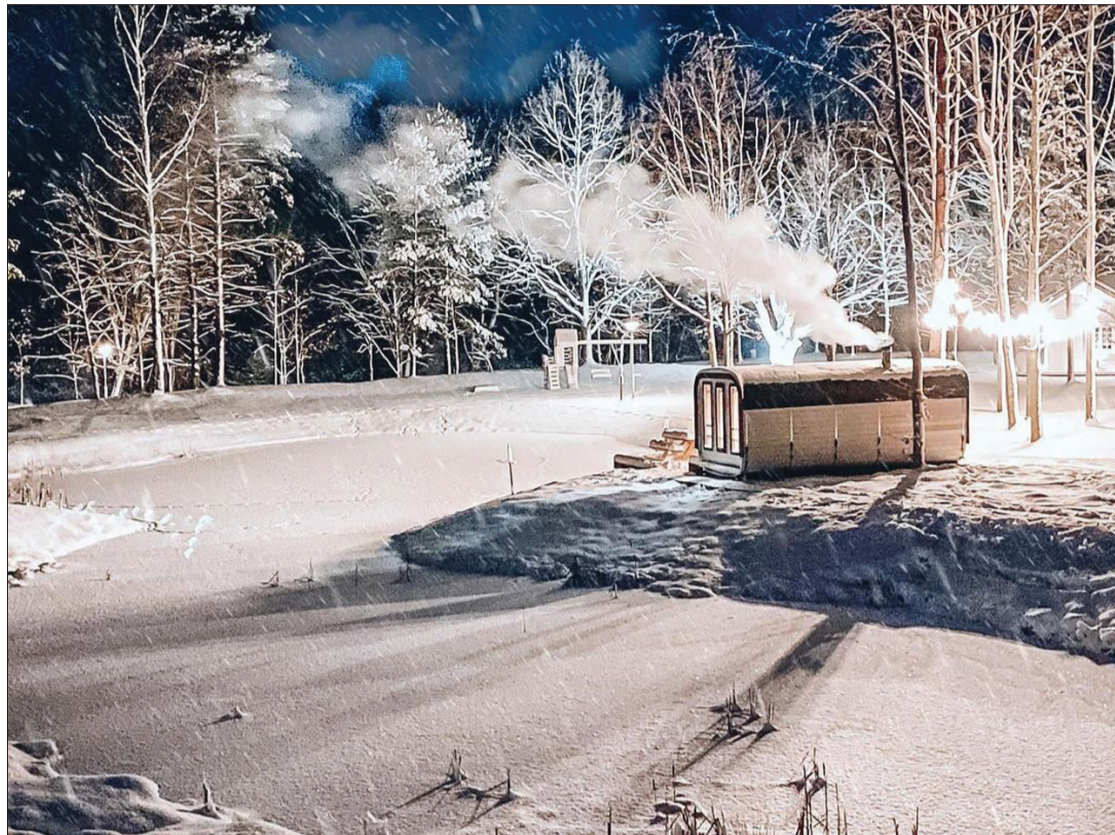
Aukstajos ziemas vakaros karsta pirtīna atpūtas kompleksā "Bārtas krasts" sasilda, bet apkārtnē iepriecina ar skaistiem ziemas skatiem.

Sekot līdzi aktuālajai informācijai par ziemas prieku baudīšanu un visu pārējo aktuālo tūrisma jomā var mājaslapā www.dienvidkurzeme.travel , kā arī sociālajā tīklā www.facebook.com/DienvidkurzemeTravel .