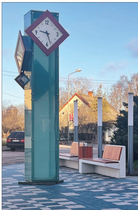
Projekta īstenošanas gaitā bruģakmens pie pulksteņa veidots Sakas tautastērpa brunču rakstā un krāsā.

Pašvaldība ir realizējusi Eiropas Jūrlietu un zivsaimniecības fonda (EJZF) pasākuma "Sabiedrības virzītas vietējās attīstības stratēģijas īstenošana" programmā atbalstīto projektu "Pilsētas vides objekta – pulksteņa izveide Pāvilostas pilsētas centrā 2. kārtā", I.D. Nr. 19-02-AL13- A019.2203-000005.