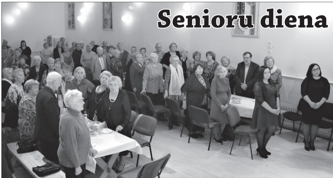
Sirsnīgā kopkorī, dziedot "Pie Dieviņa garī galdi", vienojās ap 100 mūsu novada senioru.