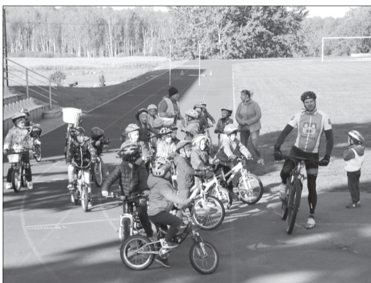
4. diena – "Dzirnaviņu" velosipēdisti kopā ar Priekules veloklubu.