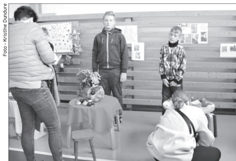
Islandieši vērtē mazpulcēnu izaudzētās rudens veltes.

Miķeļtirgus kā tradīcija jau teju 25 gadu garumā tiek plaši apmeklēts. Folkloras kopas "Traistēni" tirgus aizsācies šaurā lokā, kad pārsvarā notika preču apmaiņa. Gadiem ejot, Krotē iedzīvotāji to atbalstījuši un labprāt piedalās. Arvien vairāk iesaistījās ģimenes, un tirgus kļuvis populārs. Miķeļtirgus iesākās ar "Traistēnu" uzstāšanos. Folkloras kopa organizēja dažādas atrakcijas. Tas noritēja ļoti jaukā gaisotnē. Islandes viesi labprāt