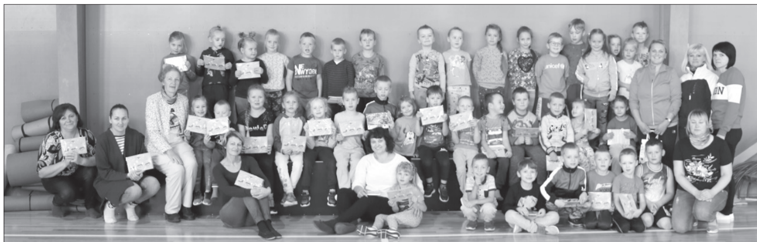
3. diena – Priekules un Kalētu pirmsskolas bērni sporto kampaņas "Kustinācija" ietvaros.