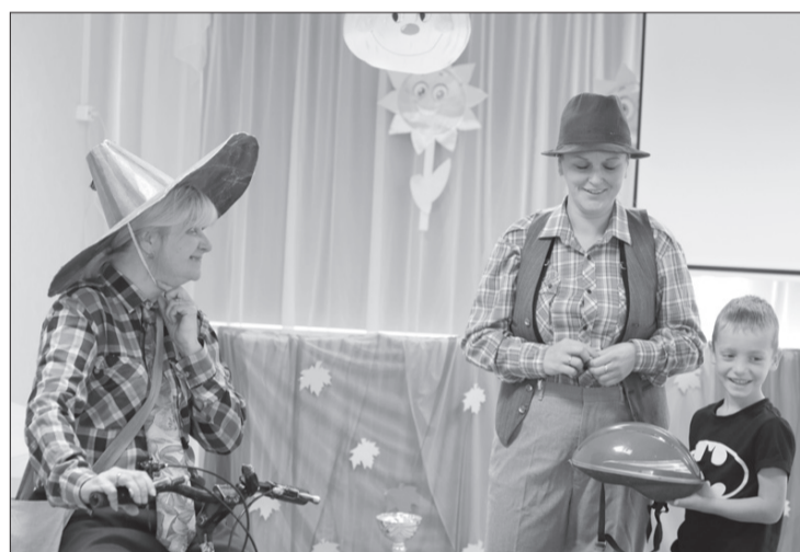
5. diena – viktorīna SPORTO VISOS GADALAIKOS. Zinītis kopā ar bērniem stāsta Nezinītim par dažādiem sporta veidiem.