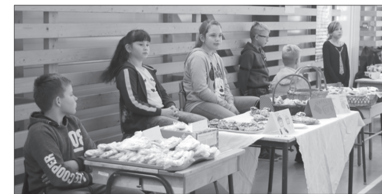
Krotē jaunieši firdziņā.